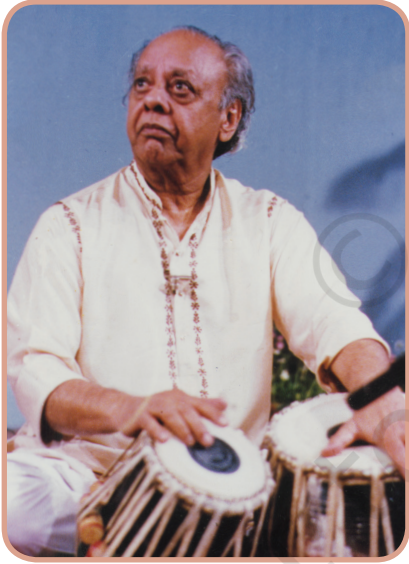
चित्र 1.1 – तबला बजाते हुए उस्ताद अल्ला रक्खा

ठेके को ताल का मूर्त रूप भी कह सकते हैं। यद्यपि उत्तर भारतीय तालों के ठेकों में कहीं-कहीं विरोधाभास भी दृष्टिगत होता है। कुछ प्रचलित तालों को छोड़ दिया जाए तो कई तालों के अलग-अलग ठेके भी प्रचार में देखने को मिलते हैं। उत्तर भारतीय संगीत में जैसे-जैसे तालों का विकास हुआ है, उसी प्रकार दक्षिण भारतीय संगीत, मणिपुरी संगीत, ओडिशी संगीत, सत्रीय संगीत, रवीन्द्र संगीत आदि शैलियों के अनुरूप भी तालों का विकास हुआ है।