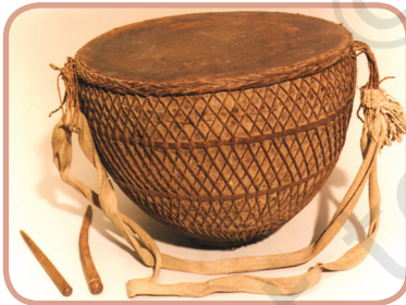
चित्र 1.3 – नगाड़ा — अवनद्ध वाद्य

ताल संगीत का प्राण है। सर्वप्रथम नारद कृत संगीत मकरंद ग्रंथ में ताल के इन अनिवार्य दस तत्वों को प्राण संज्ञा के रूप में बताया गया है। यद्यपि भरत मुनि ने ताल के इन दस प्राणों का प्राण संज्ञा के रूप में न उल्लेख कर इन्हें ताल के घटकों के रूप में प्रकट किया है। संगीत मकरंद के अनुसार —