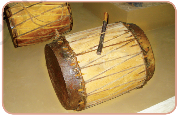
चित्र 1.4 – ढोल — हमारे पारंपरिक वाद्य

4. अंग — इसका अर्थ है, भाग या खंड। ताल के विभिन्न भागों या खंडों को अंग कहते हैं, जिसकी रचना मात्राओं के द्वारा होती है। उत्तर भारतीय तालों में जिसे विभाग कहते हैं, उसे दक्षिण भारतीय पद्धति में अंग कहते हैं। आधुनिक तालों के विभाग या अंग एक मात्रा से लेकर अधिकतम पाँच मात्रा तक मिलते हैं।