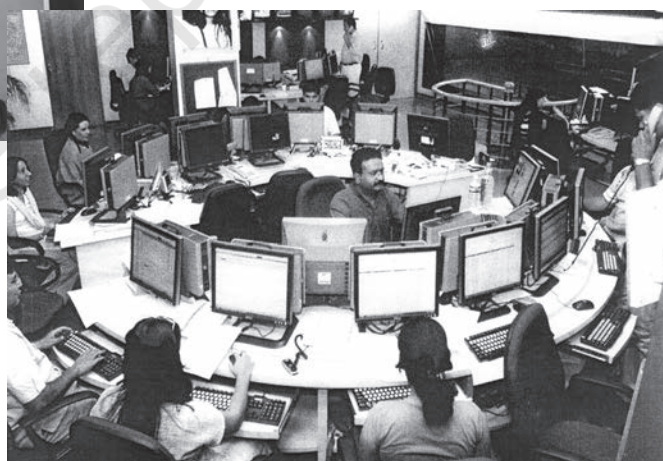
21वीं सदी का दूरदर्शन समाचार कक्ष, भारत

औद्योगिक क्रांति के साथ ही, मुद्रण उद्योग का भी विकास हुआ। कुलीन मुद्रणालय के प्रथम उत्पाद साक्षर अभिजात लोगों तक ही सीमित थे। तत्पश्चात् 19वीं सदी के मध्य भाग में आकर जब प्रौद्योगिकियों, परिवहन और साक्षरता में और आगे विकास हुआ, तभी समाचारपत्र जन-जन तक पहुँचने लगे। देश के विभिन्न क्षेत्रों में रहने वाले लोगों को एक जैसे समाचार पढ़ने या सुनने को मिलने लगे। ऐसा कहा जाता है कि इसी के फलस्वरूप देश के विभिन्न भागों में रहने वाले लोग परस्पर जुड़े