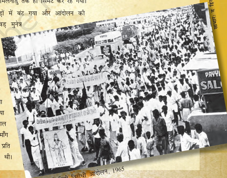
तमिलनाडु में हिंदी विरोधी आंदोलन, 1965