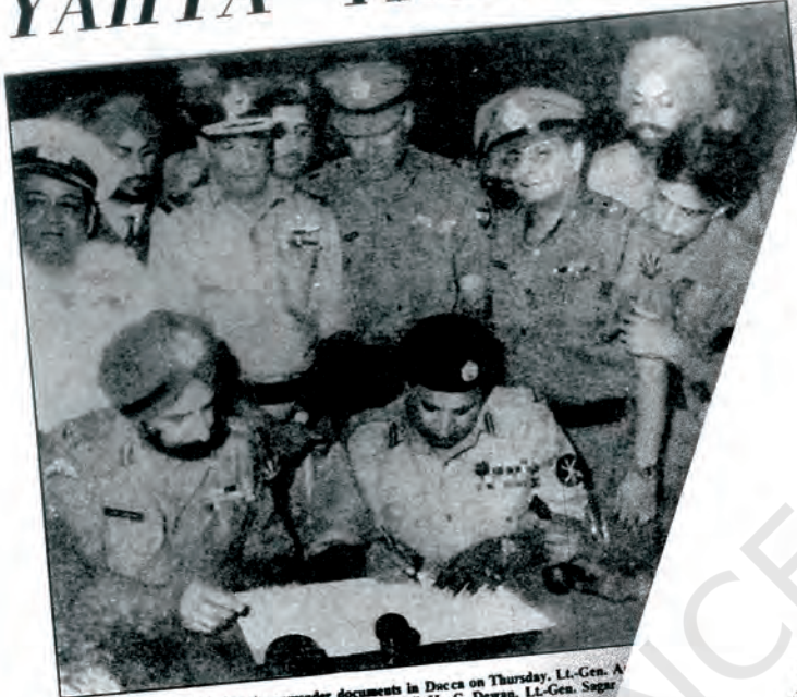
Gen. A. K. Niazi signing the surrender documents in Dacca on Thursday. Lt.-Gen. A. Singh from left are Vice Admiral Krishnan, Air Marshall H. C. Dewan, Lt.-Gen. Sagar