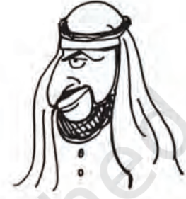
शेख पैट्रो डॉलर-उल्ला काला सोना मुल्क के सुल्तान

बेशकीमती चीज़ों की मैं कद्र करता हूँ बिग ऑयल कहते हैं कि उनके राष्ट्रपति आज़ादी और जम्हूरियत को बड़ा कीमती मानते हैं इसीलिए मैंने भी अपने मुल्क में आज़ादी और जम्हूरियत को सात तालों के भीतर बंद करके रखा है।