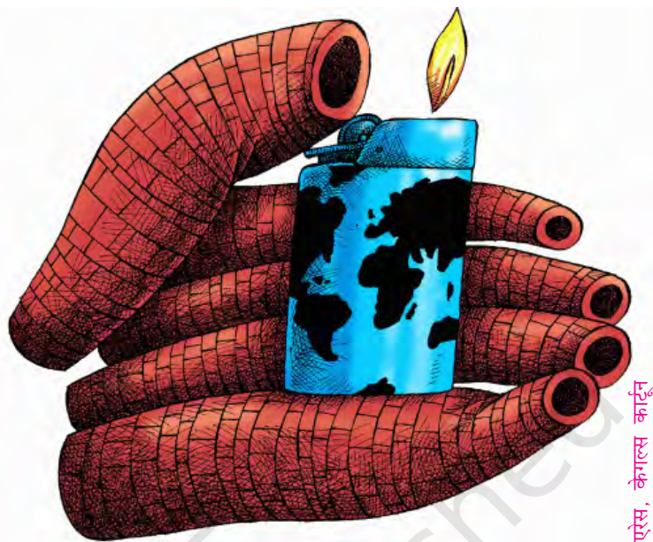
ऐसे, केगल्स कार्टून

हालाँकि पर्यावरण से जुड़े सरोकारों का लंबा इतिहास है लेकिन आर्थिक विकास के कारण पर्यावरण पर होने वाले असर की चिंता ने 1960 के दशक के बाद से राजनीतिक चरित्र ग्रहण किया। वैश्विक मामलों से सरोकार रखने वाले एक विद्वत् समूह 'क्लब ऑव रोम' ने 1972 में 'लिमिट्स टू ग्रोथ' शीर्षक से एक पुस्तक प्रकाशित की। यह पुस्तक दुनिया की