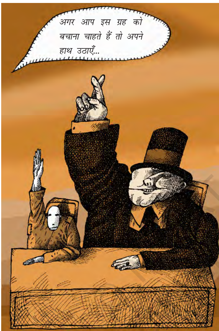
एरिस, केगल्स कार्टून

क्या पृथ्वी की सुरक्षा को लेकर धनी और गरीब देशों के नज़रिए में अंतर है?