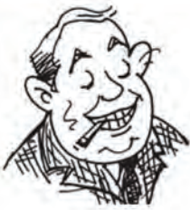
जनाब बिग ऑयल बिग ऑयल एंड संस के सीईओ

एक दिन मैंने खुद से पूछा कि आखिर मैं अपने मुल्क के किस काम आ सकता हूँ। मेरे मुल्क में तेल की भूख विकट है। वह कभी खत्म होने का नाम नहीं लेती, चलो, तो फिर तेल का इंतज़ाम करते हैं। मैं बाज़ार की आज़ादी का हामी हूँ। मतलब यह कि दूर के देशों में तेल के कुएँ खोदने की आज़ादी; धरती की आबो-हवा को मटियामेंट करने की आज़ादी और ऐसे कठपुतले तानाशाहों की ताजपोशी की आज़ादी जो अपनी ही जनता पर कोड़े फटकारे।