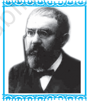
Henri Poincare (1854-1912 )

अवकल समीकरणों का उपयोग मुख्य रूप से भौतिकी, रसायन विज्ञान, जीव विज्ञान, मानव विज्ञान, भूविज्ञान, अर्थशास्त्र आदि विभिन्न क्षेत्रों में किया जाता है। अतः सभी अत्याधुनिक वैज्ञानिक अन्वेषणों के लिए अवकल समीकरणों के गहन अध्ययन की अत्यंत आवश्यकता है। इस अध्याय में, हम अवकल समीकरण की कुछ आधारभूत संकल्पनाओं, अवकल समीकरण के व्यापक एवं विशिष्ट हल, अवकल समीकरण का निर्माण, प्रथम कोटि एवं प्रथम घात के अवकल समीकरण को हल करने की कुछ विधियाँ और विभिन्न क्षेत्रों में अवकल समीकरणों के कुछ उपयोगों के बारे में अध्ययन करेंगे।