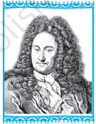
G .W. Leibnitz (1646–1716)

यदि एक फलन f किसी अंतराल I में अवकलनीय है अर्थात् I के प्रत्येक बिंदु पर फलन के अवकलज f' का अस्तित्व है, तब एक स्वाभाविक प्रश्न उठता है कि यदि I के प्रत्येक बिंदु पर f' दिया हुआ है तो क्या हम फलन f ज्ञात कर सकते हैं? वे सभी फलन जिनसे हमें एक फलन उनके अवकलज के रूप में प्राप्त हुआ है, इस फलन के प्रतिअवकलज (पूर्वग) कहलाते हैं। अग्रतः वह सूत्र जिससे