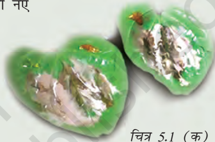
चित्र 5.1 (क) पान के पत्ते

महिलाओं और पुरुषों ने कार्य की तलाश में, प्राकृतिक आपदाओं से बचाव के लिए व्यापारियों, सैनिकों, पुरोहितों और तीर्थयात्रियों के रूप में या फिर साहस की भावना से प्रेरित होकर यात्राएँ की हैं। वे, जो किसी नए स्थान पर आते हैं अथवा बस जाते हैं, निश्चित रूप से एक ऐसी दुनिया को समक्ष पाते हैं जो भूदृश्य या भौतिक परिवेश के संदर्भ में और साथ ही लोगों की प्रथाओं, भाषाओं, आस्था तथा व्यवहार में भिन्न होती है। इनमें से कुछ इन भिन्नताओं के अनुरूप ढल जाते हैं और अन्य जो कुछ हद तक विशिष्ट होते हैं, इन्हें ध्यानपूर्वक अपने वृत्तांतों में लिख लेते हैं, जिनमें असामान्य तथा उल्लेखनीय बातों को अधिक महत्त्व दिया जाता है।