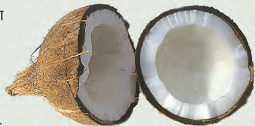
चित्र 5.1 (ख)

इस अध्याय में हम यह देखेंगे कि उपमहाद्वीप में आए यात्रियों द्वारा दिए गए सामाजिक जीवन के विवरणों के अध्ययन से किस प्रकार हम अपने अतीत के विषय में ज्ञान बढ़ा सकते हैं। इसके लिए हम तीन व्यक्तियों के वृत्तांतों पर ध्यान देंगे: अल-बिरूनी, जो ग्यारहवीं शताब्दी में उज्बेकिस्तान आया था, इब्न बतूता (चौदहवीं शताब्दी), मोरक्को से तथा फ्रांसीसी यात्री फ्रांस्वा बर्नियर (सत्रहवीं शताब्दी)।