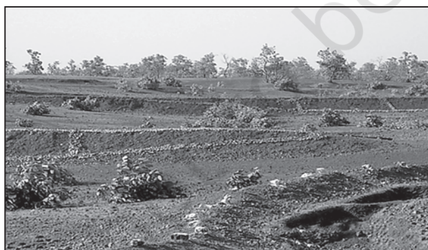
चित्र 9.4 : साझी संपदा संसाधन पर वृक्षारोपण

इस अनुभव का एक रोचक पक्ष यह है कि समुदाय इस चरागाह प्रबंधन प्रक्रिया की शुरुआत करते कि इससे पहले ही पड़ोसी गाँव के एक निवासी ने उस पर अतिक्रमण कर लिया। गाँव वालों ने तहसीलदार को बुलाया और साझी ज़मीन पर अपने अधिकारों को सुनिश्चित कराया। इस अनुवर्ती संघर्ष को गाँववालों द्वारा सुलझाया गया जिसके लिए उन्होंने साझी चरागाह भूमि पर अतिक्रमण करने वाले दोषी को अपने प्रयोक्ता समूह का सदस्य बनाकर उसे साझी चरागाह भूमि की हरियाली से लाभांश देना आरंभ किया। (साझी संपदा संसाधन के बारे में 'भूमि-संसाधन एवं कृषि' वाले अध्याय को देखें।)