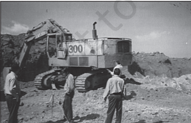
चित्र 9.2 : पंचपटमलाई बॉक्साइट खान में ध्वनि प्रदूषण की जाँच

ध्वनि प्रदूषण के प्रमुख स्रोत विविध उद्योग, मशीनीकृत निर्माण तथा तोड़-फोड़ कार्य, तीव्रचालित मोटर-वाहन और वायुयान इत्यादि हैं। इनमें सायरन, लाउडस्पीकर, फेरी वाले तथा सामुदायिक गतिविधियों से जुड़े विभिन्न उत्सव संबंधी कार्यों से होने वाली आवधिक किंतु प्रदूषण करने वाले शोर को भी जोड़ा जा सकता है। सुस्थिर शोर के स्तर को डेसीबल के संदर्भ में ध्वनि स्तर के द्वारा मापा जाता है।