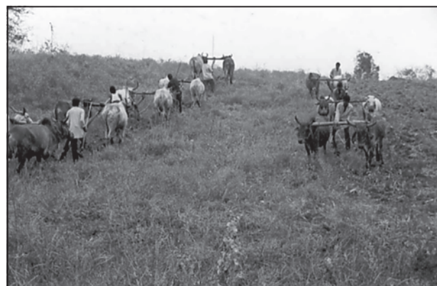
चित्र 9.5 : झुबुआ में साझी संपदा संसाधन की भूमि समतलीकरण में सामुदायिक प्रतिभागिता (ए एस ए 2004)

स्रोत : मूल्यांकन रिपोर्ट, राजीव गांधी मिशन फॉर जलसंभरण प्रबंधन, मध्य प्रदेश, 2002