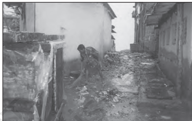
चित्र 9.3 : माहिम मुंबई में नगरीय अपशिष्ट का एक दृश्य