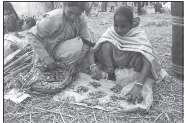
चित्र संख्या 8.1 : जॉन बीलमेला में वस्तुओं का आदान-प्रदान करती दो महिलाएँ

आदिम समाज में व्यापार का आरंभिक स्वरूप 'विनिमय व्यवस्था' था, जिसमें वस्तुओं का प्रत्यक्ष आदान-प्रदान होता था अर्थात् वस्तु के बदले में रुपये के स्थान पर वस्तु दी जाती थी। इस व्यवस्था में यदि आप एक कुम्हार होते और आपको एक नलसाज की आवश्यकता होती, तो आपको एक ऐसा नलसाज ढूँढ़ना पड़ता, जिसे आप द्वारा बनाए हुए बर्तनों की आवश्यकता होती और आप उसकी नलसाज की सेवाओं के बदले अपने बर्तन देकर आदान-प्रदान कर सकते थे।