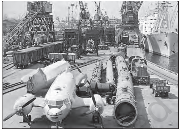
चित्र 8.5 : लेनिनग्राद का वाणिज्यिक पत्तन