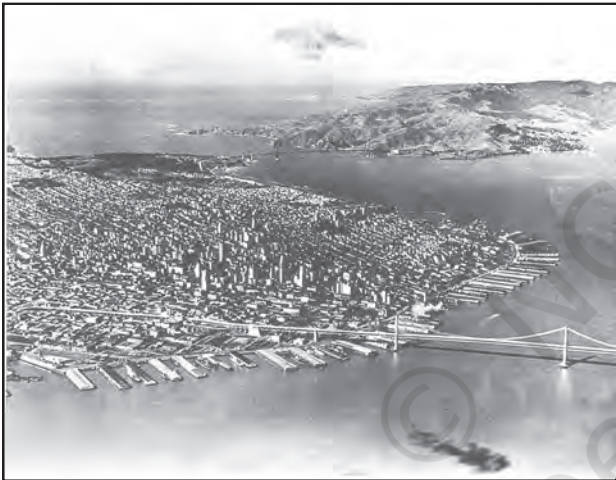
चित्र 8.4 : सैन फ्रांसिस्को, विश्व का सबसे बड़ा स्थलरुद्ध पत्तन

पत्तन जहाज़ के लिए गोदी, लादने, उतारने तथा भंडारण हेतु सुविधाएँ प्रदान करते हैं। इन सुविधाओं को प्रदान करने के उद्देश्य से पत्तन के प्राधिकारी नौगम्य द्वारों का रख-रखाव, रस्सों व बजरो (छोटी अतिरिक्त नौकाएँ) की व्यवस्था करने और श्रम एवं प्रबंधकीय सेवाओं को उपलब्ध कराने की व्यवस्था करते हैं। एक पत्तन के महत्त्व को नौभार के आकार और निपटान किए गए जहाज़ों की संख्या द्वारा निश्चित किया जाता है। एक पत्तन द्वारा निपटाया नौभार, उसके पृष्ठ प्रदेश के विकास के स्तर का सूचक है।