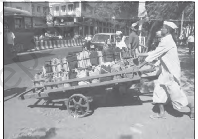
चित्र 6.4 : मुंबई में डब्बावाला सेवा

दैनिक जीवन में काम को सुविधाजनक बनाने के लिए लोगों को व्यक्तिगत सेवाएँ उपलब्ध कराई जाती हैं। कामगार रोजगार की तलाश में ग्रामीण क्षेत्रों से प्रवास करते हैं और अकुशल होते हैं। वे मोची, गृहपाल, खानसामा और माली जैसी घरेलू सेवाओं के लिए नियुक्त किए जाते हैं और इन्हें कम भुगतान किया जाता है। कर्मियों का यह वर्ग असंगठित है। ऐसा एक उदाहरण मुंबई की डब्बावाला सेवा है जो पूरे नगर में लगभग 1,75,000 उपभोक्ताओं को उपलब्ध कराई जाती है।