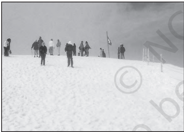
चित्र 6.5 : स्विट्जरलैंड में बर्फ से ढकी पर्वत चोटी पर स्कींग करते पर्यटक

पर्यटन एक यात्रा है जो व्यापार की बजाय प्रमोद के उद्देश्यों के लिए की जाती है। कुल पंजीकृत रोजगारों तथा कुल राजस्व (सकल घरेलू उत्पाद का 40 प्रतिशत) की दृष्टि से यह विश्व का अकेला सबसे बड़ा (25 करोड़) तृतीयक क्रियाकलाप बन गया है। इनके अतिरिक्त पर्यटकों के आवास, भोजन, परिवहन, मनोरंजन तथा विशेष दुकानों जैसी सेवा उपलब्ध कराने के लिए अनेक स्थानीय व्यक्तियों को नियुक्त किया जाता है। पर्यटन अवसंरचना उद्योगों, फुटकर व्यापार तथा शिल्प उद्योगों (स्मारिका) को पोषित करता है। कुछ प्रदेशों में पर्यटन ऋतुनिष्ठ होता है क्योंकि अवकाश की अवधि अनुकूल मौसमी दशाओं पर निर्भर करती है, किंतु कई प्रदेश वर्षभर पर्यटकों को आकर्षित करते हैं।