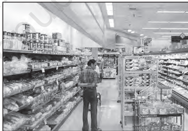
चित्र 6.3 : अमेरिका में डिब्बाबंद आहार बाजार

नगरीय बाजार केंद्रों में और अधिक विशिष्टीकृत नगरीय सेवाएँ मिलती हैं। इनमें न केवल साधारण वस्तुएँ और सेवाएँ बल्कि लोगों द्वारा वांछित अनेक विशिष्ट वस्तुएँ व सेवाएँ भी उपलब्ध होती हैं। नगरीय केंद्र, इसलिए विनिर्मित पदार्थों के साथ-साथ विशिष्टीकृत बाजार भी प्रस्तुत करते हैं जैसे श्रम बाजार, आवासन, अर्ध-निर्मित एवं निर्मित उत्पादों का बाजार। इनमें शैक्षिक संस्थाओं और व्यावसायिकों की सेवाएँ जैसे— अध्यापक, वकील, परामर्शदाता, चिकित्सक, दाँतों का डॉक्टर और पशु चिकित्सक आदि उपलब्ध होते हैं।