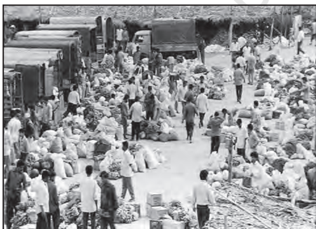
चित्र 6.2 : सभित्तियों का थोक बाजार

ग्रामीण विपणन केंद्र निकटवर्ती बस्तियों का पोषण करते हैं। ये अर्ध-नगरीय केंद्र होते हैं। ये अत्यंत अल्पवर्धित प्रकार के व्यापारिक केंद्रों के रूप में सेवा करते हैं। यहाँ व्यक्तिगत और व्यावसायिक सेवाएँ सुविकसित नहीं होतीं। ये स्थानीय संग्रहण और वितरण केंद्र होते हैं। इनमें से अधिकांश केंद्रों में मंडियाँ (थोक बाजार) और फुटकर व्यापार क्षेत्र भी होते हैं। ये स्वयं में नगरीय केंद्र नहीं हैं किंतु ग्रामीण लोगों की अधिक माँग वाली वस्तुओं और सेवाओं को उपलब्ध कराने वाले महत्वपूर्ण केंद्र हैं।