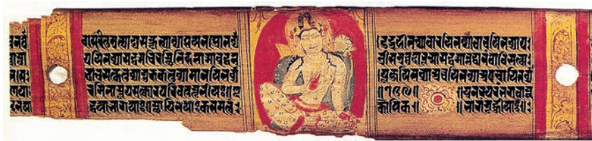
लोकेश्वर, अष्टसहस्रिका प्रज्ञापारमिता, पाल, 1050, राष्ट्रीय संग्रहालय, नई दिल्ली

महाविहार (विश्वविद्यालयों) में आए और पालकालीन बौद्ध कला के कांस्य और सचित्र पांडुलिपियों के नमूने अपने साथ वापस ले गए। इस प्रथा ने पाल कला का विभिन्न स्थानों उदाहरणस्वरूप नेपाल, तिब्बत, बर्मा, श्रीलंका और जावा देशों में सुगमता से प्रसार किया।