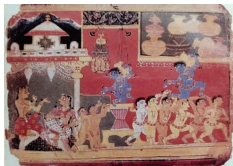
मीठाराम, भागवत पुराण, 1550

उत्तर, पूर्व और पश्चिम के कई क्षेत्रों पर बारहवीं शताब्दी के अंत में मध्य एशिया के सल्तनत राजवंशों के शासन में आने के बाद, स्पष्टतः