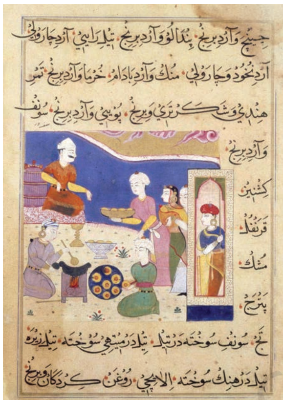
निमतनामा, मांडू, 1550, ब्रिटिश लाइब्रेरी, लंदन

फ़ारसी, तुर्क और अफ़ग़ान के प्रभाव को चित्रों में देखा जा सकता है। विशेष रूप से उन क्षेत्रों में, जहाँ सुल्तानों द्वारा चित्रों का निर्माण करवाया गया, जैसे कि मालवा, गुजरात, जौनपुर और अन्य सल्तनत शासित क्षेत्र। इन राजदरबारों में कुछ मध्य एशियाई कलाकारों के साथ स्थानीय कलाकारों द्वारा चित्रों के निर्माण से, स्वदेशी शैलियों और फ़ारसी शैलियों के परस्पर मिश्रण से एक नई शैली का उदय हुआ, जिसे सल्तनत चित्रकला के रूप में जाना जाता है।