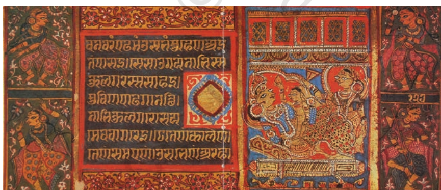
महावीर का जन्म, कल्पसूत्र, पंद्रहवीं शताब्दी, जैन भंडार, राजस्थान

शास्त्र दान की परंपरा के कारण जैन शैली के विकास को और प्रोत्साहन मिला। जैन समुदाय में, सचित्र पांडुलिपि को मठ के पुस्तकालय, जिसे भंडार कहा जाता था, में दान करना एक परोपकार, सदाचार व धार्मिक कृत्य माना जाता था।