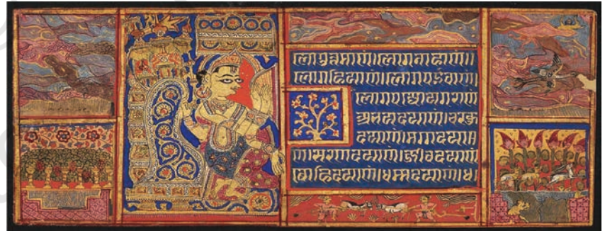
इंद्र द्वारा देवसानो पाड़ो की स्तुति कल्पसूत्र, गुजरात, लगभग 1475, संग्रह, बोस्टन

जैन चित्रकला में विशेष प्रकार के संयोजन (योजनाबद्ध) और सरलीकृत भाषा का विकास हुआ। अधिकांश चित्रों में विभिन्न घटनाओं को समायोजित करने के लिए चित्र पटल को वर्गों में विभाजित किया गया। चित्रों में चमकीले रंग और कपड़े के अलंकरण का प्रभाव स्पष्ट रूप से देखा जा सकता है। संयोजन में पतली, लहरदार रेखाओं का प्रबल प्रभाव है और चेहरे को तीन-आयामों में दर्शाने के लिए एक अतिरिक्त आँख का उपयोग देखने को मिलता है। चित्रों में वास्तुशिल्प में सल्लनत कालीन गुंबद और नुकीले मेहराब का चित्रण, गुजरात, मांडू, जौनपुर और पाटन के क्षेत्रों में सुल्तानों की राजनीतिक उपस्थिति को दर्शाते हैं, जहाँ ये चित्र बने। कपड़े के चंदवा या शामियानों और पर्दों, मेज़, कुर्सी आदि वेशभूषा, उपयोगी वस्तुओं इत्यादि पर स्वदेशी और स्थानीय जीवन शैली का प्रभाव स्पष्ट रूप से दिखता है। भू-दृश्य या प्रकृति-दृश्य के स्वरूपों का चित्रण विस्तृत रूप में न होकर मात्र सांकेतिक या साधारणतः किया गया है। लगभग 1350–1450 के सौ वर्षों की अवधि को जैन चित्रकला का सबसे रचनात्मक काल माना जाता है। चित्रों की संरचना में एक महत्वपूर्ण परिवर्तन का अनुभव किया जा सकता है, जहाँ प्रबल रूप से देवी-देवताओं के साथ आकर्षक रूप से चित्रित, भू-दृश्य या प्रकृति-दृश्य, नृत्य करती मानव आकृतियाँ और वाद्ययंत्र बजाते संगीतकारों का चित्रण मुख्य चित्र के हाशिये पर किया गया है।