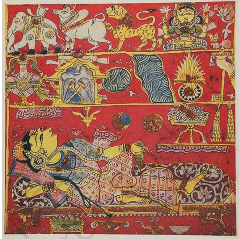
त्रिशला के 14 स्वप्न, कल्पसूत्र, पश्चिमी भारत

महानिर्वाण—तीर्थकरों के जीवन से संबंधित अन्य घटनाओं के अधिकतम भाग कल्पसूत्र में सम्मिलित हैं।