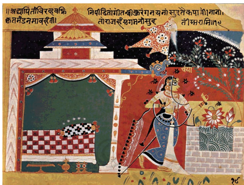
चौरपंचाशिका, गुजरात, पंद्रहवीं शताब्दी, एन. सी. मेहता संग्रह, अहमदाबाद, गुजरात

इसी समय में, हिंदू और जैन विषयों के अनेक चित्रों को चित्रित किया गया, जैसे— महापुराण, चौरपंचाशिका, महाभारत का अरण्यक पर्व, भागवत पुराण, गीत गोविंद और अन्य कुछ चित्रांकन, जो इस स्वदेशी शैली का प्रतिनिधित्व करते हैं। इस काल और शैली को साधारण रूप से पूर्व-मुगल या पूर्व-राजस्थानी शैली के रूप में भी जाना जाता है, जिसे स्वदेशी शैली भी कहा जा सकता है।