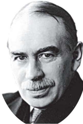
जॉन मेनार्ड कीन्स

ब्रिटिश अर्थशास्त्री जॉन मेनार्ड कीन्स का जन्म 1883 में हुआ था। उनकी शिक्षा किंग्स कॉलेज, कैंब्रिज यूनाइटेड किंगडम में हुई थी और बाद में 'विशेषज्ञ' के रूप में नियुक्त हुए। प्रथम विश्व युद्ध के वर्षों में वे तीक्ष्ण विद्वता के अलावा सक्रिय अंतर्राष्ट्रीय राजनायिक के रूप में भी जुड़े रहे। अपनी पुस्तक 'इकोनॉमिक कंसीक्वेसेज ऑफ द पीस' (1919) में युद्ध की शांति समझौते के भंग होने की भविष्याणी इन्होंने कर दी थी। उनकी पुस्तक 'जनरल थ्योरी ऑफ इंप्लायमेंट, इंटरैस्ट एंड मनी' (1936) बीसवीं सदी की अर्थशास्त्र की महत्वपूर्ण पुस्तकों में से एक है। कीन्स विदेशी मुद्रा के समझदार सट्टेबाज थे।