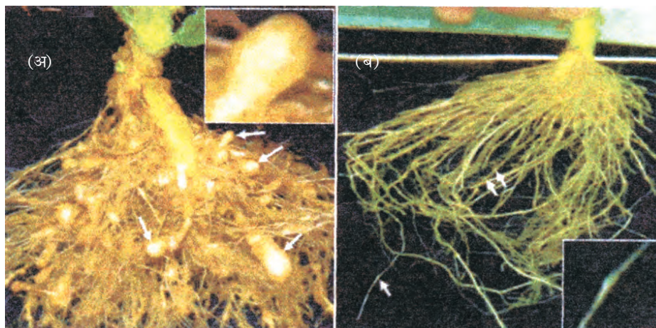
चित्र 10.2 पोषी पादप जनित ds आरएनए द्वारा सूत्रकृमि ग्रसन के विरुद्ध सुरक्षा में वृद्धि (अ) प्रारूपी नियंत्रित पादप मूलों (ब) पाँच दिनों तक जानबूझकर सूत्रकृमि द्वारा पारजीवी पादप की जड़ों का संक्रमण तथा साथ ही नवीन विधि द्वारा सुरक्षा

परपोषी कोशिकाओं में अर्थ (सैस) व प्रति-अर्थ (एंटीसैस) आरएनए का निर्माण करता है। ये दोनों आरएनए एक दूसरे के पूरक होते हैं जो द्विसूत्रीय आरएनए का निर्माण करते हैं; जिससे आरएनए अंतरक्षेप प्रारंभ होता है और इसी कारण से सूत्रकृमि के विशिष्ट दूत आरएनए निष्क्रिय हो जाते हैं। इसके फलस्वरूप पारजीवी परपोषी में विशिष्ट अंतरक्षेपी आरएनए की उपस्थिति से परजीवी जीवित नहीं रह पाता है। इस प्रकार पारजीवी पौधे अपनी सुरक्षा परजीवी से करते हैं (चित्र 10.2)।