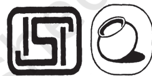
चित्र 12.5 — ईको मार्क