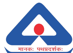
चित्र 12.4 — हाल मार्क

गैर-सरकारी संगठन (एन.जी.ओ.)/स्वैच्छिक उपभोक्ता संगठन अपने गैर-पक्षीय हितों के कारण उपभोक्ता शिक्षा और संरक्षण में महत्वपूर्ण भूमिका निभाते हैं। वे अपनी पत्रिकाओं, पुस्तिकाओं, समाचार-पत्रों, मार्गदर्शिकाओं, दृश्य-श्रव्य सामग्रियों और अनुसंधान रिपोर्ट आदि के माध्यम से जानकारी प्रसारित करते हैं। अनेक उपभोक्ता संगठन उत्पादों के तुलनात्मक परीक्षण, हानिकारक और असुरक्षित उत्पादों के बारे में उपभोक्ता जागरूकता फैलाने, उत्पादों के बारे में बताने, उपभोक्ताओं के लिए नए वैधानिक प्रावधानों के बारे में जानकारी का प्रचार करने, कानूनी सलाह और पैरवी करने, उपभोक्ताओं की शिकायतों से निपटने और सतर्कता समूहों के रूप में कार्य करने में संलग्न हैं। ये जनसभाएँ आयोजित करते हैं और इनके पुस्तकालय और दस्तावेज केंद्र होते हैं और ये उपभोक्ता जागरूकता, सशक्तिकरण और उपभोक्ता आंदोलन में प्रमुख भूमिका निभाते हैं। भारत में, हमारे यहाँ अनेक उपभोक्ता संगठन हैं जो उपभोक्ता के हित में पत्र-पत्रिकाओं का प्रकाशन करते हैं। 'वॉयस' जोकि, दिल्ली का एक उपभोक्ता संगठन है 'कंज्यूमर वॉयस' नामक पत्रिका