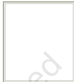
दो टबों वाली मशीन