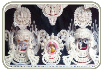
उड़ीसा की शोला शिल्प

सजावट के उद्देश्य से बनाए जाते थे। ये व्यवसाय और कई अन्य, सामाजिक-आर्थिक संस्कृति के आधार को प्रतिबिंबित करते हैं। परंतु आधुनिक अर्थव्यवस्था ने इस प्रकार के शिल्पों की सामग्री को वैश्विक बाजार तक पहुंचाया है जिससे देश को पर्याप्त विदेशी मुद्रा प्राप्त हो रही है।