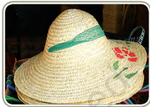
आसाम का बाँस शिल्प

ये सब एक ज़बरदस्त चुनौती सामने लाते हैं और इस देसी ज्ञान, जानकारी तथा कौशलों, जो तेज़ी से अपना आधार खो रहे हैं, के पुनरुद्धार और उसे बनाए रखने की आवश्यकता को इंगित करते हैं। कुछ क्षेत्र जहाँ अंतःक्षेप की आवश्यकता है — नए डिज़ाइन बनाना, संरक्षण और परिष्करण नीतियाँ, पर्यावरण हितैषी कच्चे माल का उपयोग, पैकेजिंग, प्रशिक्षण सुविधाओं की व्यवस्था का संरक्षण और बौद्धिक संपदा अधिकारी (आई.पी.आर.) का रक्षण। आधुनिक युवा और समुदायों के लिए आवश्यक है कि वे व्यक्तिगत रूप से जीविका अवसरों के व्यापक क्षेत्र और संभावनाओं के प्रति जागरूक रहें। इसके अतिरिक्त, ऐसे प्रयास और पहल ग्रामीण जनता की आय-उत्पादन की संभावनाएँ बढ़ाने में बहुत कारगर सिद्ध होंगे। यह नोट करना महत्वपूर्ण होगा कि भारत सरकार इस दिशा में सामूहिक प्रयास कर रही है। समय की माँग और चुनौती के रूप में जिसका भारतीय समाज सामना कर रहा है, वह है — लोकतांत्रिक वातावरण में पदानुक्रम अथवा जाति-आधारित कार्य-विभाजन के बिना विविधता को बनाए रखना।