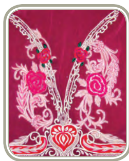
भारत की कशीदाकारी और वस्त्र

भारत में चित्रण कलाओं की विविधता है, जो चार हजार वर्षों से प्रचलन में हैं। ऐतिहासिक दृष्टि से, कलाकारों और शिल्पकारों को दो मुख्य वर्गों के संरक्षकों से सहायता मिलती थी- बड़े हिंदू मंदिर और विभिन्न राज्यों के राजसी शासक। धार्मिक उपासना के संदर्भ में मुख्य चित्रण कलाओं का उदय हुआ। भारत के विभिन्न भागों में वास्तुकला की भिन्न क्षेत्रीय शैलियाँ देखने को मिलती हैं जो विभिन्न धर्मों को प्रतिबिंबित करती हैं, जैसे— इस्लाम, सिक्ख धर्म, जैन धर्म, ईसाई धर्म और हिंदू धर्म। ये सभी धर्म संपूर्ण देश में विशिष्ट रूप से साथ-साथ अस्तित्व में थे। अतः विभिन्न उपासना स्थलों और मकबरे युक्त महलों, समाधि स्थलों, इत्यादि के पत्थरों पर कुशलता से गढ़ी हुई, काँसे या चाँदी में ढाली हुई या टेराकोटा या लकड़ी की बनी हुई अथवा रंगों द्वारा चित्रित कई प्रकार की प्रतिमाएँ देखने को मिलती हैं। इनमें से अधिकांश भारत की विशाल धरोहर के रूप में परिरक्षित की गई हैं। आधुनिक परिदृश्य में, इन कलाओं को सरकार और कुछ गैर-सरकारी संस्थाओं द्वारा संरक्षण और प्रोत्साहन मिला है। इससे उद्यमिता के साथ-साथ रोजगार के अवसर उपलब्ध हुए हैं।