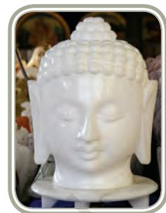
पत्थर की मूर्तिकला

परंपरागत रूप से, शिल्प निर्माण/उत्पादन करने की विधियाँ, तकनीक और कौशल परिवार के सदस्यों को पीढ़ी दर पीढ़ी सौंप दिए जाते थे। इस देशी ज्ञान का हस्तांतरण और उसका प्रशिक्षण मुख्य रूप से गृह-आधारित प्रशिक्षण और जानकारी थी और इन ज्ञान के सूक्ष्म तत्वों को उस रोजगार से जुड़े समूहों में कड़ी सुरक्षा के साथ गोपनीय रखा जाता था। भारत में धर्म, जाति और व्यवसाय की गति घनिष्ठ रूप से एक दूसरे से जुड़े हुए हैं और साथ ही देश के सामाजिक ढाँचे में जनसमूहों की सोपानिक व्यवस्था से भी संबद्ध हैं। ऐसे सैंकड़ों परंपरागत रोजगार हो सकते हैं, जैसे – शिकार करना और पक्षियों और जानवरों को जाल में फँसाना, विदेशी सामान इकट्ठा करना और बेचना, माला बनाना, नमक बनाना, नीरा या ताड़ का रस निकालना, खनन कार्य, ईंट और टाइल बनाना, पीढ़ी दर पीढ़ी चलने वाले अन्य परंपरागत रोजगारों में सम्मिलित हैं - पुजारी, सफाई करने वाले, चमड़े का काम करने वाले इत्यादि।