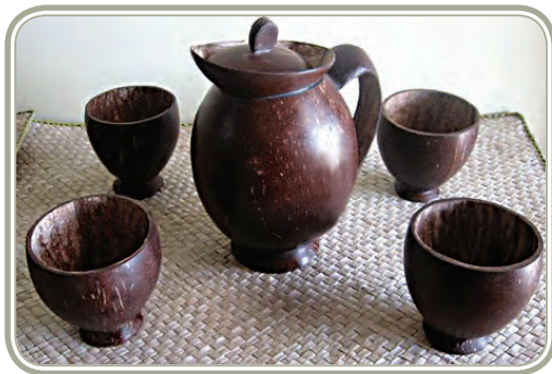
केरल का नारियल शिल्प

जा रहा है। निरक्षरता, सामान्य सामाजिक-आर्थिक पिछड़ापन, भूमि सुधार लागू करने में धीमी प्रगति और पर्याप्त अथवा अकुशल वित्तीय और विपणन सेवाएँ मुख्य बाधाएँ हैं जो प्रगति को बीच में लटका रही हैं। वन-आधारित संसाधनों का कम होना और सामान्य पर्यावरणीय निम्नीकरण, भारत के संदर्भ में, सामने आने वाली विभिन्न समस्याओं के लिए उत्तरदायी है।