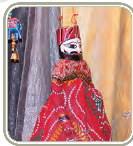
महाराष्ट्र की वाली चित्रकला कठपुतली शिल्प