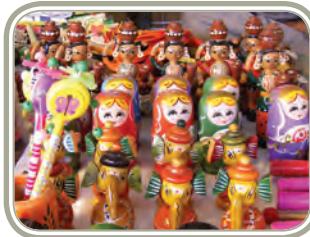
कर्नाटक की चन्नपटन की मूर्तियाँ