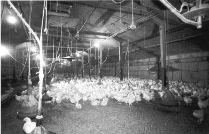
شکل 6.4 ہندوستان کے کل مویشیوں کا ایک بڑا حصہ مرغیوں پر مشتمل ہے۔

باغبانی: متنوع آب و ہوا اور مٹی کی خصوصیت سے سرشار ہونے کی وجہ سے ہندوستان میں متنوع باغبانی فصلیں جیسے پھل، سبزیاں، جڑ والے پودے (آلو وغیرہ)، ادویاتی بوٹیاں اور خوشبودار پودے، مسالے اور روئی و تمباکو وغیرہ کے پودوں کو اگایا جاتا ہے۔ یہ فصلیں روزگار پر مرکوز ہونے کے علاوہ غذا اور تغذیہ فراہم کرنے میں بھی نہایت اہم کرار نبھاتی ہیں۔ باغبانی سیکٹر سے زراعت کی مجموعی پیداوار کی تقریباً ایک تہائی اور ہندوستان کی مجموعی گھریلو پیداوار کل پیچھے فی صد رقم حاصل ہوتی ہے۔ یہ سیکٹر ایک قابل برقراری ذریعہ معاش کے طور پر ابھرا ہے۔ ہندوستان مختلف قسم کے پھل جیسے آم، کیلا، ناریل، کاجو اور متعدد مسالے پیدا کرنے میں دنیا میں اولین مقام پر آگیا ہے