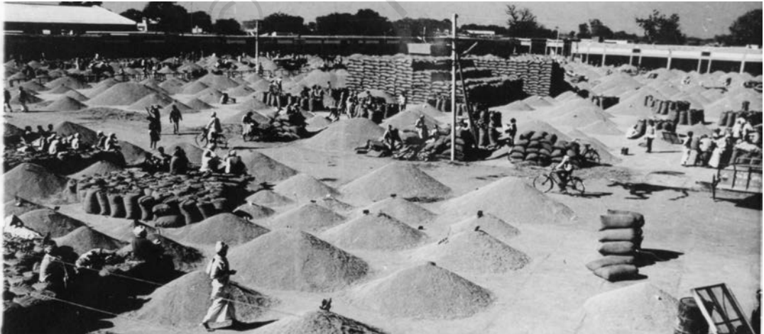
شکل 6.1 منضبط کھلے میدانوں کے بازار کسانوں اور صارفین دونوں کے لئے فائدہ مند ہوتے ہیں۔

اس طرح دیہی بینک کاری سیکٹر کی توسیع اور فروغ اصلاحات کے بعد پس پشت ہو کر رہ گیا ہے۔ اس طرح کی صورت حال کو بہتر بنانے میں بینکوں کو محض قرض دینے والے کے بجائے قرض لینے والوں کے ساتھ بینک کاری رشتے قائم کرنے کے لیے اپنے انداز نظر میں تبدیلی لانے کی ضرورت ہے۔ کسانوں میں کفایت شعاری اور مالی وسائل سے موثر استفادہ حاصل کرنے کی عادت کو فروغ دیا جانا چاہیے۔