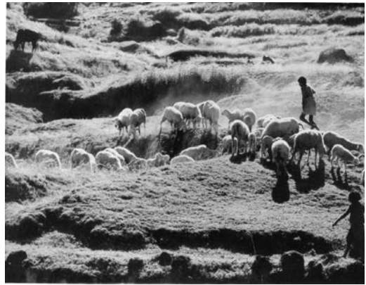
شکل 6.3: بھینٹ پالنے - دیہی علاقوں میں آمدنی بڑھانے والی ایک اہم سرگرمی۔

سیکٹر اکیلے ہی 70 ملین (سات کروڑ) چھوٹے اور حاشیائی کسانوں بشمول بے زمین مزدوروں کو متبادل ذریعہ معاش فراہم کرتا ہے۔ عورتوں کی خاصی تعداد مویشی سیکٹر سے اپنا روزگار حاصل کرتی ہیں۔ چارٹ 6.1 میں ہندوستان میں مویشیوں کی تقسیم دکھائی گئی ہے۔ مرغی پالنے کا حصہ سب سے زیادہ یعنی 55 فی صد ہے اس کے بعد دیگر ہیں۔ دیگر جانوروں جن میں اونٹ، گدھے