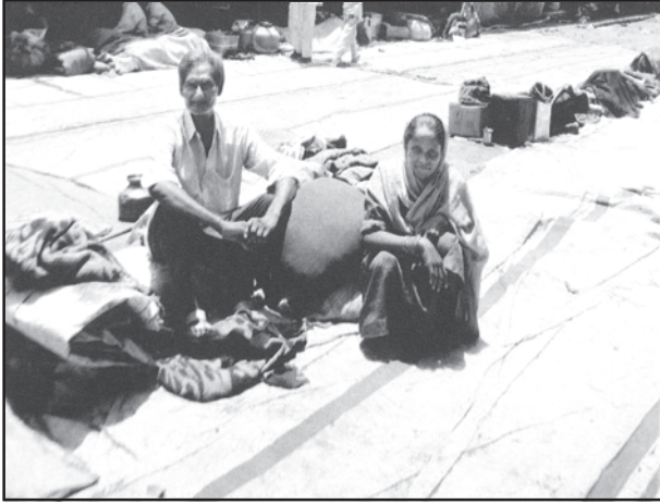
एक गृहविहीन दंपति

वर्ष 2016 से आरंभ हुई प्रधानमंत्री आवास योजना सरकार के ग्रामीण विकास मंत्रालय (एम.ओ.आर.डी.) द्वारा संचालित एक विशाल योजना है, जो आवासहीन परिवारों और जीर्ण-शीर्ण कच्चे मकानों में रहने वालों को पक्के मकानों के निर्माण के लिए वित्तीय और श्रमिक सहायता प्रदान कराएगी। क्या आप ऐसे अन्य मुद्दे बता सकते हैं जो व्यक्तिगत समस्याओं और जनहित के मुद्दों में संबंध दर्शाते हैं?