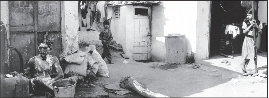
आस-पड़ोस के कामकाजी वर्ग से गंदी बस्तियों तक