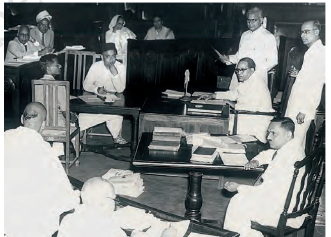
संविधान सभा में चर्चा की अध्यक्षता करते हुए डॉ. बी.आर. अंबेडकर