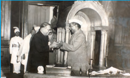
संविधान सभा के अध्यक्ष डॉ. राजेन्द्र प्रसाद और प्रारूप समिति के सभापति डॉ. बी.आर. अंबेडकर एक दूसरे का अभिवादन करते हुए

लेकिन कोई भी संविधान केवल अपनी संविधान सभा के बूते नहीं बनता। भारत की संविधान सभा इतनी विविधतापूर्ण थी कि वह सामान्य ढंग से काम ही नहीं कर सकती थी यदि उसके पीछे उन सिद्धांतों पर आम सहमति न होती जिन्हें संविधान में रखा जाना था। इन सिद्धांतों पर