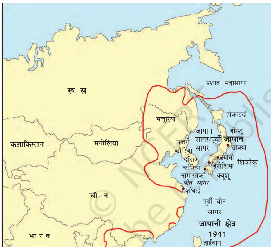
मानचित्र 1: पूर्व एशिया।

चीन और जापान के भौतिक भूगोल में काफी अंतर है। चीन विशालकाय महाद्वीपीय देश है जिसमें कई तरह की जलवायु वाले क्षेत्र हैं: मुख्य क्षेत्र में 3 प्रमुख नदियाँ हैं: पीली नदी (हुआंग हे), यांग्त्सी नदी (छांग जिआंग - दुनिया की तीसरी सबसे लंबी नदी), और पर्ल नदी। देश का बहुत सा हिस्सा पहाड़ी है।