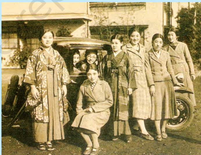
औरतों का कार क्लब

मोगा : 'आधुनिक लड़की' के लिए संक्षिप्त शब्द। यह 20वीं शताब्दी में लिंग बराबरी, विश्वजनीन (कॉस्मोपॉलिटन) संस्कृति और विकसित अर्थव्यवस्था के विचारों के एक साथ आने का सूचक है। नए मध्यम वर्ग परिवारों ने आवागमन और मनोरंजन के नए तरीकों का लुत्फ उठाया। शहरों में बिजली की ट्रामों के साथ परिवहन बेहतर हुआ। 1878 से जनता के लिए बाग़ बनाये गए और बड़ी दुकानें डिपार्टमेंट स्टोर बनने लगीं। टोक्यो में गिन्ज़ा गिनबुरा के लिए एक फैशनेबुल इलाक़ा बन गया। गिनबुरा शब्द गिन्ज़ा और बुरबुरा मिला कर बनाया गया है। बुरबुरा का अर्थ है 'बिना किसी लक्ष्य के घूमना'। 1925 में पहला रेडियो-स्टेशन खुला। अभिनेत्री मात्सुई, सुमाको,