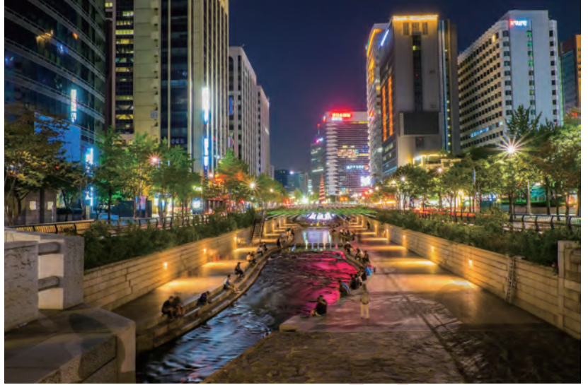
वर्तमान कालीन सियोल शहर

दिसंबर 1997 में, एक लंबे समय के बाद कोरिया में पहली बार शांतिपूर्ण हस्तांतरण के द्वारा विपक्षी पार्टी के नेता किम डे-जुंग सत्ता में आए। सत्ता में दूसरा शांतिपूर्ण हस्तांतरण 2008 में हुआ, जब रूढ़िवादी पार्टी के नेता ली माइंग-बाक, प्रगतिशील पार्टी रोह मु-ह्यून प्रशासन के बाद अध्यक्ष चुने गए। 2012 में, रूढ़िवादी पार्टी की नेता पार्क खन-हे पहली महिला राष्ट्रपति के रूप में चुनी गईं। उनके पिता, पार्क चुंग-ही की राजनीतिक विरासत के कारण उन्हें अपने कार्यकाल की शुरुआत में बहुत समर्थन प्राप्त हुआ, लेकिन अक्टूबर 2016 में जब यह बात उठी कि उनके स्थान पर उनके एक नजदीकी मित्र गुप्त रूप से सरकारी मामलों का प्रबंधन करते थे, तब राष्ट्रव्यापी विरोध एवं प्रदर्शनों के फलस्वरूप, मार्च 2017 में उन पर महाभियोग चला और उन्हें कार्यालय से हटा दिया गया। मई 2017 में, तीसरी बार शांतिपूर्ण हस्तांतरण के द्वारा, मून जे-इन ने राष्ट्रपति पद संभाला।