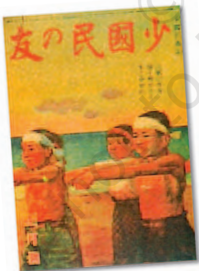
एक पत्रिका का आवरण पृष्ठ: नवयुवकों को देश हेतु लड़ने के लिए प्रेरित किया जा रहा है।

मेजी संविधान सीमित मताधिकार पर आधारित था और उसने डायट बनाई जिसके अधिकार सीमित थे (जापानियों ने संसद के लिए इस जर्मन शब्द का इस्तेमाल किया क्योंकि उनकी कानूनी सोच जर्मनी की सोच से प्रभावित थी)। शाही पुनःस्थापना करनेवाले नेता सत्ता में बने रहे और उन्होंने राजनीतिक पार्टियों का गठन किया। 1918 और 1931 के दरमियान जनमत से चुने गए प्रधानमंत्रियों ने मंत्रिपरिषद् बनाए। इसके बाद उन्होंने पार्टियों का भेद भुला कर बनाई गई राष्ट्रीय एकता मंत्रिपरिषदों के हाथों अपनी सत्ता खो दी। सम्राट सैन्यबलों का कमांडर था और 1890 से ये माना जाने लगा कि थलसेना और नौसेना का नियंत्रण स्वतंत्र है। 1899 में प्रधानमंत्री ने आदेश दिए कि केवल सेवारत जनरल और एडमिरल ही मंत्री बन सकते हैं। सेना को मज़बूत बनाने की मुहिम और जापान के उपनिवेश देशों की वृद्धि इस डर से जुड़े हुए थे कि जापान पश्चिमी शक्तियों की दया पर निर्भर है। इस डर को सैन्य-विस्तार के खिलाफ़ और सैन्यबलों को अधिक धन देने के लिए वसूले जानेवाले उच्चतर करों के खिलाफ़ उठनेवाली आवाज़ों को दबाने में इस्तेमाल किया गया।