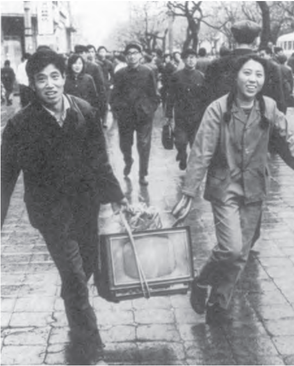
1978 के सुधारों के बाद चीनी लोग स्वच्छंद रूप से उपभोक्ता सामग्री खरीदने में समर्थ होने लगे।

आलोचना की। इसके लिए उसने पार्टी के अंदर से ही ऐसे दुर्व्यवहारों के उदाहरण पेश किए।