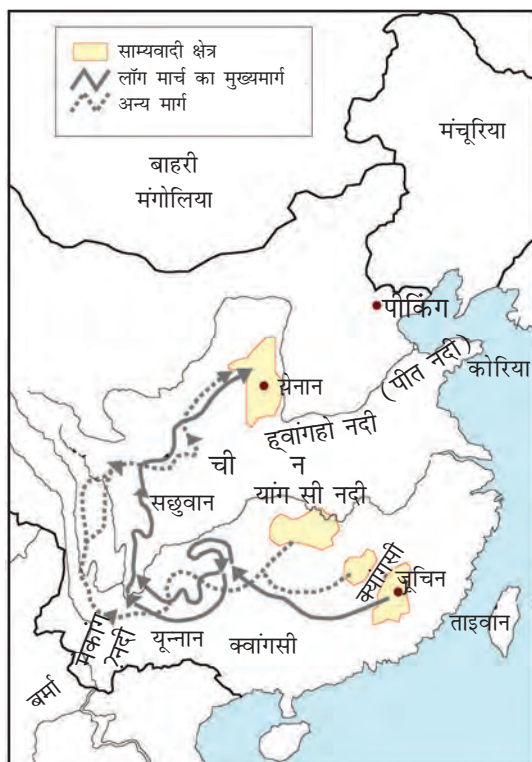
मानचित्र 2: लॉंग मार्च।

कैमरा चित्र - 1941 में लॉंग मार्च पर सैनिकों द्वारा बंजर भूमि को कृषियोग्य बनाते हुए।