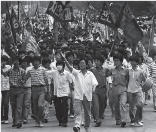
जून, 1987 के लोकतंत्र आंदोलन के दौरान प्रदर्शनकारी

नए संविधान के अनुसार, 1971 के बाद से पहला प्रत्यक्ष चुनाव दिसंबर 1987 में हुआ, लेकिन विपक्षी पार्टियों की एकजुटता में विफलता के कारण, चुन के सैन्य दल के एक साथी सैन्य नेता,