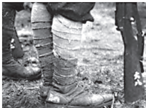
छात्र-सैनिकों के चित्र

एक किसान के बेटे तनाका शोज़ो (1841-1913) ने अपनी पढ़ाई खुद की और एक मुख्य राजनैतिक हस्ती के रूप में उभरे। 1880 के दशक में उन्होंने जनवादी हकों के आंदोलन में हिस्सा लिया। इस आंदोलन ने संवैधानिक सरकार की माँग की। वह पहली संसद-डायट-में सदस्य चुने गए। उनका मानना था कि औद्योगिक प्रगति के लिए आम लोगों की बलि नहीं दी जानी चाहिए। आशियो (Ashio) खान से वातारासे (Watarase) नदी में प्रदूषण फैल रहा था जिसके कारण 100 वर्ग मील की कृषिभूमि बर्बाद हो रही थी और 1000 परिवार प्रभावित हो रहे थे। आंदोलन के चलते कंपनी को प्रदूषण-नियंत्रण के तरीके अपनाने पड़े जिससे 1904 तक फ़सल सामान्य हो गई।