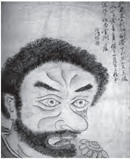
कोमोडोर पेरी जापानियों की निगाह से

इसके साथ ही नयी सरकार ने 'सम्राट-व्यवस्था' के पुनर्निर्माण का काम शुरू किया। (सम्राट व्यवस्था से जापानी विद्वानों का अभिप्राय है एक ऐसी व्यवस्था जिसमें सम्राट, नौकरशाही और सेना इकट्ठे सत्ता चलाते थे और नौकरशाही व सेना सम्राट के प्रति उत्तरदायी होते थे।) राजतांत्रिक व्यवस्था के नमूनों को समझने के लिए कुछ अधिकारियों को यूरोप भेजा गया। सम्राट को सीधे-सीधे सूर्य देवी का वंशज माना गया, लेकिन साथ ही उसे पश्चिमीकरण का नेता भी बनाया गया। सम्राट का जन्मदिन राष्ट्रीय छुट्टी का दिन बन गया, वह पश्चिमी अंदाज़ के सैनिक कपड़े