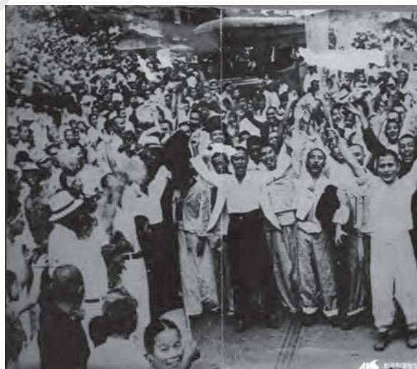
जापान से स्वतंत्रता का जश्न मनाते हुए कोरियाई

जापानी औपनिवेशिक शासन 35 साल के बाद अगस्त 1945 में द्वितीय विश्व युद्ध में जापान की हार के साथ समाप्त हुआ, हालाँकि यह कोरिया के भीतरी और बाहरी स्वतंत्रता कार्यकर्ताओं का लगातार प्रयास था, जो जापान की हार के बाद कोरिया की स्वतंत्रता सुनिश्चित कर पाया। मुक्ति के बाद कोरियाई उपद्वीप को अस्थायी रूप से 38वीं समानांतर रेखा से दो हिस्सों में विभाजित कर दिया गया। जिसमें उत्तरी क्षेत्र में सोवियत संघ और दक्षिण क्षेत्र में यू.एन. द्वारा संचालन किया गया, किंतु दोनों ही क्षेत्र जापानी सेना को भंग करने के लिए परिश्रम करते रहे, हालाँकि 1948 में उत्तर और दक्षिण में अलग-अलग सरकारें स्थापित होने के साथ, यह विभाजन स्थायी रूप से स्थापित हो गया।