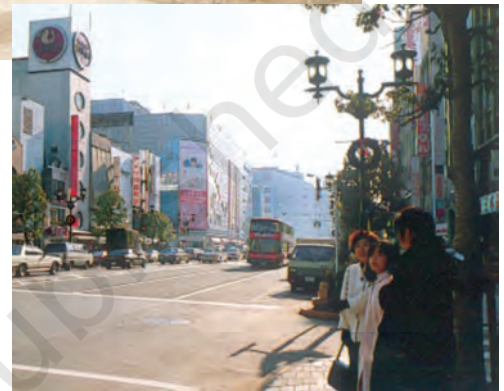
टोक्यो-द्वितीय विश्व युद्ध के पहले और बाद में।