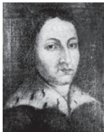
कोपरनिकस का आत्म-चित्र।

कोपरनिकस ने यह घोषणा की कि पृथ्वी समेत सारे ग्रह सूर्य के चारों ओर परिक्रमा करते हैं। कोपरनिकस एक निष्ठावान ईसाई थे और वह इस बात से भयभीत थे कि उनकी इस नयी खोज से परंपरावादी ईसाई धर्माधिकारियों में घोर-प्रतिक्रिया उत्पन्न हो सकती है। यही कारण था कि वह अपनी पाण्डुलिपि दि रिवल्यूशनिस (De revolutionibus-परिभ्रमण) को प्रकाशित नहीं कराना चाहते थे। जब वह अपनी मृत्यु-शैया पर पड़े थे तब उन्होंने यह पाण्डुलिपि अपने अनुयायी जोशिम रिटिकस (Joachim Rheticus) को सौंप दी। उनके