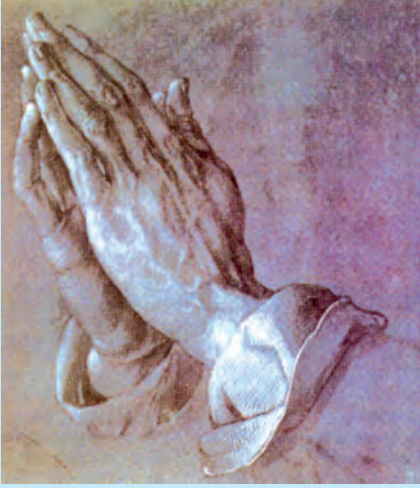
ड्यूरर का तूलिका चित्र 1508- “प्रार्थना रत हस्त”

उस काल के लोगों के विचार को आकार देने का साधन मानवतावादियों के लिए केवल औपचारिक शिक्षा ही नहीं थी। कला, वास्तुकला और ग्रंथों ने मानवतावादी विचारों को फैलाने में प्रभावी भूमिका निभाई।