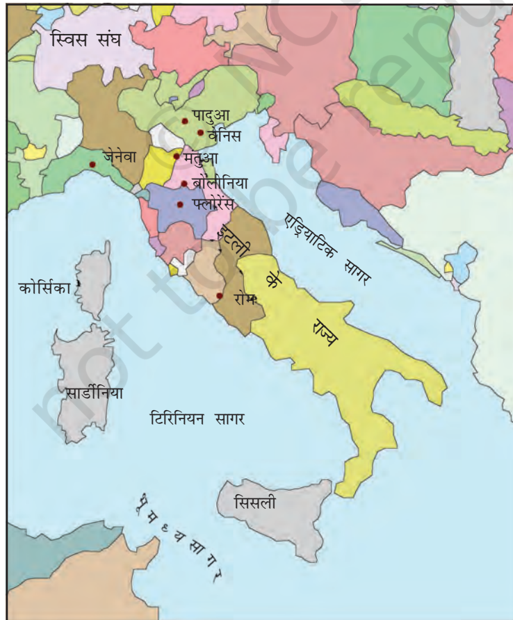
मानचित्र 1 : इटली के राज्य।

बाइजेंटाइन साम्राज्य और इस्लामी देशों के बीच व्यापार के बढ़ने से इटली के तटवर्ती बंदरगाह पुनर्जीवित हो गए। बारहवीं शताब्दी से जब मंगोलों ने चीन के साथ 'रेशम-मार्ग' (देखिए विषय 5) से व्यापार आरंभ किया तो इसके कारण पश्चिमी यूरोपीय देशों के व्यापार को बढ़ावा मिला। इसमें इटली के नगरों ने मुख्य भूमिका निभाई। अब वे अपने को एक शक्तिशाली साम्राज्य के अंग