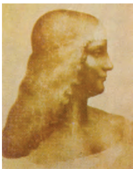
इसाबेला दि इस्ते।