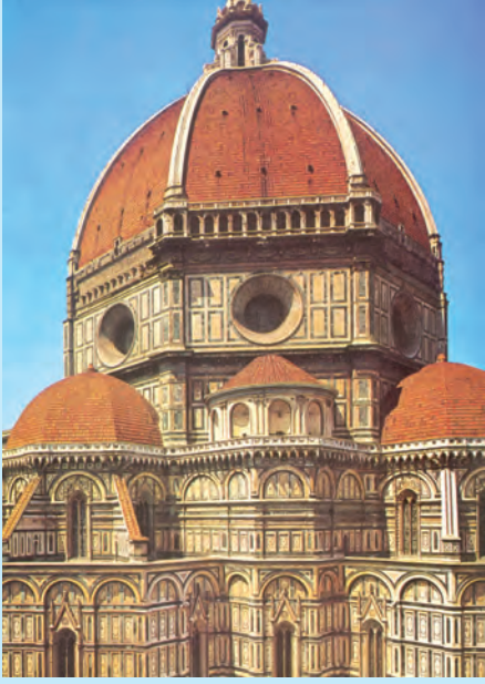
दी ड्यूमा (Duomo), फ्लोरेंस के कथीड्रल का गुम्बद, इसका डिजाइन ब्रूनलेशी ने बनाया।

(Philippo Brunelleschi, 1337-1446) जिन्होंने फ्लोरेंस के भव्य गुम्बद (Duomo) का परिरूप प्रस्तुत किया था, ने अपना पेशा एक मूर्तिकार के रूप में शुरू किया। इस काल में एक और अनोखा बदलाव आया। अब कलाकार की पहचान उसके नाम से होने लगी, न कि पहले की तरह उसके संघ या श्रेणी (गिल्ड) के नाम से।