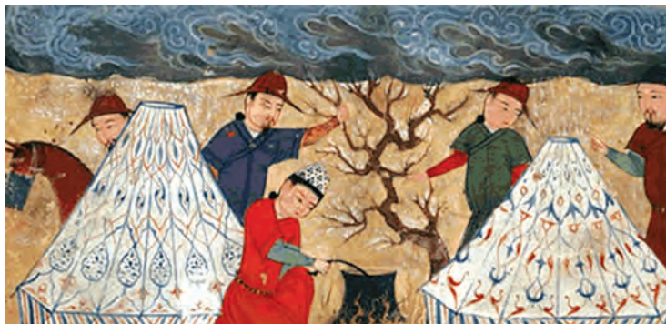
कुबलई खान और चाबी, शिविर में