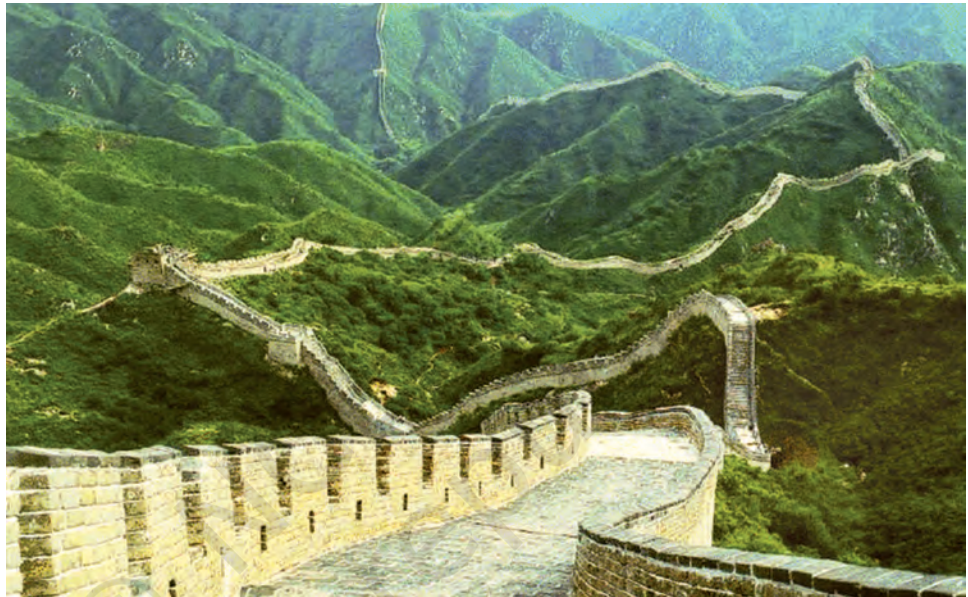
चीन की महान दीवार।

स्थायी समाज कमजोर पड़ने लगे। उन्होंने कृषि को अव्यवस्थित कर दिया और नगरों को लूटा। दूसरी ओर यायावर, लूटपाट कर संघर्ष क्षेत्र से दूर भाग जाते थे जिससे उन्हें बहुत कम हानि होती थी। अपने संपूर्ण इतिहास में चीन को इन यायावरों से विभिन्न शासन-कालों में बहुत अधिक क्षति पहुँची। यहाँ तक कि आठवीं शताब्दी ई.पू. से ही अपनी प्रजा की रक्षा के लिए चीनी शासकों ने किलेबंदी करना प्रारंभ कर दिया था। तीसरी शताब्दी ई.पू. से इन किलेबंदियों का एकीकरण सामान्य रक्षात्मक ढाँचे के रूप में किया गया जिसे आज 'चीन की महान दीवार' के रूप में जाना जाता है। उत्तरी चीन के कृषक समाजों पर यायावरों द्वारा लगातार हुए हमलों और उनसे पनपते अस्थिरता और भय का यह एक प्रभावशाली चाक्षुष साक्ष्य है।