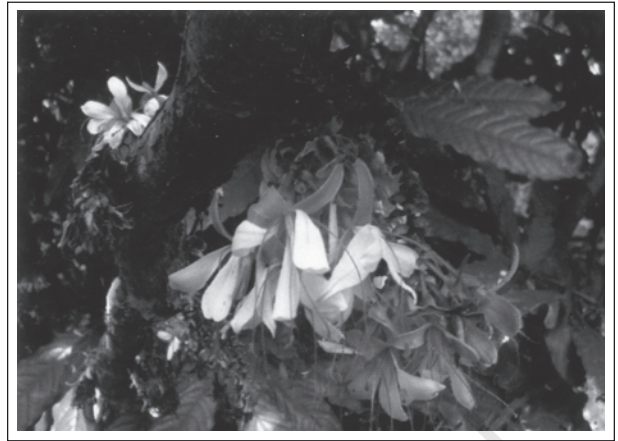
चित्र 14.3: हमबोशिया डेकरेंस बेड- दक्षिण पश्चिमी घाट (भारत) की एक दुर्लभ प्रजाति

मानव के अस्तित्व के लिए जैव-विविधता अति आवश्यक है। जीवन का हर रूप एक दूसरे पर इतना निर्भर है कि किसी एक प्रजाति पर संकट आने से दूसरों में असंतुलन की स्थिति पैदा हो जाती है। यदि पौधों और प्राणियों की प्रजातियाँ संकटापन्न होती हैं, तो इससे पर्यावरण में गिरावट उत्पन्न होती है और अन्ततोगत्वा मनुष्य का अपना अस्तित्व भी खतरे में पड़ सकता है।