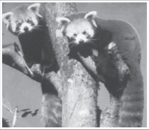
चित्र 14.2: रेड पांडा - एक संकटापन्न प्रजाति

विश्व की सभी संकटापन्न प्रजातियों के बारे में (Red list) रेड लिस्ट के नाम से सूचना प्रकाशित करता है।