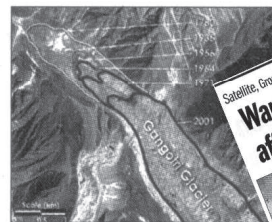
This image shows how the Gangotri glacier terminus has retracted since 1780. The contour lines are approximate. (Image by Jesse Allen, Earth Observatory; based on data provided by the ASTER Science Team)

"Himalayan glaciers are among the fastest retreating glaciers globally due to the effects of global warming," the WWF said in a statement. "This will eventually result in water shortages for hundreds of millions of people who rely