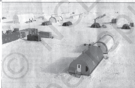
The research station for the European Project for Ice Coring in Antarctica.