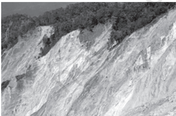
चित्र 5.3 : भारत-नेपाल सीमा, उत्तर प्रदेश में शारदा नदी के निकट शिवालिक हिमालय शृंखलाओं में भूस्खलन स्कार

ढाल, जिसपर संचलन होता है, के संदर्भ में पश्च-आवर्तन (Rotation) के साथ शैल-मलवा की एक या कई इकाइयों के फिसलन (Slipping) को अवसर्पण कहते हैं। पृथ्वी के पिंड के पश्च-आवर्तन के बिना मलवा का तीव्र लोटन (Rolling) या स्खलन मलवा स्खलन कहलाता है। मलवा स्खलन में खड़े (Vertical) या प्रलंबी फलक (Face) से मिट्टी मलवा का प्रायः स्वतंत्र पतन होता है। संस्तर जोड़ या भ्रंश के नीचे पृथक शैल बृहत् के स्खलन को शैल