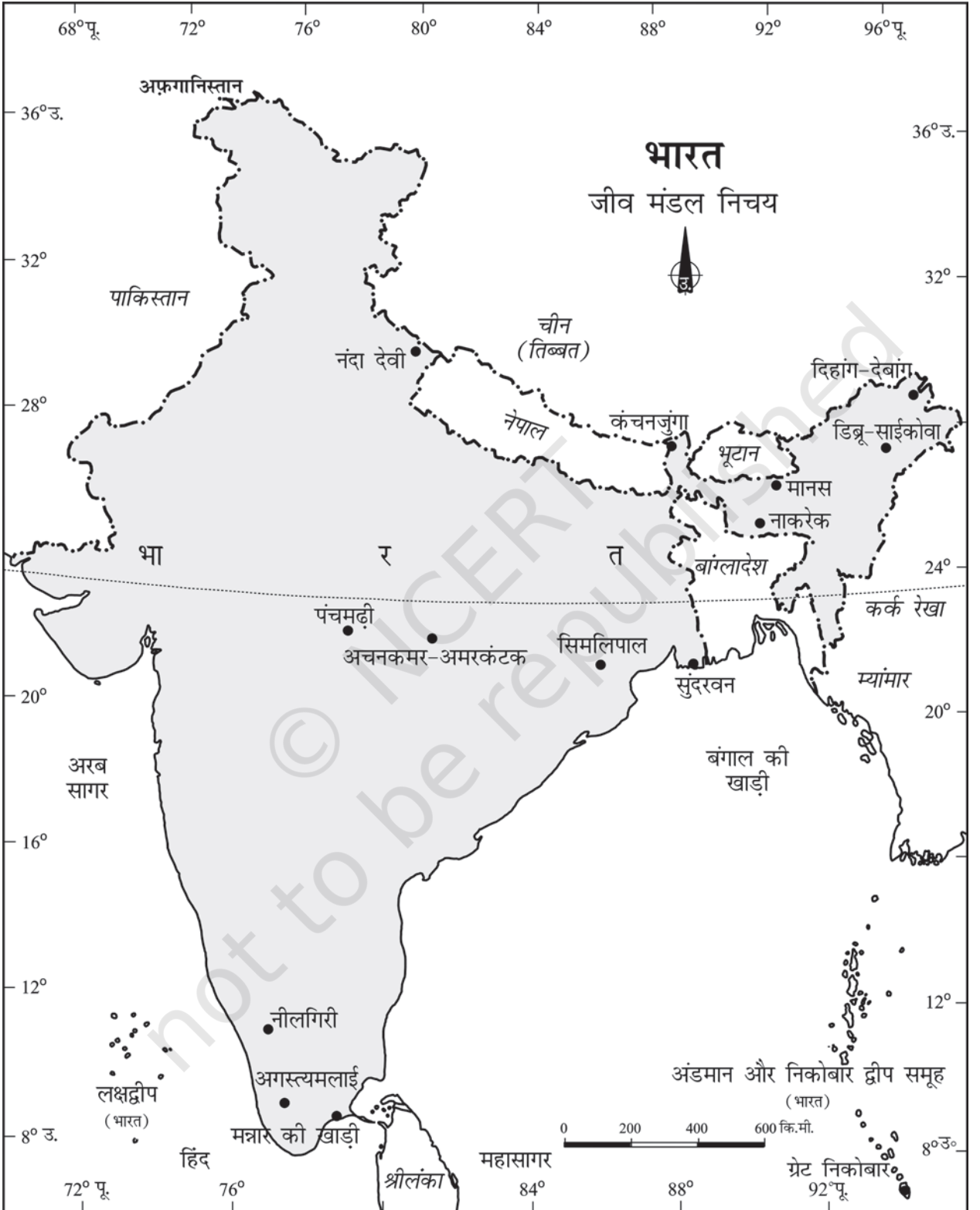
चित्र 5.9 : भारत : जीव मंडल निचय