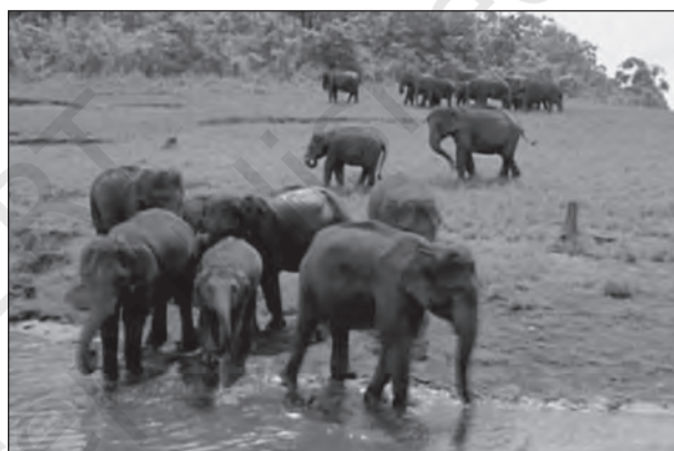
चित्र 5.7 : अपने प्राकृतिक आवास में हाथी

और उनके आवास के बचाव के लिए चलायी जा रही हैं। इनमें से प्रोजेक्ट टाईगर 1973 से चलाई जा रही है। इसका मुख्य उद्देश्य भारत में बाघों की जनसंख्या का स्तर बनाए रखना है, जिससे वैज्ञानिक, सौन्दर्यात्मक सांस्कृतिक और पारिस्थितिक मूल्य बनाए रखे जा सकें। इससे प्राकृतिक धरोहर को भी संरक्षण मिलेगा जिसका लोगों को शिक्षा और मनोरंजन के रूप में फायदा होगा। शुरू में यह योजना नौ बाघ निचयों (आरक्षित क्षेत्रों) में शुरू की गई थी और ये 16,339 वर्ग किलोमीटर पर फैली थी। अब यह योजना 50 क्रोड बाघ निचयों में चल रही है और इनका क्षेत्रफल 71,027.10 वर्ग किलोमीटर