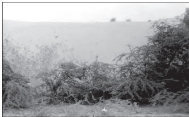
चित्र 5.4 : उष्ण कटिबंधीय काँटेदार वन

उष्ण कटिबंधीय काँटेदार वन उन भागों में पाए जाते हैं, जहाँ वर्षा 50 सेंटीमीटर से कम होती है। इन वनों में कई प्रकार के घास और झाड़ियाँ शामिल हैं। इसमें दक्षिण-पश्चिमी पंजाब, हरियाणा, राजस्थान, गुजरात, मध्य प्रदेश और उत्तर प्रदेश के अर्ध-शुष्क क्षेत्र शामिल हैं। इन वनों में पौधे लगभग पूरे वर्ष पर्णरहित रहते हैं और झाड़ियों जैसे लगते हैं। इनमें पाई जाने वाली मुख्य प्रजातियाँ बबूल, बेर, खजूर, खैर, नीम, खेजड़ी और पलास इत्यादि हैं। इन वृक्षों के नीचे लगभग 2 मीटर लंबी गुच्छ घास उगती है।