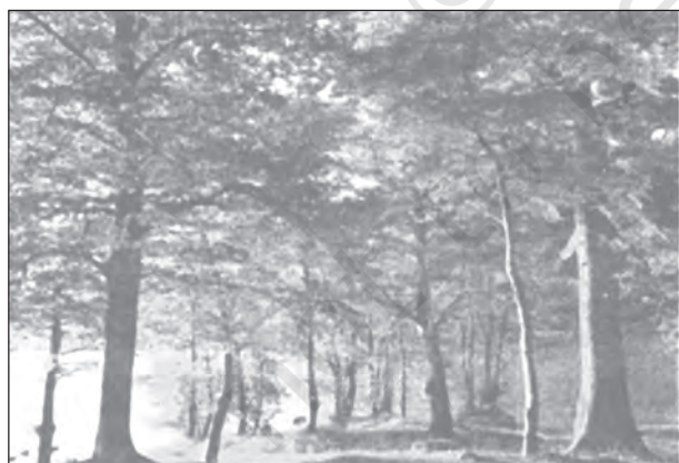
चित्र 5.3 : पर्णपाती वन

भारतवर्ष में, ये वन बहुतायत में पाए जाते हैं। इन्हें मानसून वन भी कहा जाता है। ये वन उन क्षेत्रों में पाए जाते हैं, जहाँ वार्षिक वर्षा 70 से 200 सेंटीमीटर होती है। जल उपलब्धता के आधार पर इन वनों को आर्द्र और शुष्क पर्णपाती वनों में विभाजित किया जाता है।