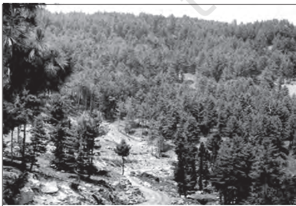
चित्र 5.5 : पर्वतीय वन

ऊँचाई बढ़ने के साथ हिमालय पर्वत शृंखला में उष्ण कटिबंधीय वनों से टुण्ड्रा में पाई जाने वाली प्राकृतिक वनस्पति पायी जाती है। हिमालय के गिरीपद पर पर्णपाती वन पाए जाते हैं। इसके बाद 1,000 से 2,000 मीटर की ऊँचाई पर आर्द्र शीतोष्ण कटिबंधीय प्रकार के वन पाए जाते हैं। उत्तर-पूर्वी भारत की उच्चतर पहाड़ी शृंखलाओं और पश्चिम बंगाल और उत्तरांचल के पहाड़ी इलाकों में चौड़े पत्तों वाले ओक और चेस्टनट जैसे सदाबहार वन पाए जाते हैं। इस क्षेत्र में 1,500 से 1,750 मीटर की ऊँचाई पर व्यापारिक महत्व वाले चीड़ के वन पाए जाते हैं। हिमालय के पश्चिमी भाग में बहुमूल्य वृक्ष प्रजाति देवदार के वन पाए जाते हैं। देवदार की लकड़ी अधिक मजबूत होती है और निर्माण कार्य में प्रयुक्त होती है। इसी तरह चिनार और वालन जिसकी लकड़ी कश्मीर हस्तशिल्प के लिए इस्तेमाल होती है, पश्चिमी हिमालय क्षेत्र में प्रचुर मात्रा में पाए जाते हैं। बल्यूपाइन और स्प्रूस 2,225 से 3,048 मीटर की ऊँचाई पर पाए जाते हैं। इस ऊँचाई पर कई स्थानों पर शीतोष्ण कटिबंधीय घास भी उगती है। इससे अधिक ऊँचाई पर एल्पाइन वन और चारागाह पाए जाते हैं। 3,000 से 4,000 मीटर की ऊँचाई पर