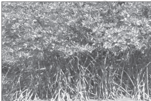
चित्र 5.6 : मैंग्रोव वन

भारत में मैंग्रोव वन 6,740 वर्ग किलोमीटर क्षेत्र में फैले हैं, जो विश्व के मैंग्रोव क्षेत्र का 7 प्रतिशत है। ये अंडमान और निकोबार द्वीप समूह व पश्चिम बंगाल के सुंदर वन डेल्टा में अत्यधिक विकसित हैं। इसके अलावा ये महानदी, गोदावरी और कृष्णा नदियों के डेल्टाई भाग में पाए जाते हैं। इन वनों में बढ़ते अतिक्रमण के कारण इनका संरक्षण आवश्यक हो गया है।