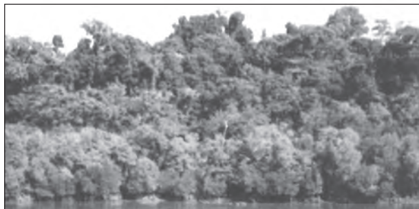
चित्र 5.1 : सदाबहार वन

ये वन पश्चिमी घाट की पश्चिमी ढाल पर, उत्तर-पूर्वी क्षेत्र की पहाड़ियों पर और अंडमान और निकोबार द्वीप समूह में पाए जाते हैं। ये उन उष्ण और आर्द्र प्रदेशों में पाए जाते हैं, जहाँ वार्षिक वर्षा 200 सेंटीमीटर से अधिक होती है और औसत वार्षिक तापमान 22^{\circ} सेल्सियस से अधिक रहता है। उष्ण कटिबंधीय वन सघन और पत्तों वाले होते हैं, जहाँ भूमि के नजदीक झाड़ियाँ और बेलें होती हैं, इनके ऊपर छोटे कद वाले पेड़ और सबसे ऊपर लंबे पेड़ होते हैं। इन वनों में वृक्षों की लंबाई 60 मीटर या उससे भी अधिक हो सकती है। चूँकि, इन पेड़ों के पत्ते झड़ने, फूल आने और फल लगने का समय अलग-अलग है, इसलिए ये वर्ष भर हरे-भरे दिखाई देते हैं। इसमें पाई जाने वाले मुख्य वृक्ष प्रजातियाँ रोजवुड, महोगनी, ऐनी और एबनी हैं।