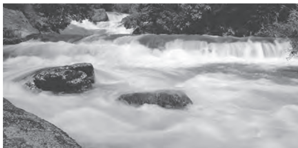
चित्र 3.3 : क्षिप्रिकाएँ

समतल घाटियों, गोखुर झीलें, बाढ़कृत मैदान, गुंफित वाहिकाएँ और नदी के मुहाने पर डेल्टा का निर्माण करती हैं। हिमालय क्षेत्र में इन नदियों का रास्ता टेढ़ा-मेढ़ा है, परंतु मैदानी क्षेत्र में इनमें सर्पाकार मार्ग में बहने की प्रवृत्ति पाई जाती है और अपना रास्ता बदलती रहती हैं। कोसी नदी, जिसे बिहार का शोक (Sorrow of Bihar) कहते हैं, अपना मार्ग बदलने के लिए कुख्यात रही है। यह नदी पर्वतों के ऊपरी क्षेत्रों से भारी मात्रा में अवसाद लाकर मैदानी भाग में जमा करती है। इससे नदी मार्ग अवरूद्ध हो जाता है व परिणामस्वरूप नदी अपना मार्ग बदल लेती है। कोसी नदी ऊपरी पर्वतीय क्षेत्र से इतनी भारी मात्रा में अवसाद क्यों लाती है? क्या आप सोचते हैं कि सामान्यतः नदियों में और विशेष तौर पर कोसी नदी में जल का बहाव व मात्रा एक समान रहती है या घटती-बढ़ती रहती है? नदी में कब जल की मात्रा अत्यधिक होती है? बाढ़ के सकारात्मक व नकारात्मक प्रभाव क्या हैं?