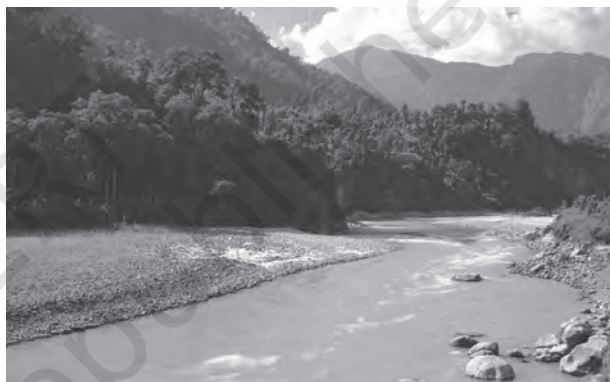
चित्र 3.1 : पर्वतीय क्षेत्र की एक नदी

दिशा से दूसरी दिशा में बहने का कारण बता सकते हैं? उत्तर में हिमालय तथा दक्षिण में पश्चिमी घाट