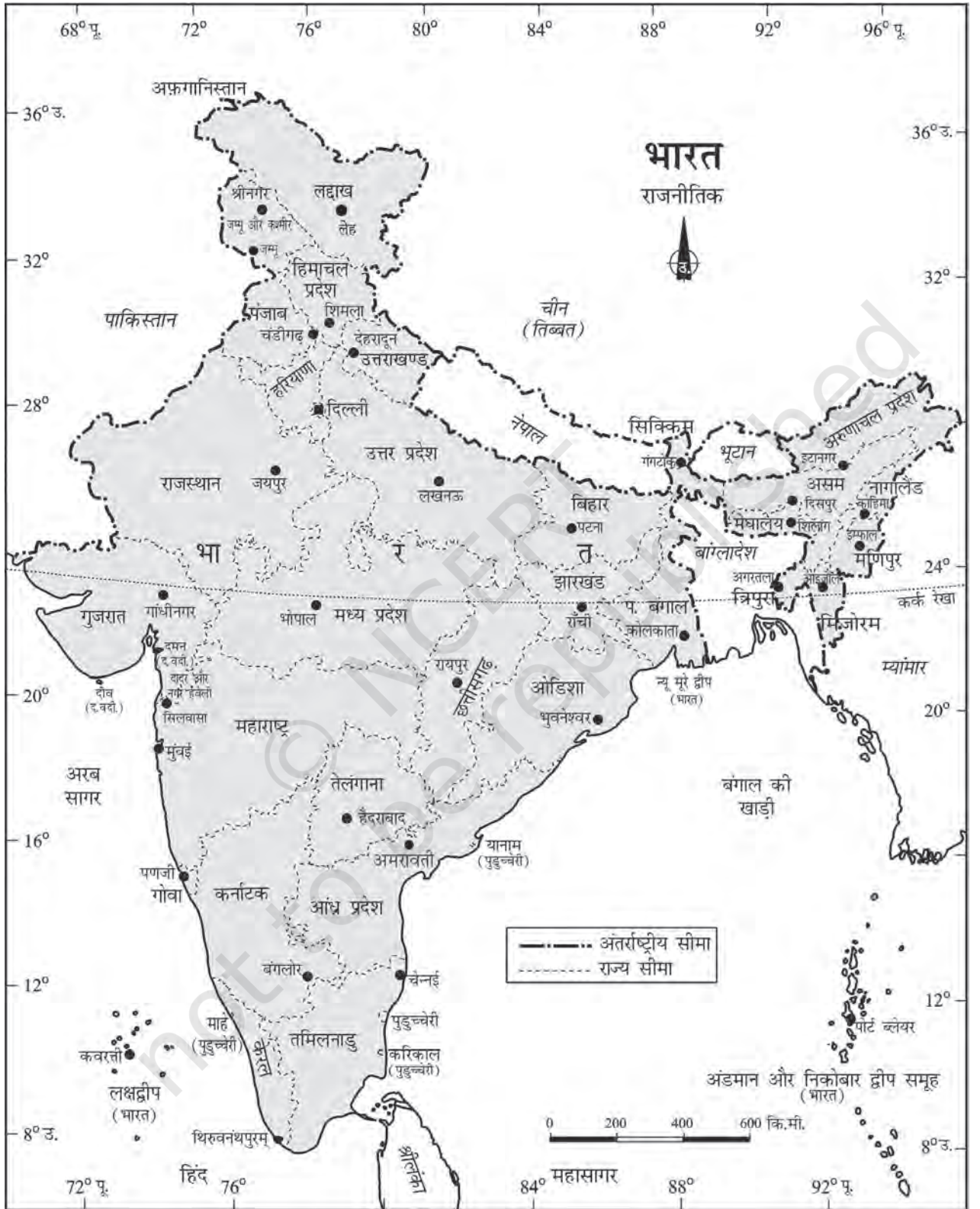
चित्र 1.1 : भारत : राजनीतिक