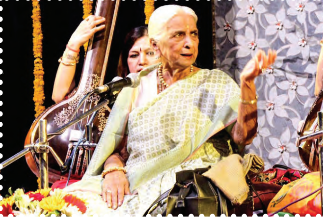
चित्र 1.5— गिरिजा देवी – प्रसिद्ध भारतीय शास्त्रीय संगीत कलाकार

व शब्द एक-दूसरे के पूरक हैं। इसीलिए एक ही शब्द को बोल-बनाव के रूप में विभिन्न स्वर नई-नई छवियाँ प्रदान करते हैं। अवध के नवाब वाज़िद अली शाह को ठुमरी का विशेष प्रचारक माना जाता है। तब से लेकर आज तक ठुमरी के विविध स्वरूप विकसित होते रहे हैं। ठुमरी में कठिन रागों की अपेक्षा सरल व संकीर्ण प्रकृति के रागों, जैसे— भैरवी, काफ़ी, खमाज, पीलू आदि का प्रयोग होता है। इसमें दीपचंदी, जत, चाचर, कहरवा आदि तालों का प्रयोग होता है। ठुमरी गायन में तबला वादक भिन्न-भिन्न लगियों का प्रयोग करते हैं जिससे ठुमरी गायन का सौंदर्य कई गुना बढ़ जाता है। वर्तमान समय में ठुमरी के दो प्रमुख रूप प्रचलित हैं—