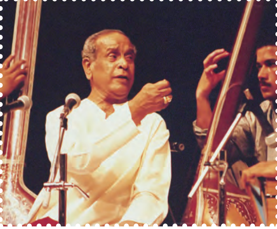
चित्र 1.2— भारत रत्न पं. भीमसेन जोशी द्वारा शास्त्रीय गायन प्रस्तुति