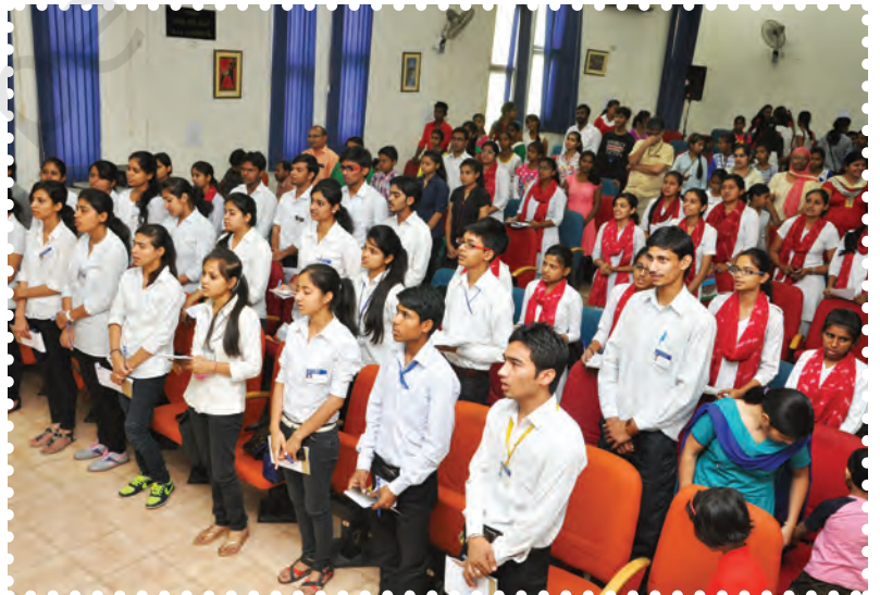
चित्र 1.3— स्कूल के बच्चों द्वारा समूह गीत प्रस्तुति

संगीत शास्त्रों में वर्णित नियमों के आधार पर संगीत का क्रियात्मक स्वरूप बनता है। समय के साथ-साथ क्रियात्मक स्वरूप में कलाकारों की नवीन प्रतिभाओं व कला कौशल के कारण कुछ नए राग, नई बंदिशें तथा नई विधाएँ जन्म लेती हैं। इनका पुनः विश्लेषण करते हुए संगीत के विद्वान कुछ नवीन सिद्धांतों व नियमों को ग्रंथों में अंकित कर देते हैं। इस प्रकार समय के साथ-साथ शास्त्र व क्रिया का आदान-प्रदान चलता रहता है और देशी संगीत एक स्वस्थ कला के रूप में विकसित होता रहता है।