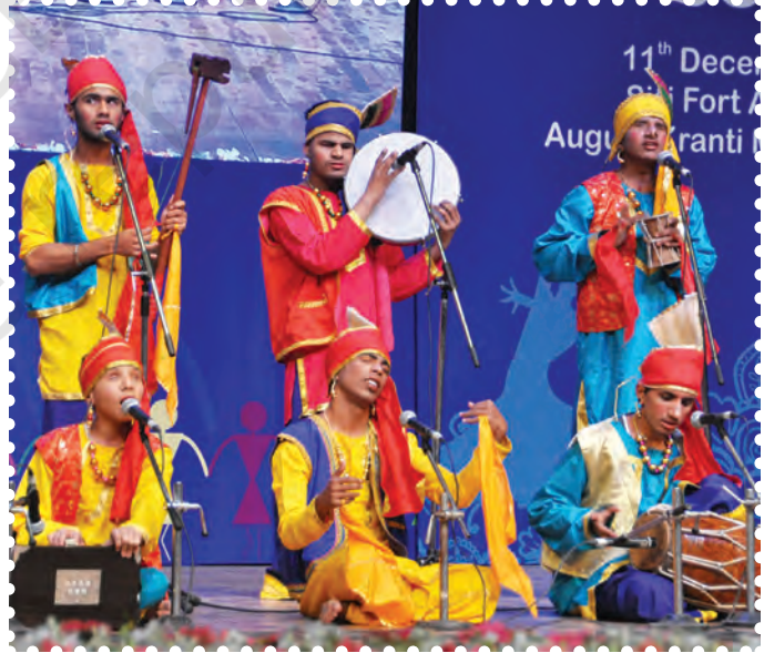
चित्र 1.1— दिव्यांग बच्चों द्वारा समूह गीत की अनोखी प्रस्तुति

भावार्थ — गायन, वादन तथा नृत्य इन तीनों कलाओं के समावेश को संगीत कहते हैं। संगीत शब्द सुनते ही हमें गीत, वाद्य यंत्रों पर बजती धुन तथा नृत्य में थिरकते पैर आदि बातों का आभास होता है। इसीलिए संगीत में गीत, वाद्य व नृत्य तीनों समन्वित हैं। संगीत का मूल आधार ‘स्वर’ और ‘लय’ है। स्वर और लय के साथ भाषा/कविता/पद का समन्वय, संगीत को अनूठा आकर्षण प्रदान करते हैं। संगीत की अभिव्यक्ति विभिन्न प्रकार की गायन और वादन शैलियों द्वारा की जाती है। संगीत हमारी भारतीय संस्कृति का अभिन्न अंग है। यह अभिव्यक्ति का एक ऐसा माध्यम है जो व्यक्ति को एक-दूसरे के साथ जोड़ता है। केवल मनुष्य एवं जीव-जंतु ही नहीं वरन् पेड़-पौधों पर भी संगीत का प्रभाव पड़ता है। संगीत एक ऐसी औषधि है जो मनोवैज्ञानिक रूप से चित्त को एकाग्र कर उसे संतुलित बनाने की क्षमता रखता है।