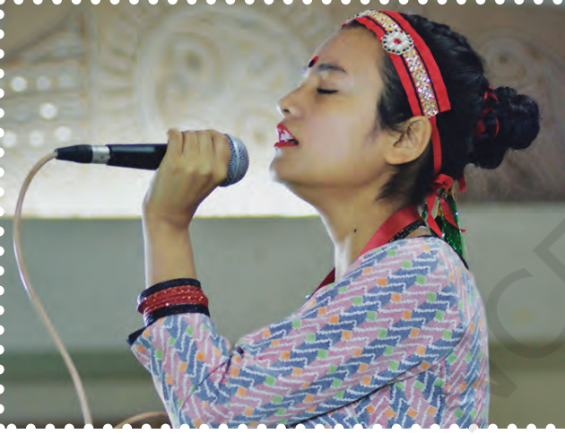
चित्र 1.6— सुगम संगीत प्रस्तुति

सुगम शब्द का अर्थ है 'सरल' या 'सहज', इसीलिए सुगम संगीत का अर्थ है— सरलता या सहजता से गाया-बजाया जाने वाला संगीत। इस प्रकार के संगीत में विशिष्ट गेय विधा या शैली के स्वरूप को बनाए रखने के अतिरिक्त किसी अन्य प्रकार के नियमों का बंधन नहीं होता। इस संगीत में यदि राग का आधार लिया गया हो तो भी राग के नियमों में शिथिलता रहती है। भाव प्रदर्शन के लिए यदि आवश्यक हो तो आलाप-तान या स्वरों का प्रयोग गीत के सौंदर्यवर्धन के लिए किया जा सकता है। सुगम संगीत के विशेष तत्वों के रूप में हाव-भाव, गहराई, रंजकता और सुंदर शब्द इसे विशेष स्थान प्रदान करते हैं। शास्त्रीय या उपशास्त्रीय संगीत के बंधनों से मुक्त इस