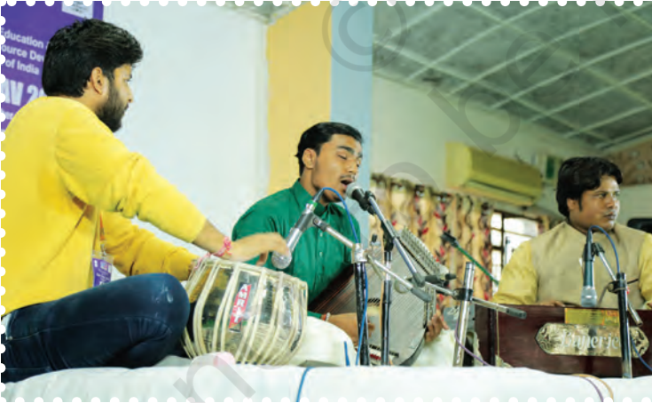
चित्र 1.4— स्कूल के बच्चों द्वारा समूह गीत प्रस्तुति