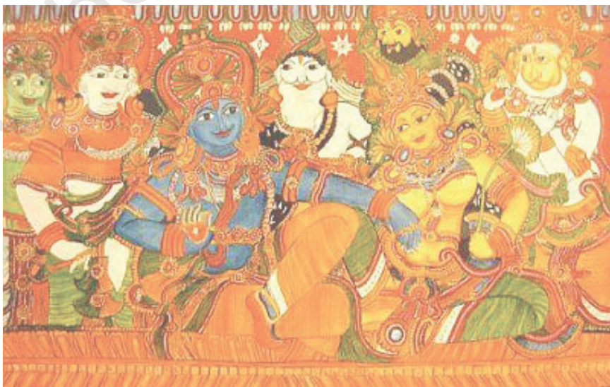
वेणुगोपाल, श्रीराम मंदिर, त्रिपरयार

केरल के चित्रकारों ने (सोलहवीं से अठारहवीं शताब्दी के दौरान) स्वयं अपनी ही एक चित्रात्मक भाषा तथा तकनीक का विकास कर लिया था, अलबत्ता उन्होंने अपनी शैली में नायक और विजयनगर शैली के कुछ तत्वों को आवश्यक सोच-समझकर अपना लिया था। इन कलाकारों ने कथककलि, कलम ऐझुथु (केरल में अनुष्ठान इत्यादि के समय भूमि पर की जाने वाली चित्रकारी) जैसी समकालीन परंपराओं से प्रभावित होकर एक ऐसी भाषा विकसित कर ली, जिसमें कंपनशील और चमकदार रंगों का प्रयोग होता था और मानव आकृतियों को त्रिआयामी रूप में प्रस्तुत किया जा सकता था। उनमें से अधिकांश चित्र पूजागृह की दीवारों और मंदिरों की मेहराबदार दीवारों पर और कुछ राजमहलों के