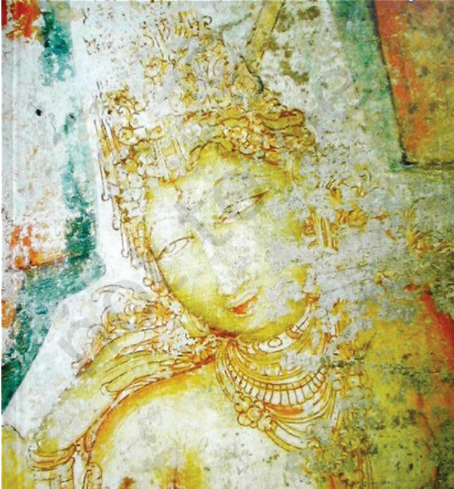
देवी, सातवीं शताब्दी ईसवी, पनामलई

बरामदे के खंभों पर नाचती हुई स्वर्गीय परियों की आकृतियाँ देखी जा सकती हैं। इन आकृतियों की बाहरी रेखाएँ दृढ़ता के साथ खींची गई हैं और हल्की पृष्ठभूमि पर सिंदूरी लाल रंग से चित्रित की गई हैं। शरीर का रंग पीला है, अंगों में लचक दिखाई देती है। नर्तकियों के चेहरों पर भावों की झलक है, अनेक गतिमान अंगों-प्रत्यंगों में लयबद्धता है। ये सभी विशेषताएँ कलाकार की सर्जनात्मक कल्पना-शक्ति और कुशलता की द्योतक हैं। इन आकृतियों की आँखें बड़ी-बड़ी और कहीं-कहीं चेहरे से बाहर निकली हुई भी दिखाई देती हैं। आँखों की यह विशेषता दक्कन और दक्षिण भारत के परवर्ती काल के अनेक चित्रों में भी देखने को मिलती है।