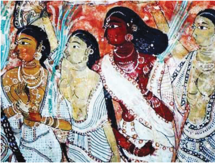
पार्वती एवं उनकी सहायिकाएँ, वीरभद्र मंदिर, लेपाक्षी

नायक कालीन चित्रों में महाभारत और रामायण के प्रसंग और कृष्णलीला के दृश्य भी चित्रित किए गए हैं। तिरुवरूर में एक चित्रफलक में मुचुकुंद की कथा चित्रित की गई है।