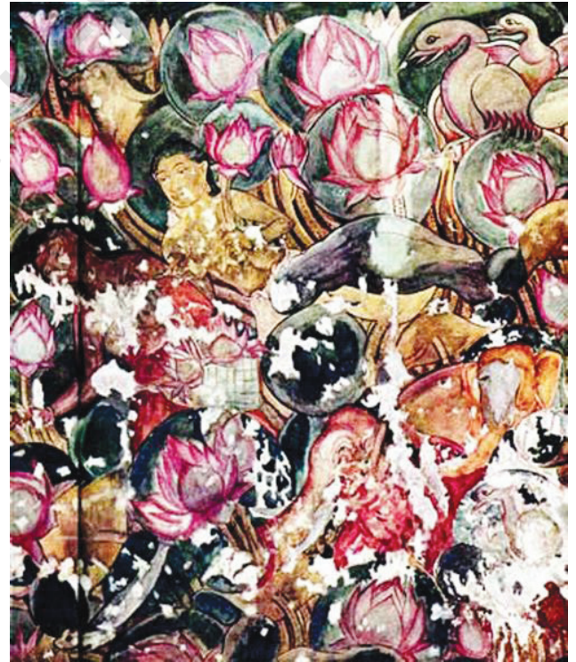
सित्तनवासल, पूर्व पांड्य काल के चित्र, नवीं शताब्दी ईसवी