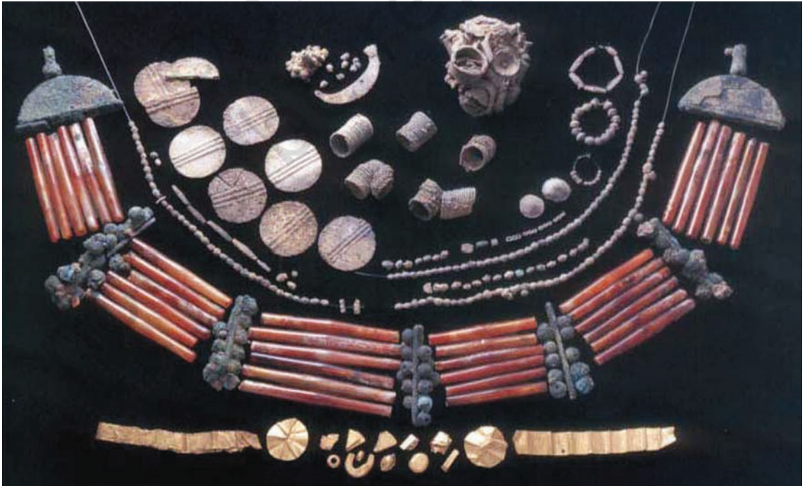
मोती एवं आभूषण

सिंधु घाटी के घरों में बड़ी संख्या में तकुएँ और तकुआ चक्रियाँ भी मिली हैं, जिससे पता चलता है कि उन दिनों कपास और ऊन की कताई बहुत प्रचलित थी। गरीब और अमीर दोनों तरह के लोगों में कताई का आम रिवाज था। यह तथ्य इस बात से उजागर होता है कि तकुएँ की चक्रियाँ मिट्टी तथा सीपियों की बनी हुई पाई गई हैं। पुरुष और स्त्रियाँ, धोती और शॉल जैसे दो अलग-अलग कपड़े पहनते थे। शॉल दाएं कंधे के नीचे से ले जाकर बाएं कंधे के ऊपर ओढ़ी जाती थी।