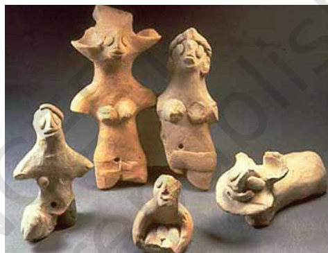
टेराकोटा के खिलौने