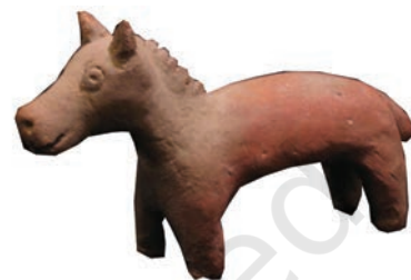
टेराकोटा के खिलौने