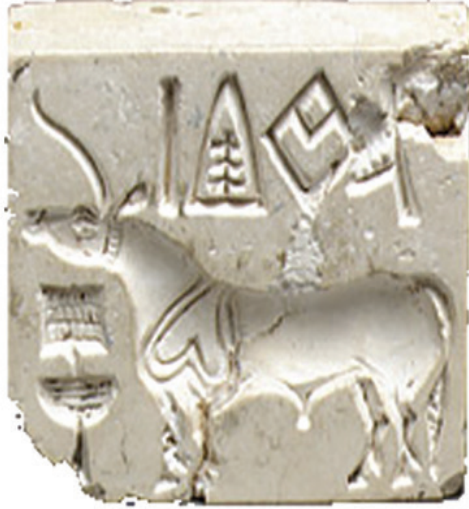
एक सिंधे की मुहर