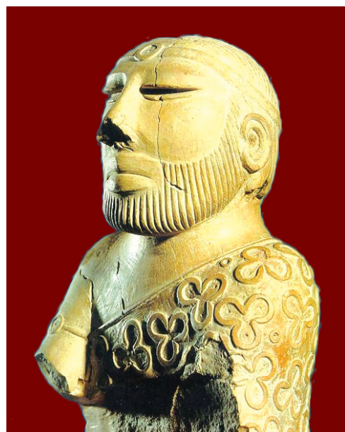
दाढ़ी वाले पुजारी की प्रतिमा

दाढ़ी वाले पुरुष को एक धार्मिक व्यक्ति माना जाता है। इस आवक्ष मूर्ति को शॉल ओढ़े हुए दिखाया गया है। शॉल बाएं कंधे के ऊपर से और दाहिनी भुजा के नीचे से डाली गई है। शॉल त्रिफुलिया नमूनों से सजी हुई है। आँखें कुछ लंबी और आधी बंद दिखाई गई हैं, मानों वह पुरुष ध्यानावस्थित हो। नाक सुंदर बनी हुई है और होंठ कुछ आगे निकले हुए हैं जिनके बीच की रेखा