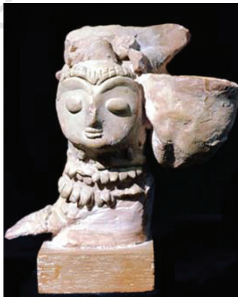
मिट्टी से बनी आकृति

हड़प्पा के लोग कांसे की ढलाई बड़े पैमाने पर करते थे और इस काम में प्रवीण थे। इनकी कांस्य मूर्तियाँ कांसे को ढालकर बनाई जाती थीं। इस तकनीक के अंतर्गत सर्वप्रथम मोम की एक प्रतिमा या मूर्ति बनाई जाती थी। इसे चिकनी मिट्टी से पूरी तरह लीपकर सूखने के लिए छोड़ दिया जाता था। जब वह पूरी तरह सूख जाती थी तो उसे गर्म किया जाता था और उसके मिट्टी के आवरण में एक छोटा सा छेद बनाकर उस छेद के रास्ते सारा पिघला हुआ मोम बाहर निकाल दिया जाता था। इसके बाद चिकनी मिट्टी के खाली सांचे में उसी छेद के रास्ते पिघली हुई धातु भर दी जाती थी। जब वह धातु ठंडी होकर ठोस हो जाती थी तो चिकनी मिट्टी के आवरण को हटा दिया जाता था। कांस्य में मनुष्यों और जानवरों दोनों की ही मूर्तियाँ बनाई गई हैं। मानव मूर्तियों का सर्वोत्तम नमूना है एक लड़की की मूर्ति, जिसे नर्तकी के रूप में जाना जाता है। कांसे की बनी हुई जानवरों की मूर्तियों में भैंस और बकरी की मूर्तियाँ विशेष रूप से उल्लेखनीय हैं। भैंस का सिर और कमर ऊँची उठी हुई है तथा सींग फैले हुए हैं। सिंधु सभ्यता के सभी केंद्रों में कांसे की ढलाई का काम बहुतायत में होता था। लोथल में पाया गया तांबे का कुत्ता और पक्षी तथा कालीबंगा में पाई गई साँड़ की कांस्य मूर्ति को हड़प्पा और मोहनजोदड़ो में पाई गई ताँबे और कांसे की मानव मूर्तियों से किसी प्रकार भी कमतर नहीं कहा जा सकता।