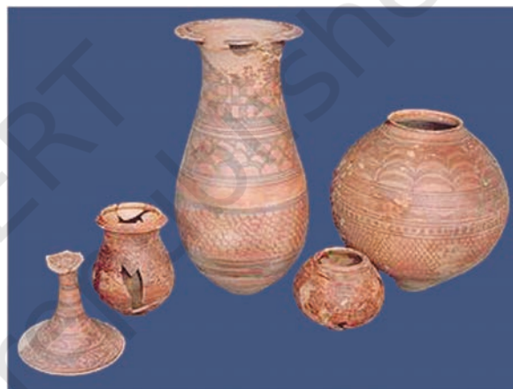
मिट्टी के बर्तन