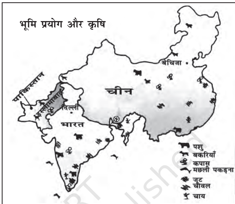
चित्र 8.2 भारत, चीन तथा पाकिस्तान में भूमि-प्रयोग तथा कृषि (स्केल के अनुसार नहीं)

चीन में प्रजनन दर भी बहुत कम है और पाकिस्तान में बहुत अधिक। चीन में नगरीकरण अधिक है। भारत में नगरीय क्षेत्रों में 36 प्रतिशत लोग रहते हैं।