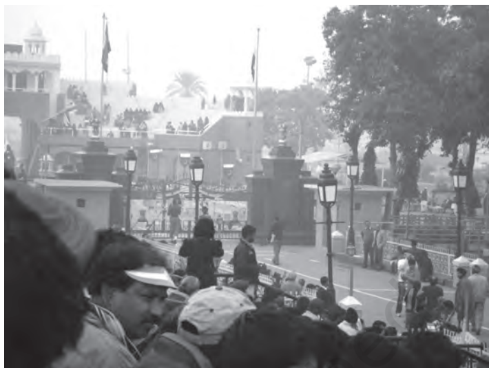
चित्र 8.1 बाघा बॉर्डर केवल पर्यटन स्थल ही नहीं बल्कि भारत तथा पाकिस्तान के

कि स्वामित्व के लिए)। वे प्रकल्पित कर देने के बाद भूमि से होने वाली समस्त आय को अपने पास रख सकते थे। बाद के चरण में औद्योगिक क्षेत्र में सुधार आरंभ किये गये। सामान्य, नगरीय तथा ग्रामीण उद्यमों की निजी क्षेत्रक की उन फर्मों को वस्तुएँ उत्पादित करने की अनुमति थी, जो स्थानीय लोगों के स्वामित्व और संचालन के अधीन थे। इस अवस्था में उद्यमों को जिन पर सरकार का स्वामित्व था, (जिन्हें राज्य के उद्यम एस.ओ.ई. के