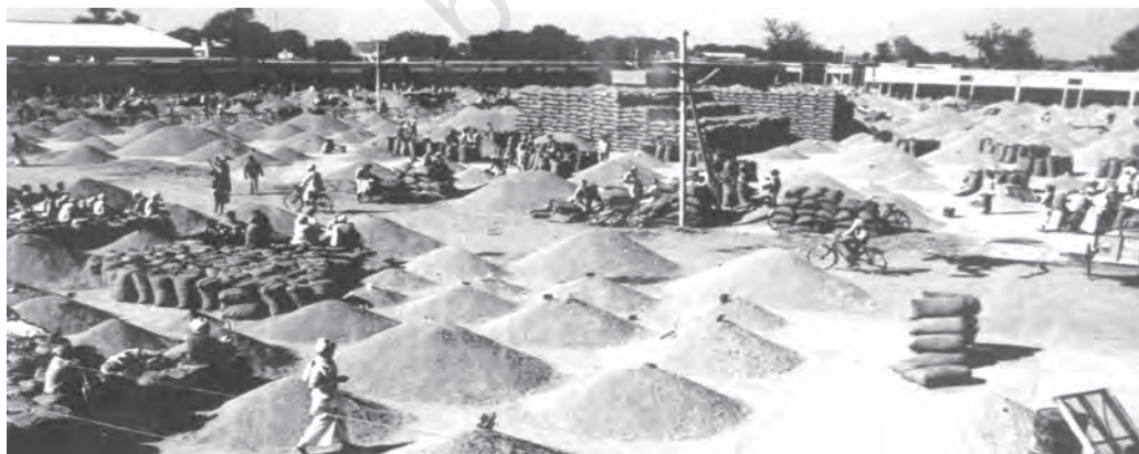
चित्र 5.1 नियमित अनाज मंडियाँ किसानों और उपभोक्ताओं को लाभ पहुँचाती हैं

स्वतंत्रतापूर्व व्यापारियों को अपना उत्पादन बेचते समय किसानों को तोल में हेरा फेरी तथा खातों में गड़बड़ी का सामना करना पड़ता था। प्रायः किसानों को बाज़ार में प्रचलित भावों का पता नहीं होता था और उन्हें अपना माल बहुत