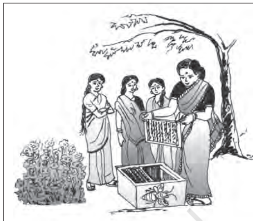
चित्र 5.5 ग्रामीण परिवार में महिलाएँ मधुमक्खी पालन को एक उद्यम क्रिया के रूप में ले सकती हैं

मत्स्य पालन: मछुआरों के समुदाय तो प्रत्येक जलागार को 'माँ' या 'दाता' मानते हैं। सागर-महासागर, सरिताएँ, झीलें, प्राकृतिक तालाब, प्रवाह आदि सभी जलागार मछुआरों के समाज के लिए निश्चित जीवन दीपक स्रोत बन जाते हैं। भारत में बजटीय प्रावधानों में वृद्धि और मत्स्य पालन एवं जल कृषिकी में नवीन प्रौद्योगिकी के प्रवेश के बाद से मत्स्य उद्योग ने विकास की नई मंजिलें तय की हैं। आजकल देश के समस्त मत्स्य उत्पादन का 65 प्रतिशत अंतर्वर्ती क्षेत्रों से तथा 35 प्रतिशत महासागरीय क्षेत्रों से प्राप्त हो रहा है। यह मत्स्य उत्पादन सकल घरेलू उत्पाद का 0.9 प्रतिशत है। मत्स्य उत्पादकों में प्रमुख राज्य पं. बंगाल, केरल, गुजरात, महाराष्ट्र