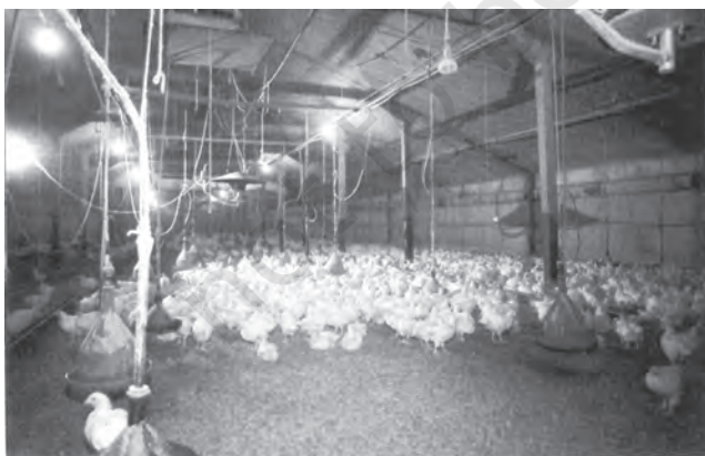
चित्र 5.4 भारत में मुर्गी पालन का पशुधन में सबसे अधिक भाग है

और तमिलनाडु हैं। मछुआरों के परिवारों का एक बड़ा हिस्सा निर्धन है। इस वर्ग में व्याप्त निम्न रोजगार, निम्न प्रतिव्यक्ति आय, अन्य कार्यों की ओर श्रम के प्रवाह का अभाव, उच्च निरक्षरता दर तथा गंभीर ऋण-ग्रस्तता इन मछुआरा समुदाय से आजकल जूझ रहे हैं। यद्यपि महिलाएँ मछलियाँ पकड़ने के काम में नहीं लगी हैं, पर 60 प्रतिशत निर्यात और 40 प्रतिशत आंतरिक मत्स्य व्यापार का संचालन उन्हीं के हाथों में है। विपणन के लिए आवश्यक पूँजी जुटाने में मछुआरा समुदाय की महिलाओं की सहायता के लिए सहकारिताओं और स्वयं सहायता समूहों के माध्यम से साख सुविधाओं का विस्तार किए जाने की आवश्यकता अब अनुभव हो रही है।