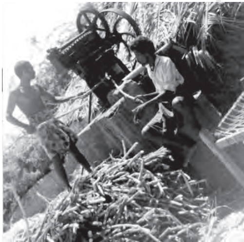
चित्र 5.2 गुड़ निर्माण कृषि क्षेत्रक का एक संबद्ध क्रियाकलाप है

आवश्यकता इसलिए उत्पन्न हो रही है, क्योंकि सिर्फ खेती के आधार पर आजीविका कमाने में जोखिम बहुत अधिक हो जाता है। अतः विविधीकरण द्वारा हम न केवल खेती से जोखिम को कम करने में सफल होंगे बल्कि ग्रामीण जन समुदाय को उत्पादक और वैकल्पिक धारणीय आजीविका