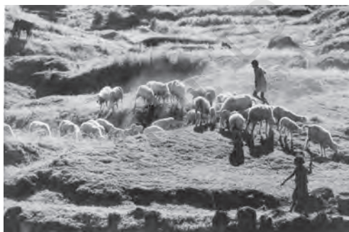
चित्र 5.3 ग्रामीण क्षेत्रों में भेड़ पालन आय वृद्धि का महत्वपूर्ण स्रोत है

पर्यटन आदि सम्मिलित हैं। कुछ ऐसे क्षेत्रक भी हैं जिनमें संभावनाएँ तो विद्यमान हैं, पर जिनके लिए संरचनात्मक सुविधाएँ तथा अन्य सहायक कार्यों का नितांत अभाव है। इस वर्ग में हम परंपरागत गृह उद्योगों को रख सकते हैं जैसे, मिट्टी के बर्तन बनाना, शिल्प कलाएँ, हथकरघा आदि। यद्यपि, अधिकांश ग्रामीण महिलाएँ कृषि में रोजगार प्राप्त करती हैं, जबकि पुरुष गैर-कृषि रोजगार की तलाश में हैं। किंतु, हाल के वर्षों में ग्रामीण महिलाएँ भी गैर कृषि कार्यों की ओर अग्रसर होने लगी हैं (देखें बॉक्स 5.2)।