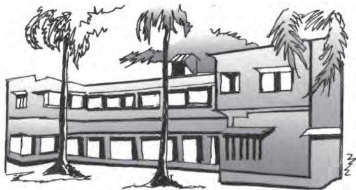
चित्र 4.5 शैक्षिक आधारिक संरचनाओं में निवेश अपरिहार्य

संस्थाओं के शैक्षिक व्यय को शामिल कर लें तो शिक्षा पर कुल व्यय और अधिक होना चाहिए। कुल शिक्षा व्यय का एक बहुत बड़ा हिस्सा प्राथमिक शिक्षा पर खर्च होता है। उच्चतर/तृतीयक शैक्षिक संस्थाओं (उच्च शिक्षा के संस्थानों जैसे-महाविद्यालयों, बहुतकनीकी संस्थानों और विश्वविद्यालयों आदि) पर होने वाला व्यय सबसे कम है। यद्यपि औसत रूप से सरकार उच्चतर शिक्षा पर बहुत कम व्यय करती है, किंतु प्रति विद्यार्थी उच्चतर शिक्षा पर व्यय प्राथमिक शिक्षा की तुलना में अधिक है। इसका, अर्थ यह नहीं है कि वित्तीय संसाधनों को उच्चतर शिक्षा से प्राथमिक शिक्षा की ओर कर दिया जाना चाहिए।