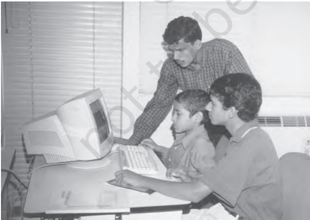
चित्र 4.4 आगे का काम: भारत को ज्ञान अर्थव्यवस्था में परिवर्तित

तेजी से परिवर्तन के दौर से गुजर रहा है। बिग डेटा, मशीन लर्निंग और आर्टिफ़िशियल इंटेलिजेंस जैसे क्षेत्रों में हो रहे बहुत से वैज्ञानिक और तकनीकी विकास के चलते एक ओर विश्व भर में अकुशल कामगारों की जगह मशीनें काम करने लगेंगी और दूसरी ओर डेटा साइंस, कंप्यूटर साइंस और गणित के क्षेत्रों में ऐसे कुशल कामगारों की जरूरत और माँग बढ़ेगी जो विज्ञान, समाज विज्ञान और मानविकी के विविध विषयों में योग्यता रखते हों। जलवायु परिवर्तन, बढ़ते प्रदूषण और घटते प्राकृतिक संसाधनों की वजह से हमें ऊर्जा, भोजन, पानी, स्वच्छता आदि की आवश्यकताओं को पूरा करने के नए रास्ते खोजने होंगे और इस कारण भी जीव विज्ञान, रसायन विज्ञान, भौतिक विज्ञान, कृषि, जलवायु विज्ञान, और समाज विज्ञान के क्षेत्रों में नए कुशल कामगारों की जरूरत होगी। महामारी और महामारी के बढ़ते उद्भव संक्रामक रोग प्रबंधन और टीकों के विकास में सहयोगी अनुसंधान और परिणामी सामाजिक