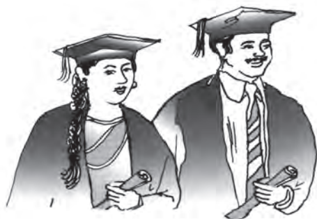
चित्र 4.7 उच्च शिक्षा: कम प्राप्तकर्ता

उच्च शिक्षा लेने वालों की कमी: भारत में शिक्षा का पिरामिड बहुत ही नुकीला है, जो दर्शाता है कि उच्चतर शिक्षा स्तर तक बहुत