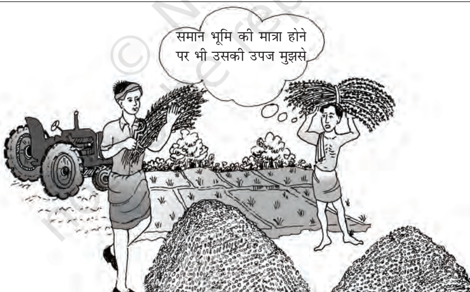
चित्र 4.1 किसानों को समुचित शिक्षा तथा प्रशिक्षण ही खेतों की उत्पादकता में वृद्धि कर सकती है

आर्थिक समृद्धि में उसका योगदान क्रमशः अधिक होता है। शिक्षा पाने का प्रयास केवल उपार्जन क्षमता बढ़ाने के लिए नहीं किया जाता बल्कि उसके और भी अधिक मूल्यवान लाभ हैं। शिक्षा लोगों को उच्चतम सामाजिक स्थिति और गौरव प्रदान करती है। यह किसी व्यक्ति को अपने जीवन में बेहतर विकल्पों का चयन कर पाने के योग्य बनाता है, व्यक्ति को समाज में चल रहे परिवर्तनों की बेहतर समझ प्रदान करता है और नव परिवर्तनों को बढ़ावा देता है। शिक्षित श्रम शक्ति की उपलब्धता नयी प्रौद्योगिकी को अपनाने में भी सहायक होती है। देश शिक्षा के अवसरों