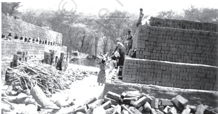
चित्र 4.6 विद्यालय छोड़ने वाले छात्र बाल श्रम को बढ़ावा देते हैं जिससे मानव पूँजी का क्षय होता है

कम लोग पहुँच पाते हैं। यही नहीं, शिक्षित युवाओं की बेरोजगारी दर भी उच्चतम है। राष्ट्रीय प्रतिदर्श सर्वेक्षण संगठन के आंकड़ों के अनुसार, वर्ष 2011-12 में ग्रामीण क्षेत्रों में स्नातक व ऊपर अध्ययन किया हो युवा पुरुषों के बीच बेरोजगारी दर 19 प्रतिशत थी। उनके शहरी समकक्षों में 16 प्रतिशत अपेक्षाकृत कम स्तर पर बेरोजगारी दर थी। सबसे गंभीर रूप से प्रभावित लोगों में लगभग 30 प्रतिशत बेरोजगार हैं जो युवा ग्रामीण महिला थीं। इसके