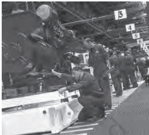
चित्र 4.3 वैज्ञानिक और तकनीकी जन-शक्ति: मानव पूँजी का एक मुख्य घटक है

मानव पूँजी की वृद्धि के कारण आर्थिक संवृद्धि होती है। इसे सिद्ध करने के लिए व्यावहारिक साक्ष्य अभी स्पष्ट नहीं हैं। इसका कारण मापन की समस्याएँ हो सकती हैं। उदाहरण के लिए, स्कूली वर्षों की गणना, शिक्षक-शिक्षार्थी अनुपात और नामांकन दर आदि के आधार पर शिक्षा का मापन उसकी गुणवत्ता को आर्थिक रूप से व्यक्त नहीं कर पाता। इसी प्रकार स्वास्थ्य सेवाओं पर मौद्रिक व्यय, जीवन प्रत्याशा तथा मृत्यु दरों आदि से देश की जनसंख्या के वास्तविक स्वास्थ्य स्तर का सही ज्ञान नहीं होता। यदि इन सूचकों का प्रयोग कर विकसित तथा विकासशील देशों में शिक्षा व स्वास्थ्य स्तरों और प्रतिव्यक्ति आय में सुधारों की तुलना करें तो हमें मानव पूँजी के परिवर्तनों में साहचर्य दिखायी पड़ता है, किंतु प्रतिव्यक्ति वास्तविक आय में ऐसी कोई प्रवृत्ति स्पष्ट नहीं होती। दूसरे