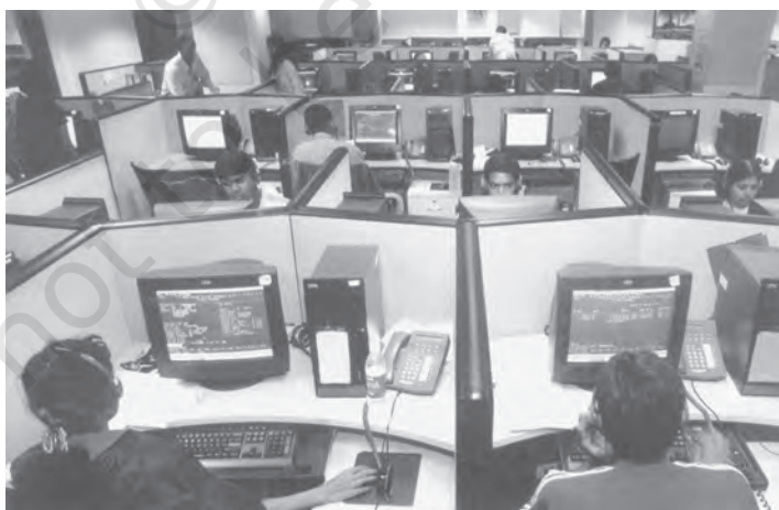
चित्र 3.2 सूचना प्रौद्योगिकी उद्योग का भारत के निर्यात में प्रमुख योगदान

औचित्य नहीं है, क्योंकि विश्व व्यापार का अधिकांश भाग तो विकसित देशों के बीच ही होता है। उनका यह भी मानना है कि विकसित देश अपने देशों में जहाँ कृषि सहायिकी दिये जाने को लेकर शिकायत करते हैं, वहीं विकासशील देश अपने बाजारों को विकसित देशों के लिए खोले जाने को मजबूर करने को लेकर छला हुआ महसूस करते हैं। वे देश विकासशील देशों को अपने बाजारों में किसी न किसी बहाने प्रवेश करने से रोकने का प्रयास भी करते रहते