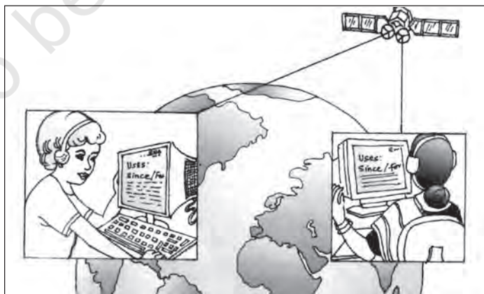
चित्र 3.1 बाह्य प्रापण : बड़े शहरों में रोजगार का एक नया अवसर

सरकार ने सार्वजनिक उपक्रमों को प्रबंधकीय निर्णयों में स्वायत्तता प्रदान कर उनकी कार्यकुशलता को सुधारने का प्रयास किया है। उदाहरण के लिए, कुछ सार्वजनिक उपक्रमों को 'महारत्न', 'नवरत्न' और 'लघुरत्न' का विशेष दर्जा दिया गया है (देखें बॉक्स 3.1)।