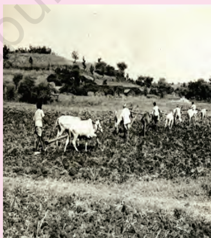
चित्र 1.1: ब्रिटिश औपनिवेशिक शासन के अंतर्गत भारत में कृषि में गतिहीनता

सत्रहवीं शताब्दी में भारत आए फ्रांसीसी यात्री बर्नीयर ने तत्कालीन बंगाल का इस प्रकार वर्णन किया है- “अपने दो बार के भ्रमण के दौरान बंगाल के विषय में संगृहीत जानकारी के आधार पर मैं कह सकता हूँ कि यह क्षेत्र मिश्र देश से कहीं अधिक समृद्ध है। यहाँ से सूती-रेशमी वस्त्र, चावल, शक्कर और मक्खन का प्रचुर मात्रा में निर्यात होता है। यहाँ अपने आंतरिक उपभोग के लिए भी गेहूँ, सब्जियाँ, अनाज, मुर्गे/मुर्गियाँ, बत्तख आदि का भरपूर उत्पादन होता है। यहाँ सूअरों के बड़े-बड़े झुंड तथा भेड़-बकरियों के विशाल झुंड भी विद्यमान हैं। इस क्षेत्र में हर प्रकार की मछलियाँ प्रचुरता में उपलब्ध हैं। राजमहल से लेकर समुद्र तक अतीत में परिवहन तथा सिंचाई के लिए गंगा नदी से (बहुत यत्न और श्रमपूर्वक) काट कर बनाई गई नहरों का जाल-सा बिछा हुआ है।”