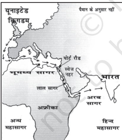
चित्र 1.2 स्वेज नहर: भारत और इंग्लैंड के बीच राजमार्ग के रूप में प्रयुक्त स्वेज नहर

ब्रिटिश भारत की जनसंख्या के विस्तृत ब्यौरे सबसे पहले 1881 की जनगणना के तहत