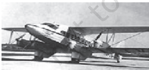
चित्र 1.5 टाटा एयरलाइंस: टाटा संस के विभाग के रूप में इस कंपनी की स्थापना से 1932 में भारत में उड्डयन क्षेत्र की नींव रखी गई

स्वतंत्रता प्राप्ति तक, 200 वर्षों के विदेशी शासन का प्रभाव भारतीय अर्थव्यवस्था के प्रत्येक आयाम पर अपनी पैठ बना चुका था। कृषि क्षेत्रक पहले से ही अत्यधिक श्रम-अधिशेष के भार से लदा था। उसकी उत्पादकता का स्तर भी बहुत कम था। औद्योगिक क्षेत्रक भी आधुनिकीकरण वैविध्य, क्षमता संवर्धन और सार्वजनिक निवेश में वृद्धि की माँग कर रहा