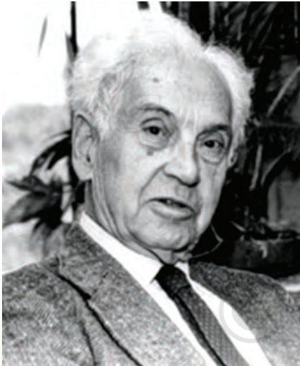
एरनस्ट मेयर (1904 - 2004)

एरनस्ट मेयर का जन्म 5 जुलाई, 1904 में कैंपटन, जर्मनी में हुआ था। आप हावर्ड विश्वविद्यालय के विकासपरक जीव वैज्ञानिक थे, जिन्हें '20वीं शती का डार्विन' कहा गया। आप अब तक के 100 महान वैज्ञानिकों में से एक थे। मेयर ने सन् 1953 में हावर्ड विश्वविद्यालय की कला एवं विज्ञान संकाय में नौकरी प्राप्त की और 1975 में एलेक्जेंडर अगासीज प्रोफेसर ऑफ जुलोजी एमीरिटस की पदवी के साथ अवकाश प्राप्त किया। अपने 80 सालों के कार्य जीवन में आपका पक्षी-विज्ञान, वर्गीकरण-विज्ञान, प्राणि-भूगोल, विकास, वर्गिकी तथा जीव विज्ञान के इतिहास एवं दर्शन आदि पर अनुसंधान केंद्रित रहा। आप ने लगभग अकेले ही विकासीय जीव विज्ञान के केंद्रीय प्रश्न जाति विविधता की उत्पत्ति को खड़ा किया, जो कि आज सच है। इसके साथ ही आपने हाल ही में स्वीकृत जीव वैज्ञानिक जाति वर्गिकी की परिभाषा की अगुवाई की। मेयर को तीन पुरस्कार दिए गए, जिन्हें व्यापक तौर पर जीव विज्ञान के तीन ताजों की संज्ञा दी जाती है: 1983 में बालजॉन प्राइज, 1998 में जीव विज्ञान के लिए इंटरनेशनल प्राइज और 1999 में क्राफ़र्ड प्राइज। मेयर 100 वर्ष की आयु में 2004 में स्वर्गवासी हुए।