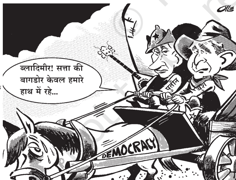
सत्ता की बागडोर

2005 में रूस में कुछ नए कानून बने हैं। इन कानूनों को बनाकर रूस के राष्ट्रपति को कुछ और शक्तियाँ सौंपी गई हैं। इसी वक्त अमरीकी राष्ट्रपति ने रूस का दौरा किया था। ऊपर दिए गए कार्टून के अनुसार लोकतंत्र और सत्ता के केंद्रीकरण में क्या संबंध है? यहाँ जिस चीज की तरफ ध्यान खींचा गया है उसकी पुष्टि में क्या आप कुछ और कार्टून जुटा सकते हैं?