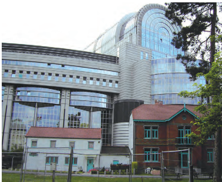
ब्रूसेल्स, बेल्जियम में स्थित यूरोपीय संसद

आपको बेल्जियम का मॉडल कुछ जटिल लग सकता है। निश्चित रूप से यह जटिल है—खुद बेल्जियम में रहने वालों के लिए भी। पर यह व्यवस्था बेहद सफल रही है। इससे मुल्क में गृहयुद्ध की आशंकाओं पर विराम लग गया है वरना गृहयुद्ध की स्थिति में बेल्जियम भाषा के आधार पर दो टुकड़ों में बँट गया होता। जब अनेक यूरोपीय देशों ने साथ मिलकर यूरोपीय संघ बनाने का