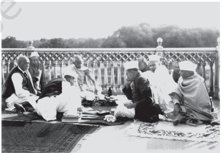
चित्र 6 - इलाहाबाद में कांग्रेस के नेताओं की बैठक, 1931

साइमन कमीशन के खिलाफ़ शांतिपूर्ण प्रदर्शन के दौरान ब्रिटिश पुलिस ने लाला लाजपत राय पर हमला किया। प्रदर्शन के दौरान मिले गहरे जख्मों के कारण उन्होंने दम तोड़ दिया।