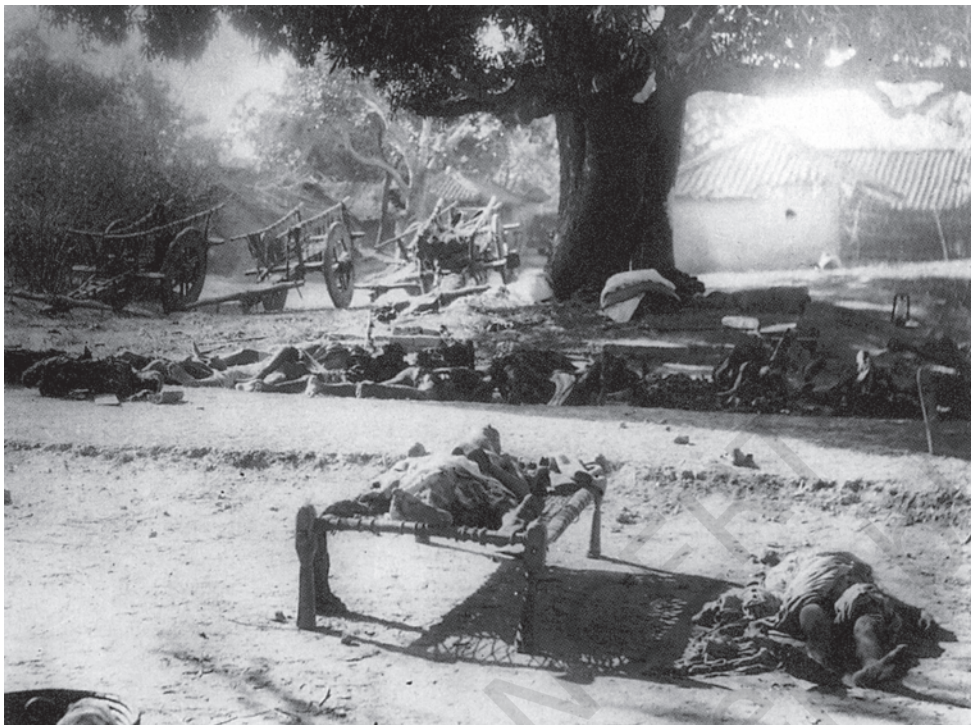
चित्र 5 - चौरी-चौरा, 1922

आदिवासियों ने गांधीजी के नाम का नारा लगाया और 'स्वतंत्र भारत' की हुंकार भरी तो वे एक अखिल भारतीय आंदोलन से भी भावनात्मक स्तर पर जुड़े हुए थे। जब वे महात्मा गांधी का नाम लेकर काम करते थे या अपने आंदोलन को कांग्रेस के आंदोलन से जोड़कर देखते थे तो वास्तव में एक ऐसे आंदोलन का अंग बन जाते थे जो उनके इलाके तक ही सीमित नहीं था।