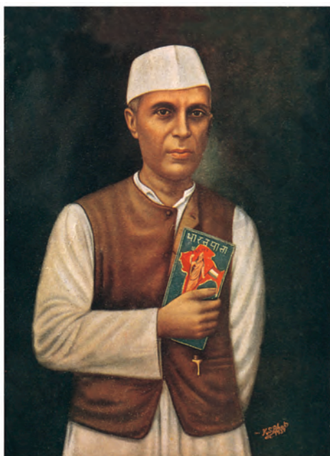
चित्र 13 - जवाहरलाल नेहरू, एक लोकप्रिय चित्र।

ध्यान से देखें कि यहाँ दर्शाई गई माँ की छवि शिक्षा, भोजन और कपड़े दे रही है। एक हाथ में माला उसके संन्यासी गुण को रेखांकित करती है। अपने पूर्ववर्ती रवि वर्मा की भांति अबनीन्द्रनाथ टैगोर ने भी ऐसी चित्र शैली विकसित करने का प्रयास किया जिसे सच्चे अर्थों में भारतीय माना जा सके।