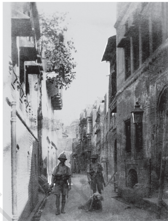
चित्र 3 - जनरल डायर के हुक्म से सिपाही लोगों को घिसट कर चलने के लिए मजबूर कर रहे हैं, पंजाब, 1919

भले ही रॉलट सत्याग्रह एक बहुत बड़ा आंदोलन था लेकिन अभी भी वह मुख्य रूप से शहरों और कस्बों तक ही सीमित था। महात्मा गांधी पूरे भारत में और भी ज्यादा जनाधार वाला आंदोलन खड़ा करना चाहते थे। लेकिन उनका मानना था कि हिंदू-मुसलमानों को एक-दूसरे के नज़दीक लाए बिना ऐसा कोई आंदोलन नहीं चलाया जा सकता। उन्हें लगता था कि खिलाफत का मुद्दा उठाकर वे दोनों समुदायों को नज़दीक ला सकते हैं। पहले विश्वयुद्ध में ऑटोमन तुर्की की हार हो चुकी थी। इस आशय की अफवाहें फैली हुई थीं कि इस्लामिक विश्व के आध्यात्मिक नेता (खलीफ़ा) ऑटोमन सम्राट पर एक बहुत सख्त शांति संधि थोपी जाएगी। खलीफ़ा की तात्कालिक शक्तियों की रक्षा के लिए मार्च 1919 में बंबई में एक खिलाफत समिति का गठन किया गया था। मोहम्मद अली और शौकत अली बंधुओं के साथ-साथ कई युवा मुस्लिम नेताओं ने इस मुद्दे पर संयुक्त जनकार्रवाई की संभावना तलाशने के लिए महात्मा गांधी के साथ चर्चा शुरू कर दी थी। सितंबर 1920 में कांग्रेस के कलकत्ता अधिवेशन में महात्मा गांधी ने भी दूसरे नेताओं को इस बात पर राज़ी कर लिया कि खिलाफत आंदोलन के समर्थन और स्वराज के लिए एक असहयोग आंदोलन शुरू किया जाना चाहिए।