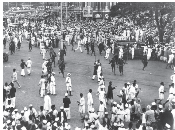
चित्र 8 - सत्याग्रहियों पर हमला करती पुलिस, 1930

महात्मा गांधी ने एक बार फिर आंदोलन वापस ले लिया। 5 मार्च 1931 को उन्होंने इरविन के साथ एक समझौते पर दस्तखत कर दिए। इस गांधी-इरविन समझौते के ज़रिए गांधीजी ने लंदन में होने वाले दूसरे गोलमेज़ सम्मेलन में हिस्सा लेने पर अपनी सहमति व्यक्त कर दी (पहले