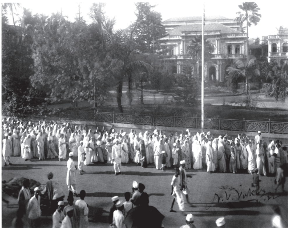
चित्र 9 - राष्ट्रवादी जुलूसों में औरतें भी शामिल थीं। राष्ट्रीय आंदोलन के दौरान बहुत सारी औरतें अपनी ज़िंदगी में पहली बार अपने घर से निकलकर सार्वजनिक क्षेत्र में आई थीं। इस चित्र में आप बच्चों को गोद में लिए बहुत सारी ज़्यादा उम्र वाली औरतों और माँओं को भी जुलूस में देख सकते हैं।

विदेशी कपड़ों व शराब की दुकानों की पिकेटिंग की। बहुत सारी महिलाएँ जेल भी गईं। शहरी इलाकों में ज़्यादातर ऊँची जातियों की महिलाएँ सक्रिय थीं जबकि ग्रामीण इलाकों में संपन्न किसान परिवारों की महिलाएँ आंदोलन में हिस्सा ले रही थीं। गांधीजी के आह्वान के बाद औरतों को राष्ट्र की सेवा करना अपना पवित्र दायित्व दिखाई देने लगा था। लेकिन सार्वजनिक भूमिका में इस इजाज़े का मतलब यह नहीं था कि औरतों की स्थिति में कोई भारी बदलाव आने वाला था। गांधीजी का मानना था कि घर चलाना, चूल्हा-चौका सँभालना, अच्छी माँ व अच्छी पत्नी की भूमिकाओं का निर्वाह करना ही औरत का असली कर्तव्य है। इसीलिए लंबे समय तक कांग्रेस संगठन में किसी भी महत्वपूर्ण पद पर औरतों को जगह देने से हिचकिचाती रही। कांग्रेस को उनकी प्रतीकात्मक उपस्थिति में ही दिलचस्पी थी।