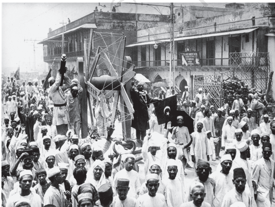
चित्र 4 - विदेशी कपड़े का बहिष्कार, जुलाई 1922 विदेशी कपड़ों को पश्चिमी आर्थिक एवं सांस्कृतिक प्रभुत्व का प्रतीक माना जाता था।

बहिष्कार : किसी के साथ संपर्क रखने और जुड़ने से इनकार करना या गतिविधियों में हिस्सेदारी, चीजों की खरीद व इस्तेमाल से इनकार करना। आमतौर पर यह विरोध का एक रूप होता है।