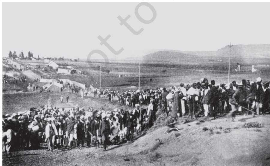
चित्र 2 - दक्षिण अफ़्रीका में भारतीय मज़दूर फ़ोक्सवर्स्ट से गुज़र रहे हैं,

महात्मा गांधी जनवरी 1915 में भारत लौटे। इससे पहले वे दक्षिण अफ़्रीका में थे। उन्होंने एक नए तरह के जनांदोलन के रास्ते पर चलते हुए वहाँ की