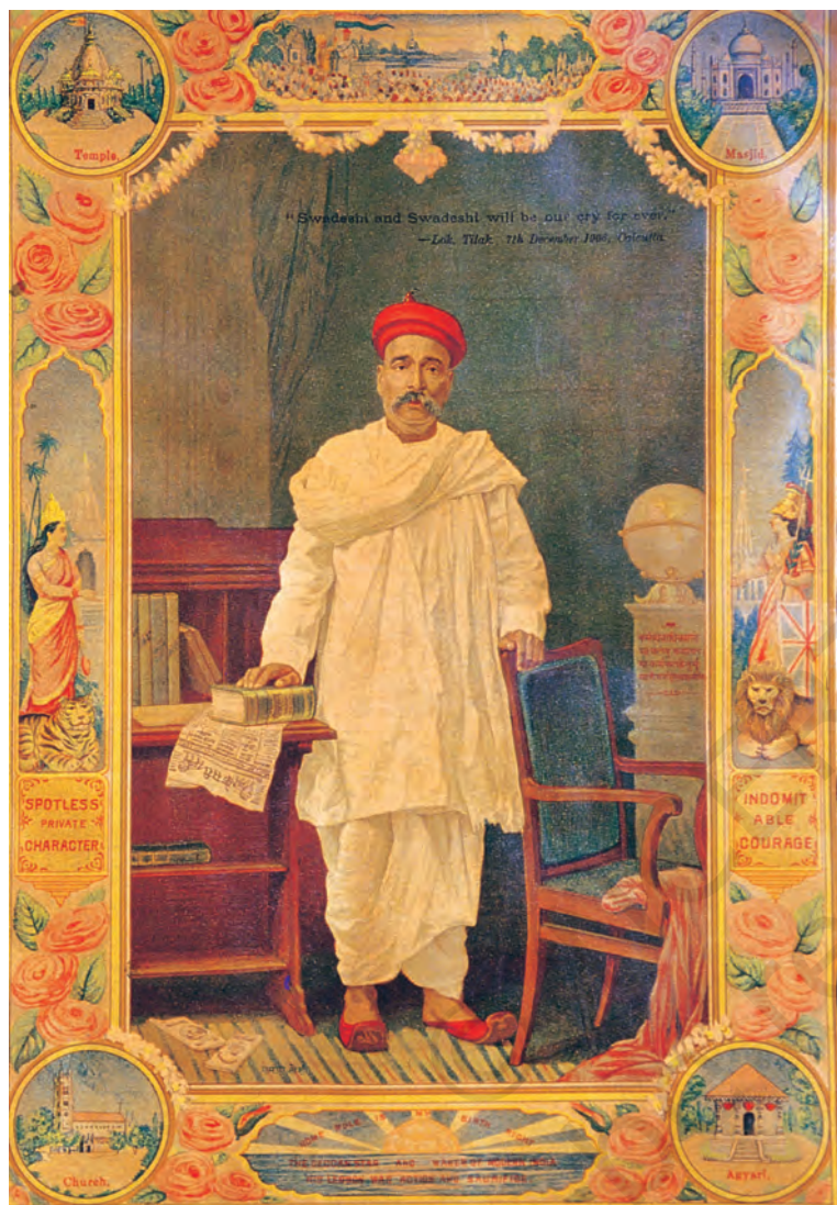
चित्र 11 - बालगंगाधर तिलक, बीसवीं सदी के शुरू की तस्वीर।

ध्यान से देखें कि तिलक एकता के प्रतीकों से घिरे हुए हैं। चित्र के चारों ओर विभिन्न धर्मों के पवित्र स्थान (मंदिर, चर्च, मस्जिद) चित्रित किए गए हैं।