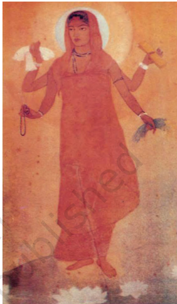
चित्र 12 - भारत माता, अबनीन्द्रनाथ टैगोर, 1905

राष्ट्रवाद का विचार भारतीय लोक कथाओं को पुनर्जीवित करने के आंदोलन से भी मजबूत हुआ। उन्नीसवीं सदी के आखिर में राष्ट्रवादियों ने भाटों व चारणों द्वारा गाई-सुनाई जाने वाली लोक कथाओं को दर्ज करना शुरू कर दिया। वे लोक गीतों व जनश्रुतियों को इकट्ठा करने के लिए गाँव-गाँव घूमने लगे। उनका मानना था कि यही कहानियाँ हमारी उस परंपरागत संस्कृति की सही तसवीर पेश करती हैं जो बाहरी ताकतों के प्रभाव से भ्रष्ट और दूषित हो चुकी है। अपनी राष्ट्रीय पहचान को ढूँढ़ने और अपने अतीत में गौरव का भाव पैदा करने के लिए इस लोक परंपरा को बचाकर रखना जरूरी था। बंगाल में खुद रबीन्द्रनाथ टैगोर भी लोक-गाथा गीत, बाल गीत और मिथकों