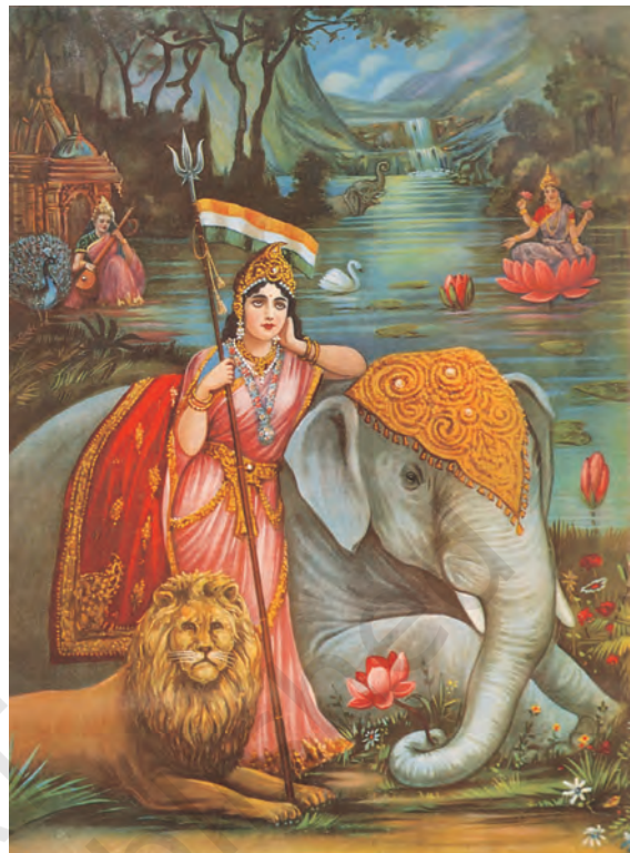
चित्र 14 - भारत माता।

लोगों को एकजुट करने की इन कोशिशों की अपनी समस्याएँ थीं। जिस अतीत का गौरवगान किया जा रहा था वह हिंदुओं का अतीत था। जिन