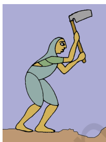
श्रम सभी संपत्तियों का स्रोत है।

उत्खनन सहित कृषि (जिसे प्राथमिक क्षेत्रक भी कहते हैं) और विनिर्माण (जिसे द्वितीयक क्षेत्रक भी कहते हैं), इन दो क्षेत्रकों के बीच उत्पादन-गतिविधियों का विभाजन आर्थिक विकास का संभवतः प्रथम दृष्टि स्वरूप था। यह विभाजन 'श्रम-विभाजन' की प्रक्रिया के माध्यम से हुआ। यह नाम अर्थशास्त्र के जनक एडम स्मिथ द्वारा दिया गया था। इस प्रक्रिया की संक्षिप्त व्याख्या नीचे की गई है।