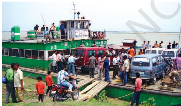
चित्र 7.5 – उत्तर-पूर्वी राज्यों में आंतरिक जलमार्ग परिवहन अधिक महत्वपूर्ण है

भारत के लोग प्राचीनकाल से समुद्री यात्राएँ करते रहे हैं। इसके नाविकों ने दूर तथा पास के क्षेत्रों में भारतीय संस्कृति व व्यापार को फैलाया है। जल परिवहन, परिवहन का सबसे सस्ता साधन है। यह भारी व स्थूलकाय वस्तुएँ ढोने में अनुकूल है। यह परिवहन साधनों में ऊर्जा सक्षम तथा पर्यावरण अनुकूल है। भारत में अंतः स्थलीय नौसंचालन जलमार्ग 14,500 किमी. लंबा है। एक देशव्यापी जलमार्ग नेटवर्क बनाने के लिए और देश में अंतर्देशीय जल परिवहन को रेल और सड़क परिवहन के एक किफायती, पर्यावरण अनुकूल पूरक माध्यम के रूप में बढ़ावा देने के लिए, 111 अंतर्देशीय जलमार्गों (पहले घोषित किए गए 5 राष्ट्रीय जलमार्गों सहित) को राष्ट्रीय जलमार्ग अधिनियम, 2016 द्वारा राष्ट्रीय जलमार्ग (NW) घोषित किया गया है (स्रोत: वार्षिक रिपोर्ट, पत्तन, पोत परिवहन और जलमार्ग मंत्रालय, भारत सरकार, 2023-24)।