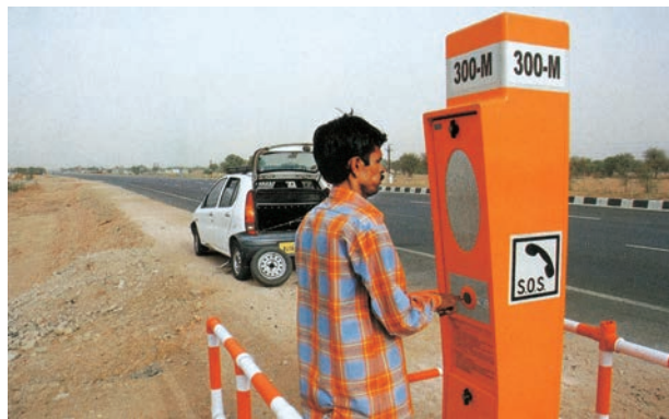
चित्र 7.10 - राष्ट्रीय राजमार्ग-48 पर एक आपातकालीन कॉल बॉक्स

डिजिटल भारत एक ज्ञान आधारित परिवर्तन के लिए, भारत को तैयार करने के लिए एक विशाल कार्यक्रम है। डिजिटल भारत कार्यक्रम का मुख्य उद्देश्य IT (भारतीय प्रतिभा) +IT (सूचना प्रौद्योगिकी)=IT (कल का भारत) में होने वाले परिवर्तन को समझना है और तकनीक को केन्द्र में रखकर बदलाव लाना है।