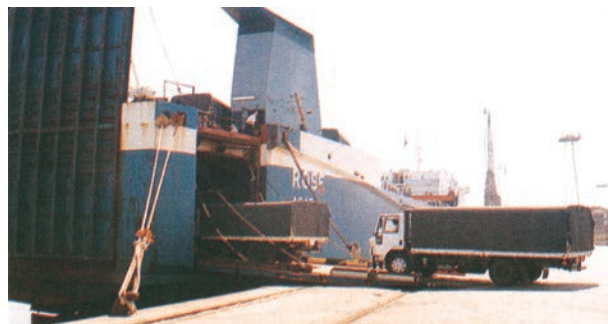
चित्र 7.6 – मुंबई पत्तन में जहाज पर ट्रकों को ले जाते हुए

मुंबई वृहत्तम पत्तन है जिसके प्राकृतिक खुले, विस्तृत व सुचारु पोताश्रय हैं। मुंबई पत्तन के अधिक परिवहन को ध्यान में रखकर इसके सामने जवाहरलाल नेहरू पत्तन विकसित किया गया जो इस पूरे क्षेत्र को एक समूह