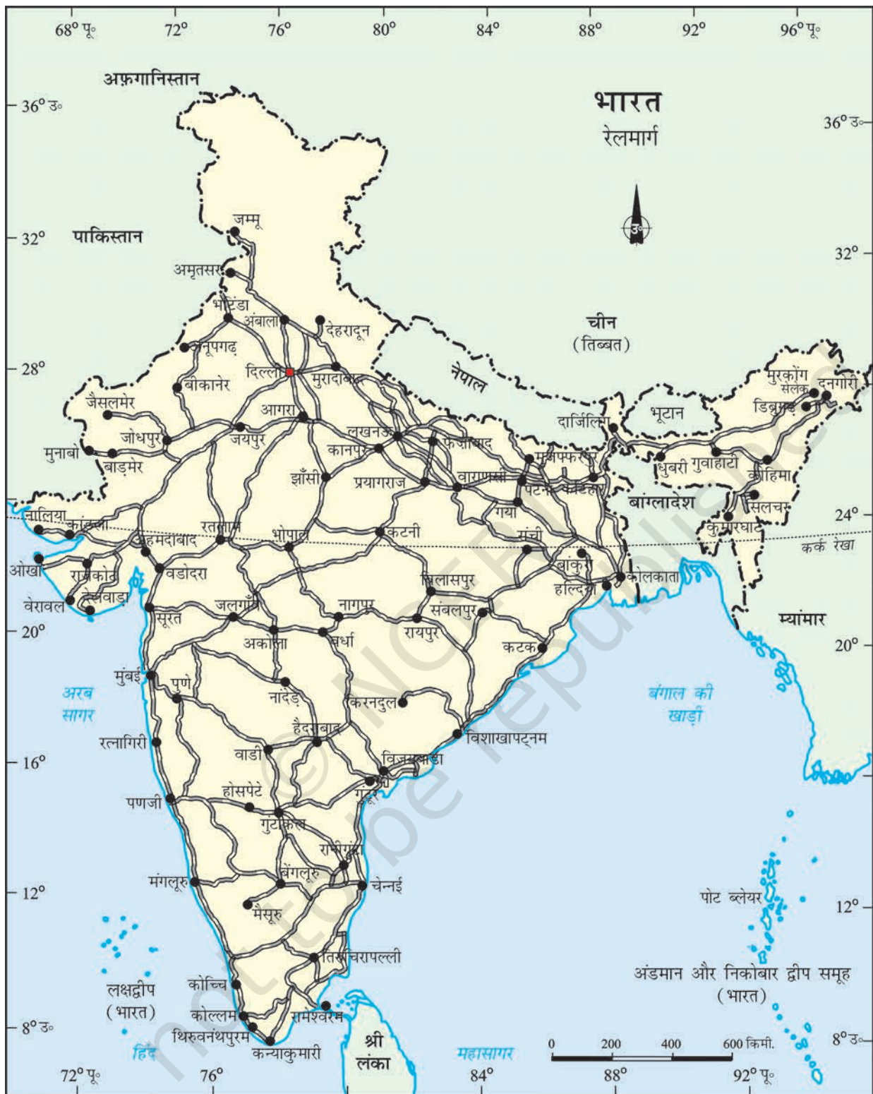
भारत - रेलमार्ग