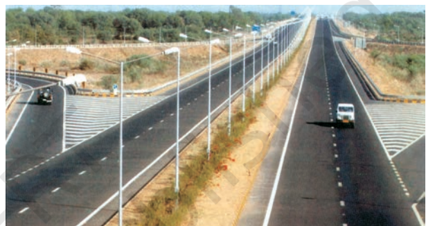
चित्र 7.1 – अहमदाबाद-वडोदरा द्रुतमार्ग