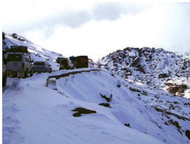
चित्र 7.4 – उत्तरी-पूर्वी सीमा सड़क पर यातायात (अरुणाचल प्रदेश)