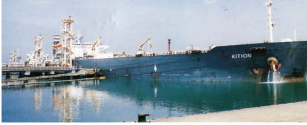
चित्र 7.7 – न्यू-मंगलौर पत्तन पर टैंकर द्वारा कच्चे तेल का निर्वहन

पत्तन की सुविधा भी प्रदान कर सके। लौह-अयस्क के निर्यात के संदर्भ में मुरगांव पत्तन देश का महत्वपूर्ण पत्तन है। यहाँ से देश के कुल निर्यात का आधा (50 प्रतिशत) लौह-अयस्क निर्यात किया जाता है। कर्नाटक में स्थित न्यू-मैंगलोर पत्तन कुद्रेमुख खानों से निकले लौह-अयस्क का निर्यात करता है। सुदूर दक्षिण-पश्चिम में कोचीन पत्तन है; यह एक लैगून के मुहाने पर स्थित एक प्राकृतिक पोताश्रय है।