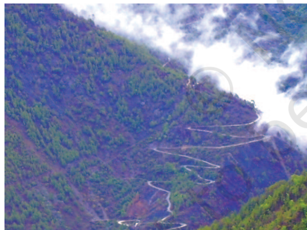
चित्र 7.3 – पहाड़ी रास्ते

देश में रेल परिवहन के वितरण को प्रभावित करने वाले कारकों में भू-आकृतिक, आर्थिक व प्रशासकीय कारक प्रमुख हैं। उत्तरी मैदान अपनी विस्तृत समतल