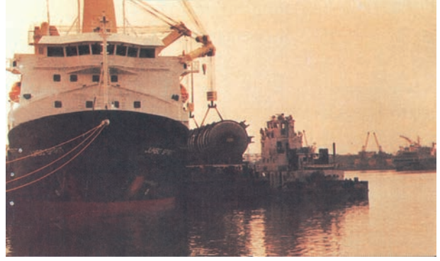
चित्र 7.8 – बड़े आकार के कार्गो को उठाने-रखने की सुविधाओं से युक्त वी.ओ. चिदंबरनार (तूतीकोरन) पत्तन

पूर्वी तट के साथ तमिलनाडु में दक्षिण-पूर्वी छोर पर वी.ओ. चिदंबरनार (तूतीकोरन) पत्तन है। यह एक प्राकृतिक पोताश्रय है तथा इसकी पृष्ठभूमि भी अत्यंत समृद्ध है। अतः यह पत्तन हमारे पड़ोसी देशों जैसे – श्रीलंका, मालदीव आदि तथा भारत के तटीय क्षेत्रों की भिन्न वस्तुओं के व्यापार को संचालित करता है। चेन्नई हमारे देश का प्राचीनतम कृत्रिम पत्तन है। व्यापार की मात्रा तथा लदे सामान के संदर्भ में इसका मुंबई के बाद दूसरा स्थान है। विशाखापट्टनम स्थल से घिरा, गहरा व सुरक्षित पत्तन है। प्रारम्भ में यह पत्तन लौह-अयस्क निर्यातक के रूप में विकसित किया गया था। ओडिशा में स्थित पारादीप पत्तन विशेषतः लौह-अयस्क का निर्यात करता है। श्यामाप्रसाद मुखर्जी, कोलकाता एक अंतः स्थलीय नदीय (Riverine) पत्तन है। यह पत्तन गंगा-ब्रह्मपुत्र बेसिन के वृहत् व समृद्ध पृष्ठभूमि को सेवाएँ प्रदान करता है। ज्वारीय (Tidal) पत्तन होने के कारण तथा हुगली के तलछट जमाव से इसे नियमित रूप से साफ करना पड़ता है। कोलकाता पत्तन पर बढ़ते व्यापार को कम करने हेतु हल्दिया सहायक पत्तन के रूप में विकसित किया गया है।