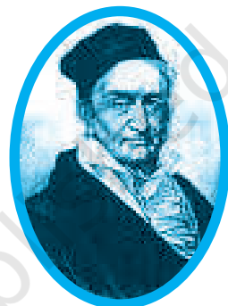
कार्ल फ्रैड्रिक गॉस (1777 – 1855)

अंकगणित की आधारभूत प्रमेय के रूप में विख्यात होने से पहले, प्रमेय 1.2 का संभवतया सर्वप्रथम वर्णन यूक्लिड के एलीमेंट्स की पुस्तक IX में साध्य (proposition) 14 के रूप में हुआ था। परंतु इसकी सबसे पहले सही उपपत्ति कार्ल फ्रैड्रिक गॉस (Carl Friedrich Gauss) ने अपनी कृति डिसक्विशंस अरिथिमेटिकी (Disquisitiones Arithmeticae) में दी। कार्ल फ्रैड्रिक गॉस को प्रायः 'गणितज्ञों का राजकुमार' कहा जाता है तथा उनका नाम सभी समयकालों के तीन महानतम गणितज्ञों में लिया जाता है, जिनमें आर्किमिडीज़ (Archimedes) और न्यूटन (Newton) भी सम्मिलित हैं। उनका गणित और विज्ञान दोनों में मौलिक योगदान है।