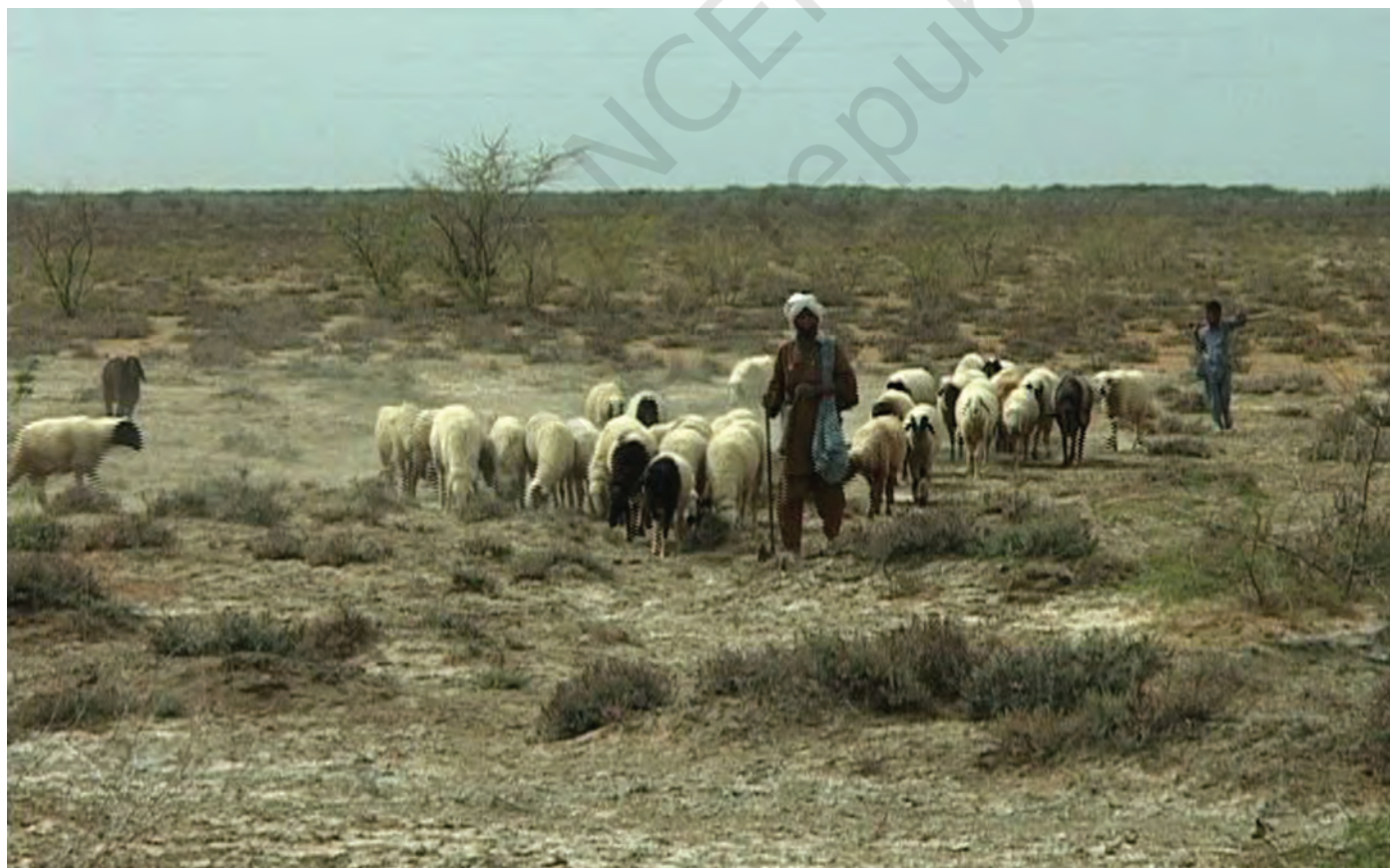
चित्र 10 - चरागाहों की तलाश में निकले मालधारी चरवाहे। उनके गाँव कच्छ की रन में स्थित हैं।

वंशावली बताने वाला समुदाय का इतिहास बताता है। इस तरह की मौखिक परंपराओं से चरवाहा समुदायों को अपनी पहचान का भाव मिलता है। इन परंपराओं से हम यह पता लगा सकते हैं कि कोई समूह अपने अतीत को किस तरह देखता है।