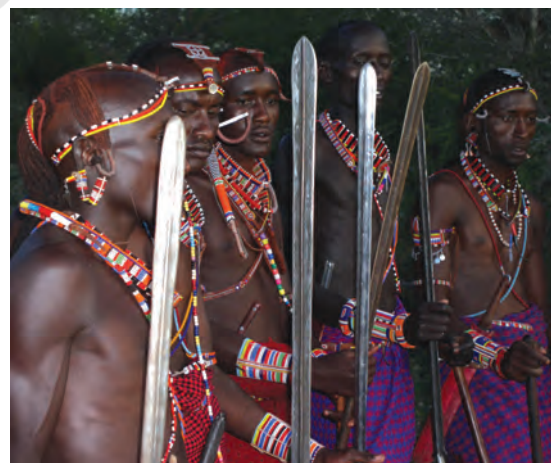
चित्र 16 – योद्धा गहरे लाल रंग की शुका और चमकदार मोतियों के आभूषण पहनते हैं तथा स्टील की नोक वाला पाँच फुट लंबा भाला रखते हैं। बारीकी से सँवारे गए उनके बाल गेरू से रंगे होते हैं। उगते सूरज को सम्मान देने के लिए वे पूर्व की ओर मुँह करके खड़े होते हैं। योद्धा अपने समुदाय की रक्षा करते हैं और लड़के पशुओं को चराते हैं। सूखे के मौसम में योद्धा और लड़के, दोनों ही पशु चराते हैं।

औपनिवेशिक काल में अफ्रीका के बाकी स्थानों की तरह मासाइलैंड में भी आए बदलावों से सारे चरवाहों पर एक जैसा असर नहीं पड़ा। उपनिवेश बनने से पहले मासाई समाज दो सामाजिक श्रेणियों में बँटा हुआ था – वरिष्ठ जन (एल्डर्स) और योद्धा (वॉरियर्स)। वरिष्ठ जन शासन चलाते थे। समुदाय से जुड़े मामलों पर विचार-विमर्श करने और अहम फैसले लेने के लिए वे समय-समय पर सभा करते थे। योद्धाओं में ज्यादातर नौजवान होते थे जिन्हें मुख्य रूप से लड़ाई लड़ने और कबीले की हिफाजत करने के लिए तैयार किया जाता था। वे समुदाय की रक्षा करते थे और दूसरे कबीलों के मवेशी छीन कर लाते थे। जहाँ जानवर ही संपत्ति हो वहाँ हमला करके दूसरों के जानवर छीन लेना एक महत्वपूर्ण काम होता था। अलग-अलग चरवाहा समुदायों की ताकत इन्हीं हमलों से तय होती थी। युवाओं को योद्धा वर्ग का हिस्सा तभी माना जाता था जब वे दूसरे समूह के मवेशियों को छीन कर और