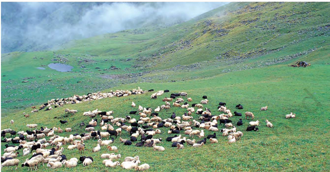
चित्र 1 - पूर्वी गढ़वाल के बुग्याल में चरती भेड़ें।

बुग्याल ऊँचे पहाड़ों पर 12,000 फुट से भी ज्यादा ऊँचाई पर स्थित विशाल प्राकृतिक चरागाह होते हैं। जाड़ों में ये बर्फ से ढके रहते हैं और अप्रैल के बाद हरे-भरे हो जाते हैं। इस समय पहाड़ियों की तलहटी तरह-तरह की घास, जड़ों और जड़ी-बूटियों से भरी रहती है। मॉनसून तक इन चरागाहों में घनी हरियाली छा जाती है और चारों तरफ फूल ही फूल दिखाई देने लगते हैं।