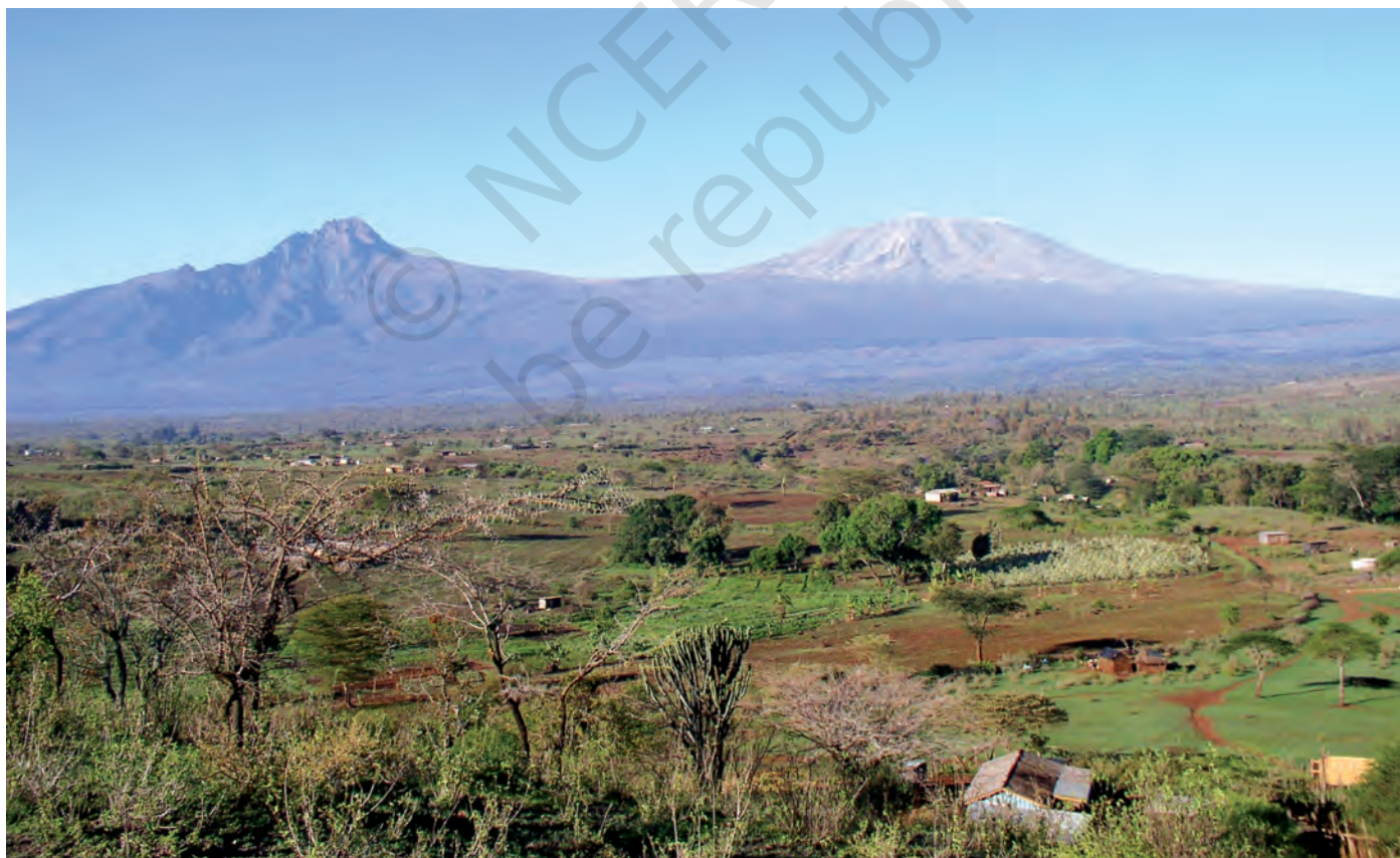
चित्र 12 - मासाई लैंड जिसके पीछे किलिमंजारो पहाड़ दिखाई दे रहे हैं।

हिंदुस्तान की तरह अफ्रीकी चरवाहों की ज़िंदगी में भी औपनिवेशिक और उत्तर-औपनिवेशिक काल में गहरे बदलाव आए हैं। आखिर क्या थे ये बदलाव?