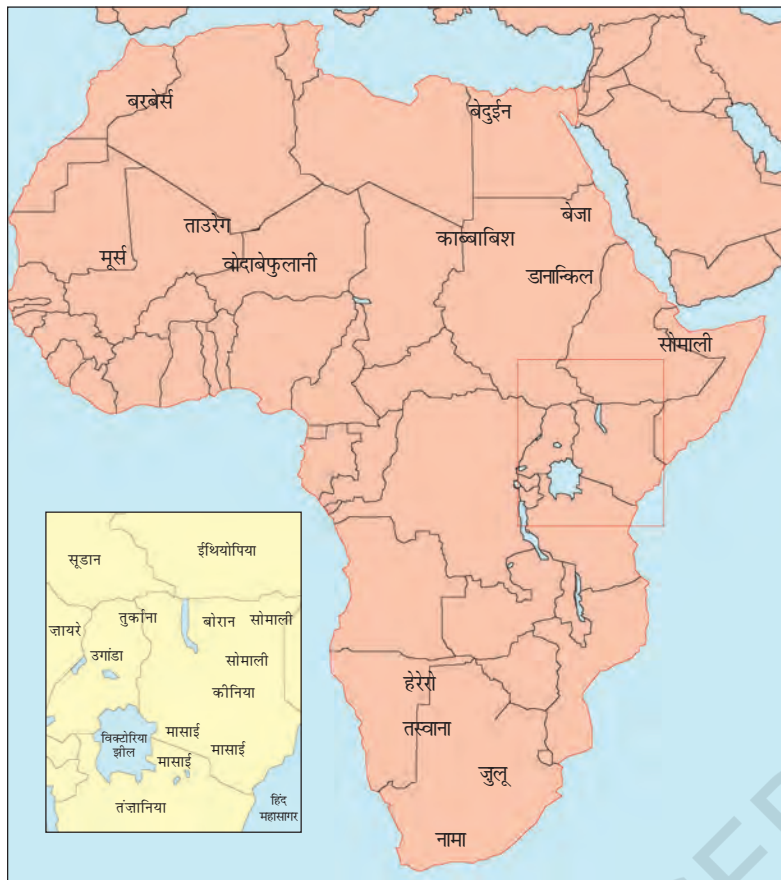
चित्र 13 - अफ्रीका के चरवाहा समुदाय.

छोटी तस्वीर (इनसेट) में कीनिया और तंजानिया में मासाइयों का इलाका दर्शाया गया है।