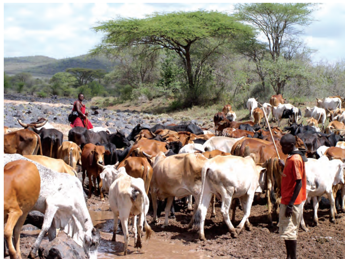
चित्र 15 - मासाई नाम 'मा' शब्द से निकला है। मा-साई का मतलब होता है 'मेरे लोग'। परंपरागत रूप से मासाई घुमंतू और चरवाहा समुदाय के लोग होते हैं जो अपनी आजीविका के लिए दूध और मांस पर आश्रित रहते हैं। ऊँचे तापमान और कम वर्षा के कारण यहाँ शुष्क, धूल भरे और बेहद गर्म हालात रहते हैं। इस अर्ध-शुष्क विषुववृत्तीय इलाके में सूखे के हालात सामान्य हैं। ऐसे समय में बहुत सारे जानवर मर जाते हैं।