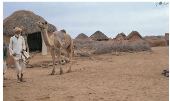
चित्र 6 - अपने ऊँट के साथ एक ऊँटपालक.

यह राजस्थान में जैसलमेर के निकट थार का रेगिस्तान है। इस इलाके के ऊँट पालकों को मारु (रेगिस्तान) राइका और उनकी बस्ती को ढंडी कहा जाता है।