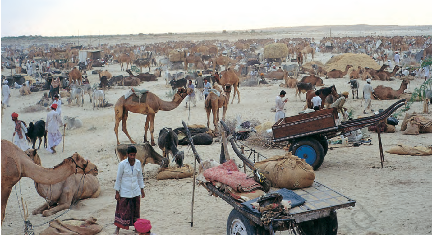
चित्र 7 - पश्चिमी राजस्थान में बलोतरा स्थित ऊँट मेला.

ऊँटपालक यहाँ ऊँटों की खरीद-फरोख के लिए आते हैं। मेले में मारू राइका ऊँटों के प्रशिक्षण में अपनी महारत का भी प्रदर्शन करते हैं। इस मेले में गुजरात से घोड़े भी लाए जाते हैं।