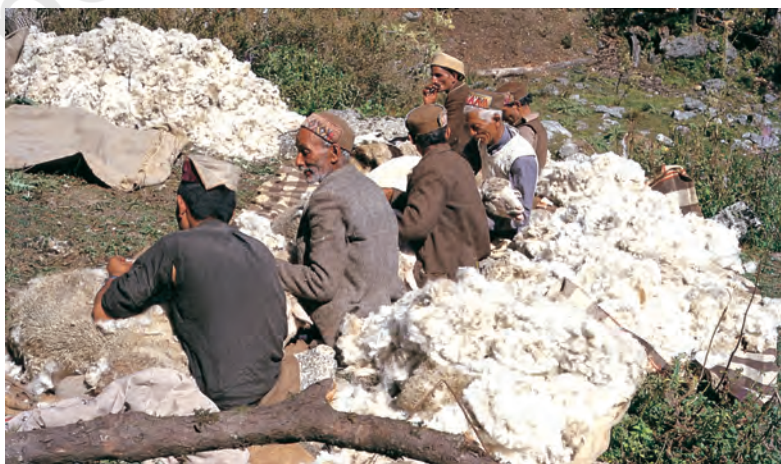
चित्र 4 - गद्दी भेड़ों की ऊन उतार रहे हैं।

भाबर : गढ़वाल और कुमाऊँ के इलाके में पहाड़ियों के निचले हिस्से के आसपास पाए जाने वाला शुष्क या सूखे जंगल का इलाका। बुग्याल : ऊँचे पहाड़ों में स्थित घास के मैदान।