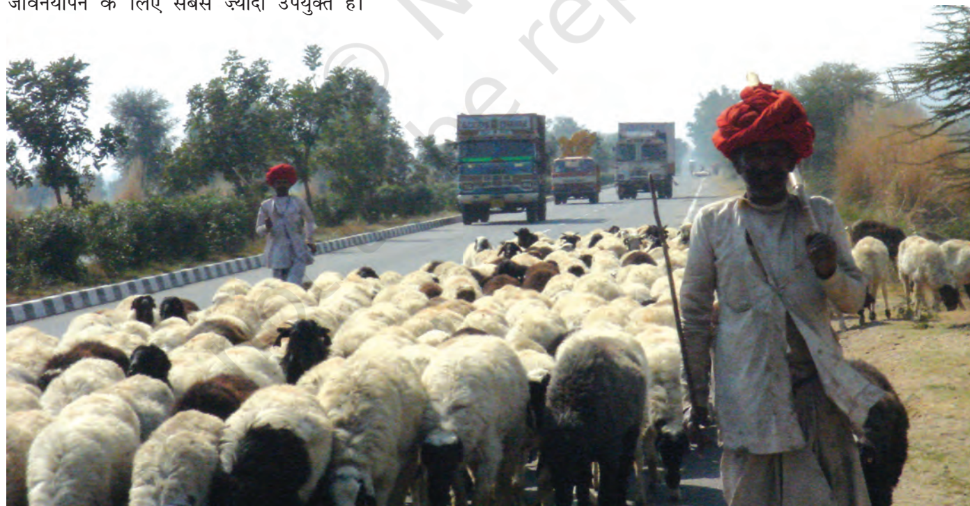
चित्र 18 - जयपुर राजमार्ग पर राइका गड़रिये.

चरवाहे अतीत के अवशेष नहीं हैं। वे ऐसे लोग नहीं हैं जिनके लिए आज की आधुनिक दुनिया में कोई जगह नहीं है। पर्यावरणवादी और अर्थशास्त्री अब इस बात को काफ़ी गंभीरता से मानने लगे हैं कि घुमंतू चरवाहों की जीवनशैली दुनिया के बहुत सारे पहाड़ी और सूखे इलाकों में जीवनयापन के लिए सबसे ज्यादा उपयुक्त है।