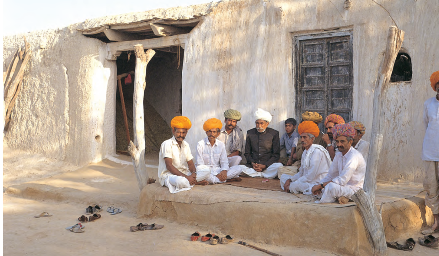
चित्र 9 - मारू राइकाओं की वंशावली बताने वाला.

वंशावली बताने वाला समुदाय का इतिहास बताता है। इस तरह की मौखिक परंपराओं से चरवाहा समुदायों को अपनी पहचान का भाव मिलता है। इन परंपराओं से हम यह पता लगा सकते हैं कि कोई समूह अपने अतीत को किस तरह देखता है।