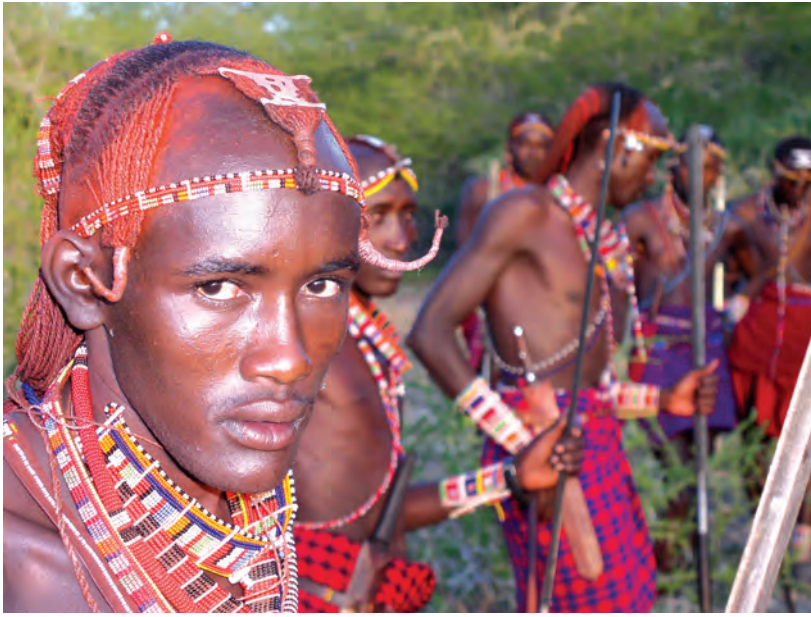
चित्र 17 - आज भी योद्धा बनने के लिए युवकों को व्यापक अनुष्ठानों से गुजरना पड़ता है हालाँकि अब यह प्रथा पहले जैसी प्रचलित नहीं है। इसके लिए युवकों को लगभग चार माह तक अपने कबीले के इलाके का दौरा करना पड़ता है। इस यात्रा के अंत में वे छापामारों की तरह दौड़कर अपने अहाते में घुसते हैं। इस समारोह के मौके पर युवक ढीले कपड़े पहनते हैं और पूरे दिन नाचते रहते हैं। इस अनुष्ठान के साथ ही वे जीवन के एक नए चरण में पहुँच जाते हैं। लड़कियों को इस तरह के अनुष्ठानों से नहीं गुजरना पड़ता।

युद्ध में बहादुरी का प्रदर्शन करके अपनी मर्दानगी साबित कर देते थे। फिर भी वे वरिष्ठ जनों के नीचे रह कर ही काम करते थे।