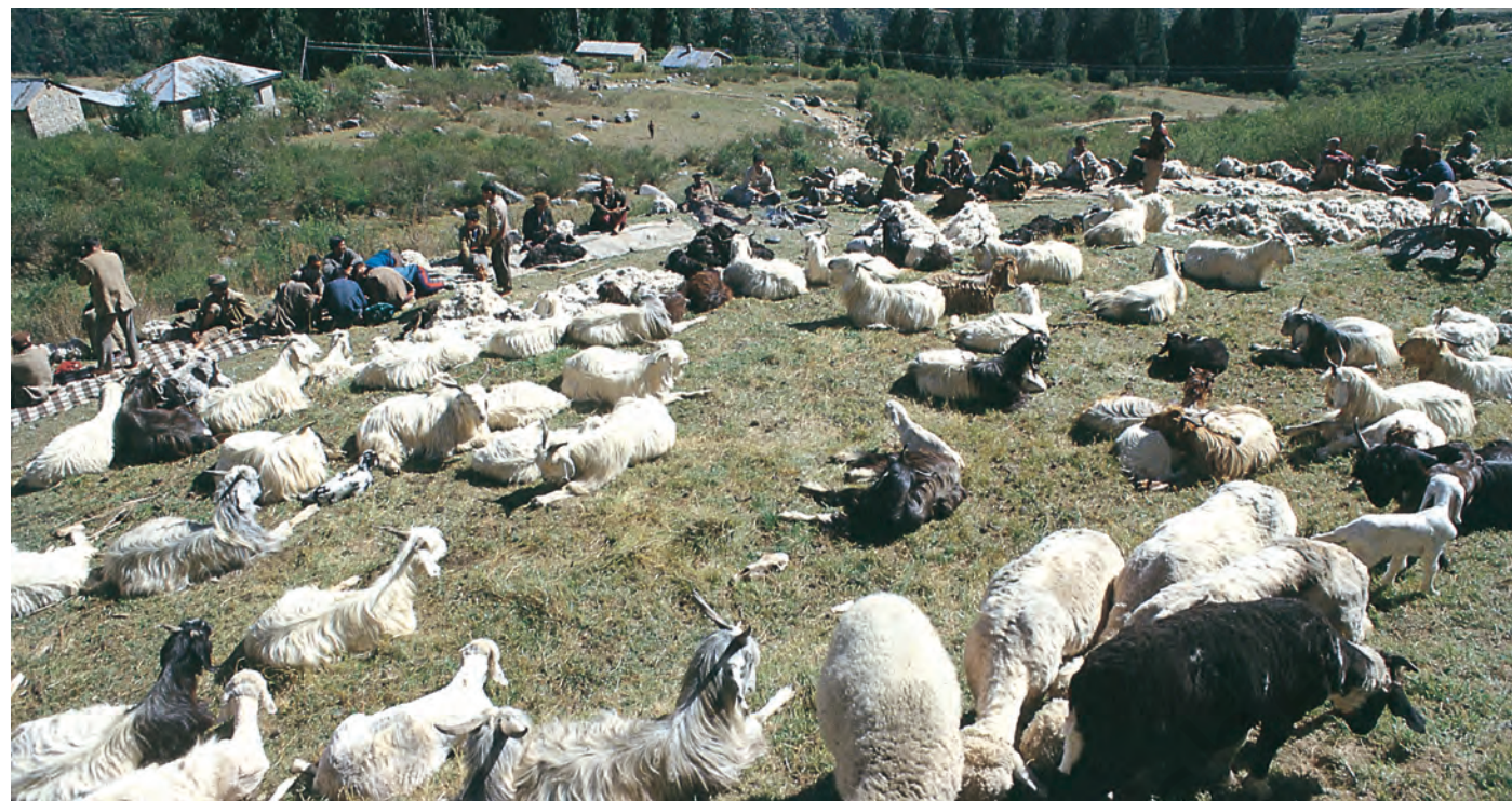
चित्र 3 - ऊन उतरने का इंतज़ार। हिमाचल प्रदेश स्थित पालमपुर के पास उहल घाटी।

और स्पीति के गाँवों में एक बार फिर कुछ समय के लिए रुकते। इस बीच वे गर्मियों की फ़सलें काटते और सर्दियों की फ़सलों की बुवाई करके आगे बढ़ जाते। यहाँ से वे अपने रेवड़ लेकर शिवालिक की पहाड़ियों में जाड़ों वाले चरागाहों में चले जाते और अगली अप्रैल में भेड़-बकरियाँ लेकर वे दोबारा गर्मियों के चरागाहों की तरफ़ रवाना हो जाते।