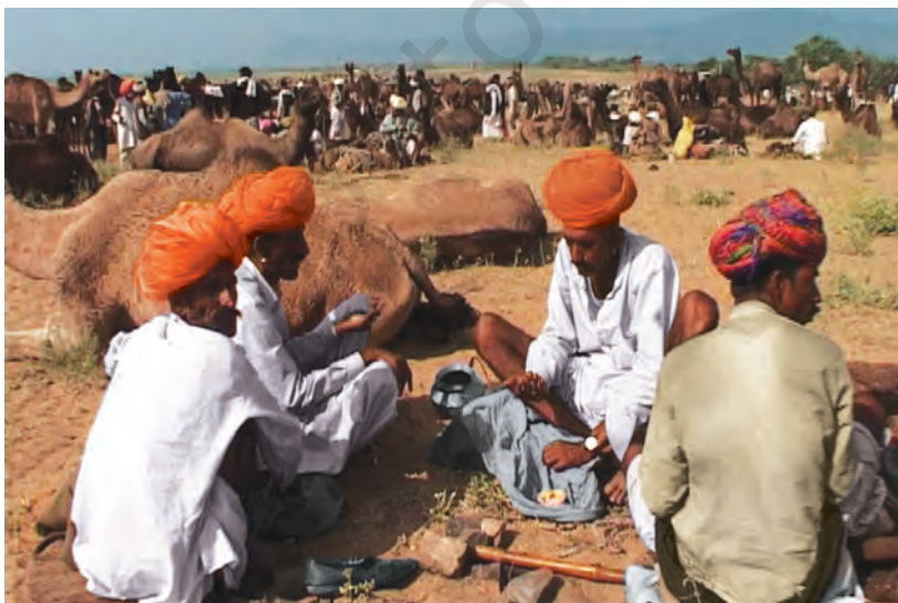
चित्र 8 - पुष्कर का ऊँट मेला.

आइए, अब देखें कि औपनिवेशिक शासन के दौरान यानी अंग्रेज़ों के ज़माने में चरवाहों का जीवन किस तरह बदला?