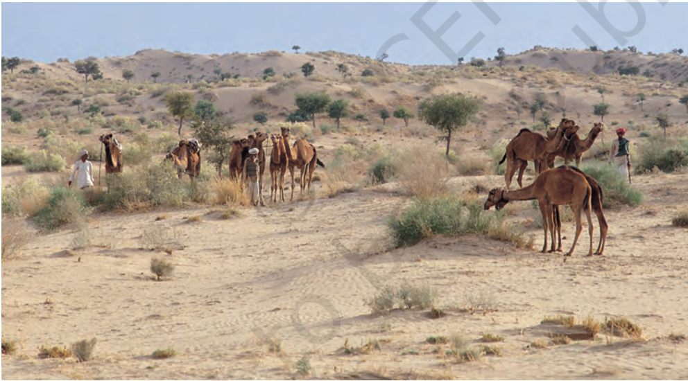
चित्र 5 - पश्चिमी राजस्थान के थार रेगिस्तान में चरते राइका समुदाय के ऊँट.

धंगर महाराष्ट्र का एक जाना-माना चरवाहा समुदाय है। बीसवीं सदी की शुरुआत में इस समुदाय की आबादी लगभग 4,67,000 थी। उनमें से ज्यादातर गड़रिये या चरवाहे थे हालाँकि कुछ लोग कम्बल और चादरें भी बनाते थे जबकि कुछ भैंस पालते थे। धंगर गड़रिये बरसात के दिनों में महाराष्ट्र के मध्य पठारों में रहते थे। यह एक अर्ध-शुष्क इलाका था जहाँ बारिश बहुत कम होती थी और मिट्टी भी खास उपजाऊ नहीं थी। चारों तरफ सिर्फ कंटीली झाड़ियाँ होती थीं। बाजरे जैसी सूखी फ़सलों के अलावा यहाँ और कुछ नहीं उगता था। मॉनसून में यह पट्टी धंगरों के जानवरों के लिए एक विशाल चरागाह बन जाती थी। अक्टूबर के आसपास धंगर बाजरे की कटाई करते थे और चरागाहों की तलाश में पश्चिम की तरफ चल पड़ते थे। करीब महीने भर पैदल चलने के बाद वे अपने रेवड़ों के साथ कोंकण के इलाके में जाकर डेरा डाल देते थे। अच्छी बारिश और उपजाऊ मिट्टी की बदौलत इस इलाके में खेती खूब होती थी। कोंकणी किसान भी इन चरवाहों का दिल खोलकर स्वागत करते थे। जिस समय धंगर कोंकण पहुँचते थे उसी समय कोंकण के किसानों को खरीफ़ की फ़सल काट कर अपने खेतों को रबी की फ़सल के लिए दोबारा उपजाऊ बनाना होता था।