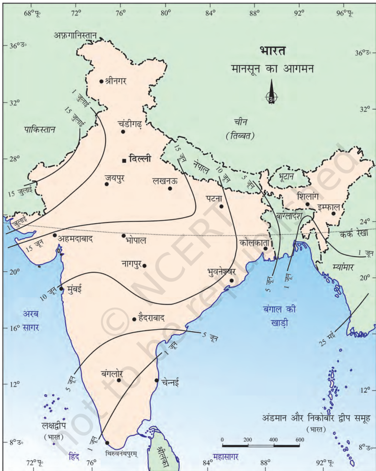
चित्र 4.1 : मानसून का आगमन