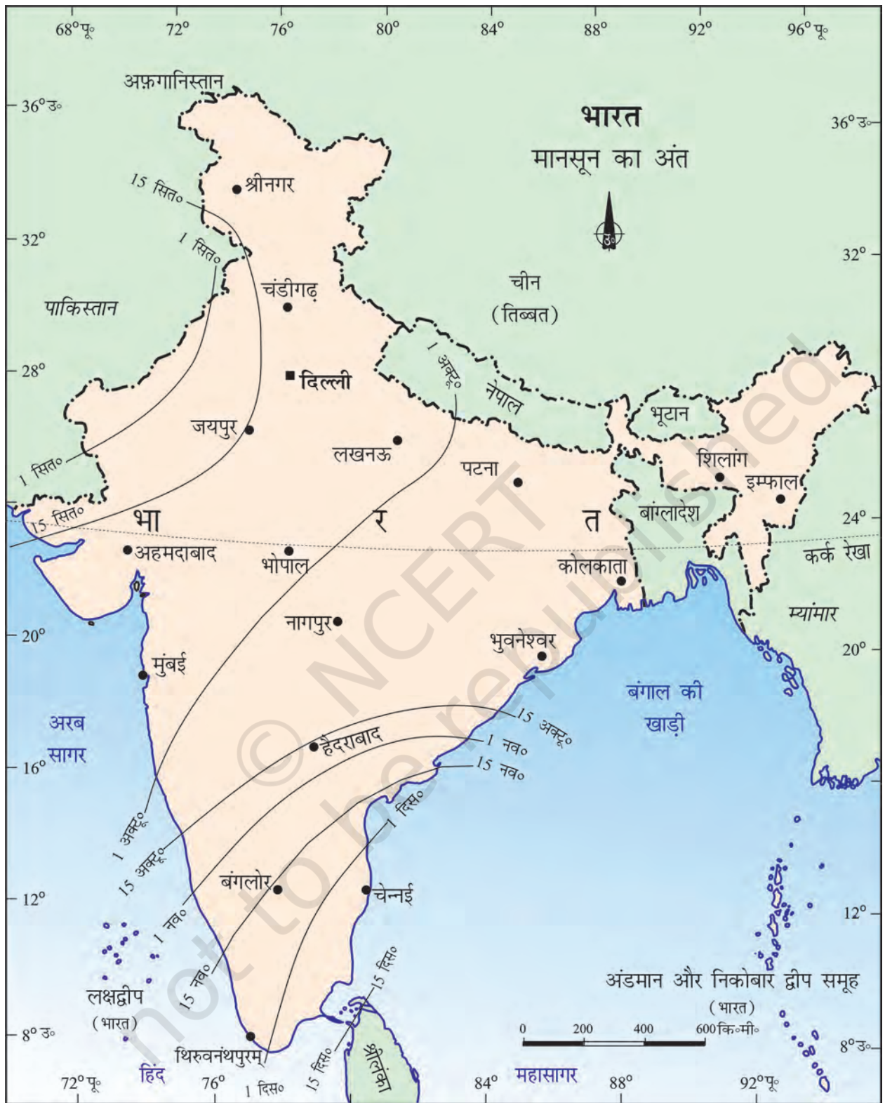
चित्र 4.2 : मानसून का अंत