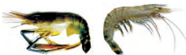
मेक्रोब्रेकियम रोजेनबर्गी (ताज़ा पानी) पीनियस मोनोडोन (समुद्री)

भविष्य में समुद्री मछलियों का भंडार (stock) कम होने की अवस्था में इन मछलियों की पूर्ति संवर्धन के द्वारा हो सकती है। इस प्रणाली को समुद्री संवर्धन (मेरीकल्चर) कहते हैं।