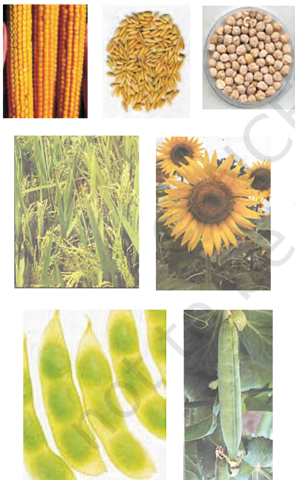
चित्र 12.1: विभिन्न प्रकार की फसलें

ऊर्जा की आवश्यकता के लिए अनाज; जैसे गेहूँ, चावल, मक्का, बाजरा तथा ज्वार से कार्बोहाइड्रेट प्राप्त होता है। दालें जैसे चना, मटर, उड़द, मूँग, अरहर, मसूर से प्रोटीन प्राप्त होती है और तेल वाले बीजों; जैसे सोयाबीन, मूँगफली, तिल, अरंड, सरसों, अलसी तथा सूरजमुखी से हमें आवश्यक वसा प्राप्त होती है (चित्र 12.1)। सब्जियाँ, मसाले तथा फलों से हमें विटामिन तथा खनिज लवण, कुछ मात्रा में प्रोटीन, वसा तथा कार्बोहाइड्रेट भी प्राप्त होते हैं। चारा फसलें; जैसे वर्सीम, जई अथवा सूडान घास का उत्पादन पशुधन के चारे के रूप में किया जाता है।