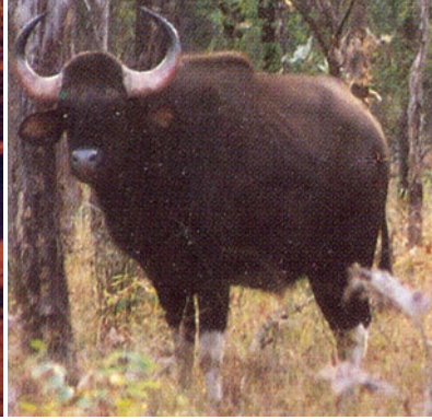
चित्र 5.5 : जंगली भैंसा।