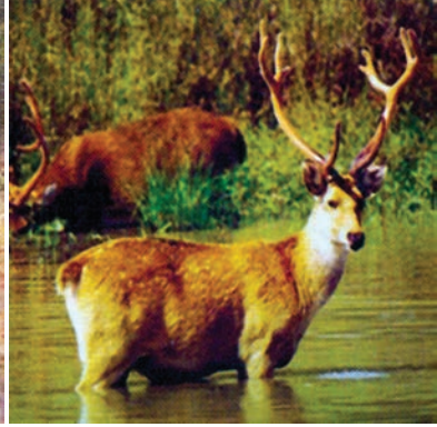
चित्र 5.6 : बारहसिंघा।