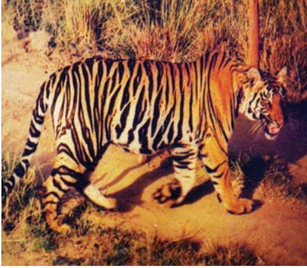
चित्र 5.4 : बाघ।