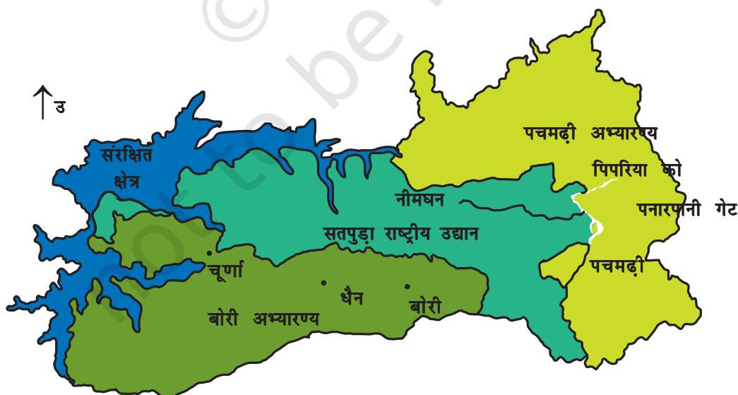
चित्र 5.1 : पचमढ़ी जैवमण्डल आरक्षित क्षेत्र।