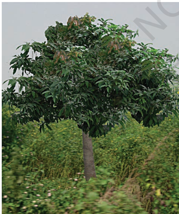
चित्र 5.3(a) : जंगली आम।

माधवजी ने पचमढ़ी जैवमण्डल आरक्षित क्षेत्र में स्थित साल और जंगली आम [चित्र 5.3(a)] के पेड़ को