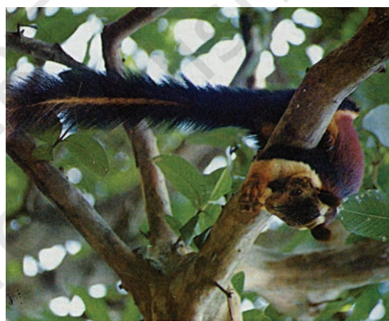
चित्र 5.3(b) : विशाल गिलहरी।