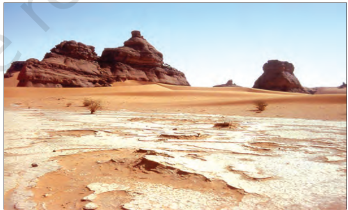
चित्र 7.1 : सहारा रेगिस्तान

रेगिस्तान के बारे में सोचते समय आपके मस्तिष्क में तुरंत ही रेत का दृश्य उभरता है। परंतु सहारा मरुस्थल बालू की विशाल परतों से ढँका हुआ ही नहीं वरन् वहाँ बजरी के मैदान और नग्न चट्टानी सतह वाले उत्थित पठार भी पाए जाते हैं। ये चट्टानी सतहें कुछ स्थानों पर 2500 मीटर से भी अधिक ऊँची हैं।