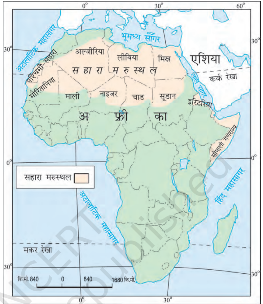
चित्र 7.2 : अफ्रीका महाद्वीप में सहारा

आपको यह जानकर आश्चर्य होगा कि आज का सहारा रेगिस्तान एक समय में पूर्णतया हरा-भरा मैदान था। सहारा की गुफाओं से प्राप्त चित्रों से ज्ञात होता है कि यहाँ नदियाँ तथा मगर पाए जाते थे। हाथी, शेर, जिराफ़, शतुरमुर्ग, भेड़, पशु तथा बकरियाँ सामान्य जानवर थे। परंतु यहाँ के जलवायु परिवर्तन ने इसे बहुत गर्म व शुष्क प्रदेश में बदल दिया है।