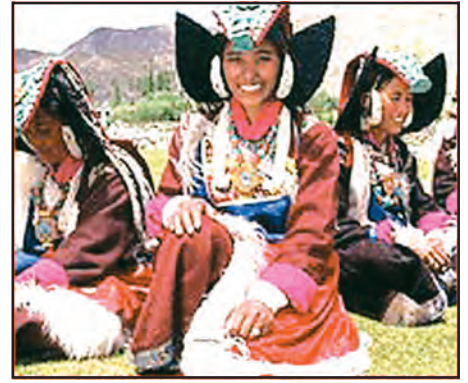
चित्र 7.6 : पारंपरिक वेशभूषा में लद्दाखी महिलाएँ

आधुनिकीकरण के फलस्वरूप यहाँ के जनजीवन में परिवर्तन आ रहा है। लेकिन लद्दाख के लोगों ने शताब्दियों से प्रकृति के साथ समन्वय एवं संतुलन करना सीखा है। जल एवं ईंधन जैसे संसाधनों की कमी के कारण ये आवश्यकतानुसार एवं मितव्ययिता से ही इनका उपयोग करते हैं और कुछ भी व्यर्थ नहीं करते।