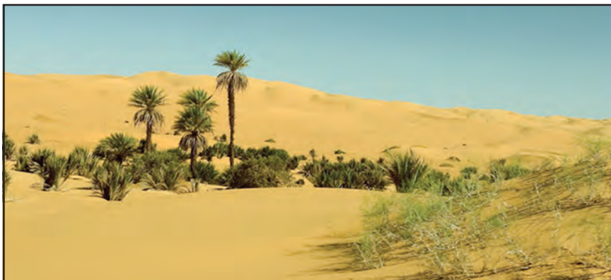
चित्र 7.3 : सहारा रेगिस्तान में मरूद्यान

ऊँट, लकड़बग्घा, सियार, लोमड़ी, बिच्छू, साँपों की विभिन्न जातियाँ एवं छिपकलियाँ यहाँ के प्रमुख जीव-जंतु हैं।