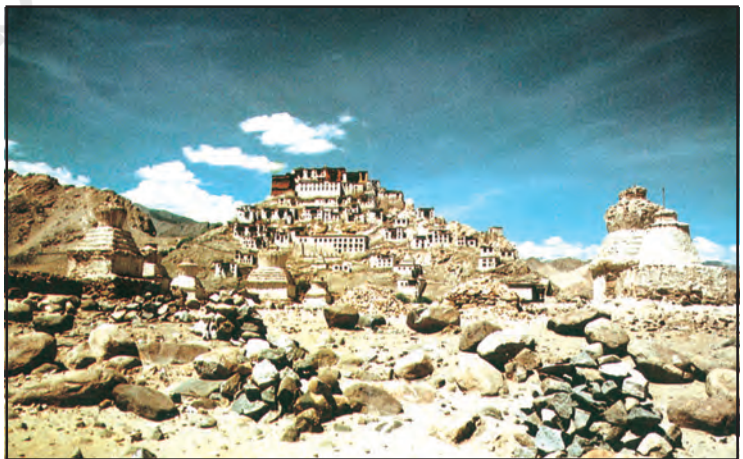
चित्र 7.5 : थिकसे मठ

ग्रीष्म ऋतु में यहाँ के निवासी जौ, आलू, मटर, सेम एवं शलजम की खेती करते हैं। शीत ऋतु में जलवायु इतनी कष्टकारी होती है कि लोग धार्मिक अनुष्ठानों एवं उत्सवों में अपने आपको व्यस्त रखते हैं। यहाँ की महिलाएँ अत्यधिक परिश्रमी होती हैं। वे केवल घर एवं खेतों में ही काम नहीं करती बल्कि छोटे व्यवसाय एवं दुकानें भी संभालती हैं। लद्दाख की राजधानी लेह, सड़क एवं वायुमार्ग द्वारा भलीभाँति जुड़ी हुई है। राष्ट्रीय राजमार्ग-1 लेह को जोजीला दर्रा होते हुए कश्मीर घाटी से जोड़ता है। क्या आप हिमालय के कुछ अन्य दर्रा के बारे में बता सकते हैं?