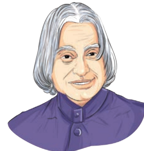
ए.पी.जे. अब्दुलः कलामः