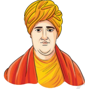
स्वामी दयानन्दः सरस्वती