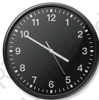
मॉरिशस में घड़ी